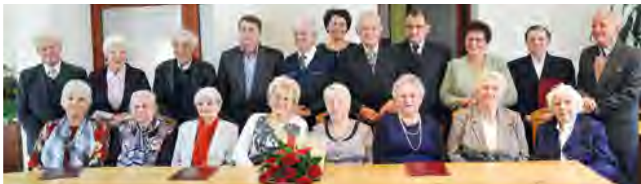
Jubilaci na uroczystym spotkaniu w Urzędzie Gminy w Tczewie.