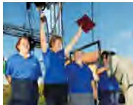
Koło Gospodyń Wiejskich z Tczewskich Łąk.