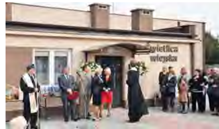
Uroczyste poświęcenie zmodernizowanej świetlicy w Dąbrówce.

Podziękowaniom i prezentom nie było końca. Wszyscy goście oraz mieszkańcy obu sołectw zostali zaproszeni na poczęstunek do świetlicy, gdzie odbyło się wspólne biesiadowanie przy muzyce.