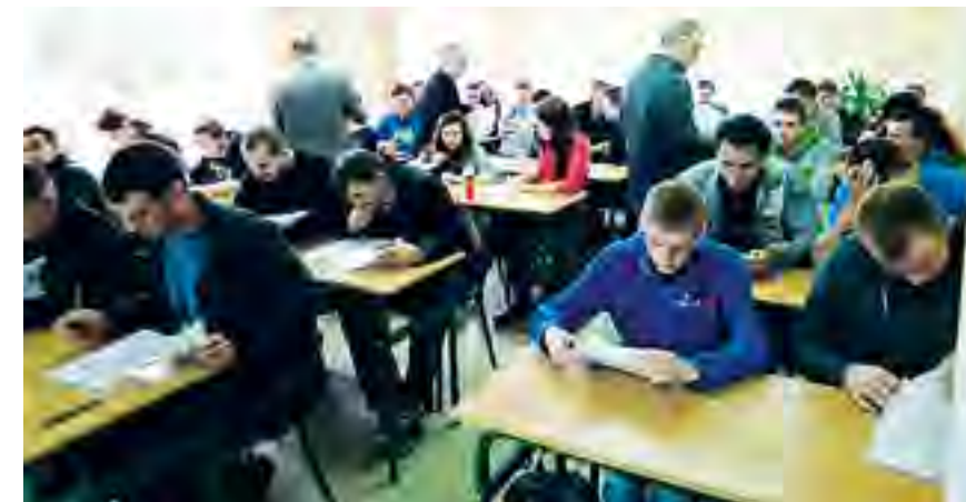
Zmagania młodych rolników podczas rozwiązywania testu.