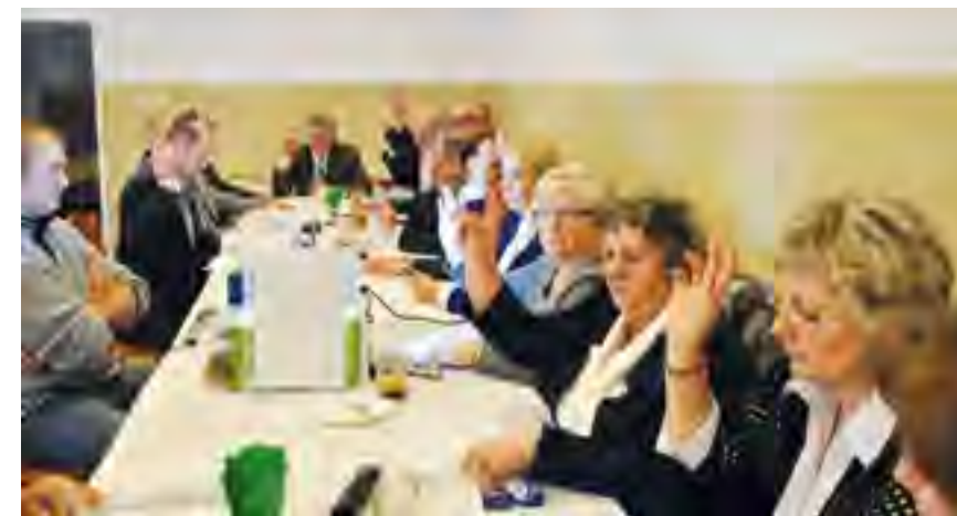
Radni Gminy Tczew podjęli uchwałę w sprawie obniżenia stawki za wywóz odpadów komunalnych.

Radni podjęli także uchwały w sprawie zmiany budżetu gminy Tczew na rok 2013, w sprawie zmiany Wieloletniej Prognozy Finansowej Gminy Tczew, w sprawie zbycia nieruchomości wchodzących w skład gminnego zasobu nieruchomości, uchwały w sprawie skargi na działalność Wójta oraz w sprawie uchwalenia Statutu Gminy Tczew.