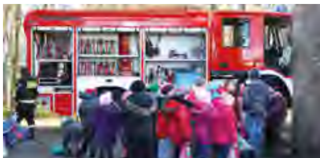
Pierwszoklasiści z ZKiW w Turzu uczestniczyli w zajęciach dotyczących bezpieczeństwa.

Maluchy z ochotą i zainteresowaniem utrwały wiedzę i praktyczne umiejętności dotyczące bezpiecznego zachowania się w drodze do szkoły, a także w sytuacjach bezpośredniego zagrożenia życia. Zaznajomili się ze sposobem korzystania ze sprzętu ratowniczego. Dużym zainteresowaniem dzieci cieszył krótki instruktaż „małego rowerzysty”. Ciekawym podsumowaniem zajęć była obserwacja sprzętu strażackiego. Za aktywny udział w zajęciach uczniowie zostali nagrodzeni maskotką z funkcją odblasku.