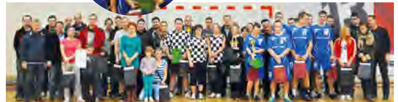
Uczestnicy Turnieju Piłki Siatkowej o Puchar Wójta Gminy Tczew.