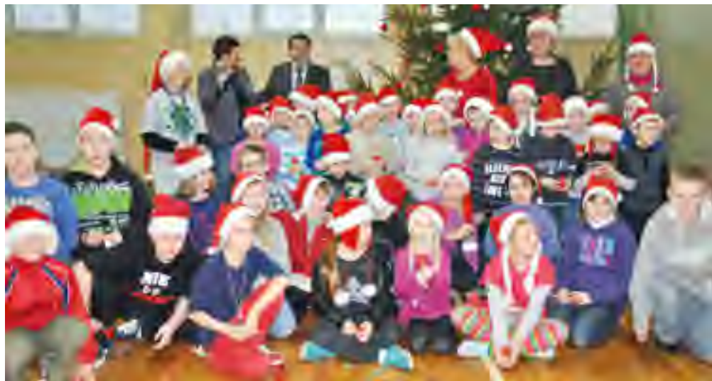
Mikołajkowe zabawy w Szkole Podstawowej w Lubiszewie.

W szkołach na terenie naszej gminy lekcje były skrócone, a na uczniów czekały niespodzianki przygotowane przez dyrektorów szkół. Były konkursy, zabawy oraz prezenty.