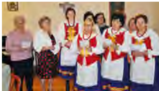
Panie z Koła Gospodyń Wiejskich z Czarlina uświetniły uroczystość wspólnym śpiewaniem pieśni.

oraz popularyzowanie idei pełnego udziału seniorów w rozwoju kulturalnym i ekonomicznym społeczeństwa. Ze swojej roli świetnie wywiązując się pełni życia i pogody ducha emeryci z Czarlina, którym energii i woli życia pozazdrościć mógłby niejeden młody.