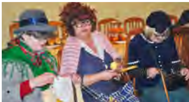
Panie z Rady Sołeckiej rozbawiały seniorów do łez.

Na zakończenie wszyscy seniorzy otrzymali prezenty od Rady Sołeckiej. Osobom, którym ciężko było ze względów zdrowotnych dotrzeć na spotkanie, zostanie im dostarczony upominek do domu przez Panią Sołtys.