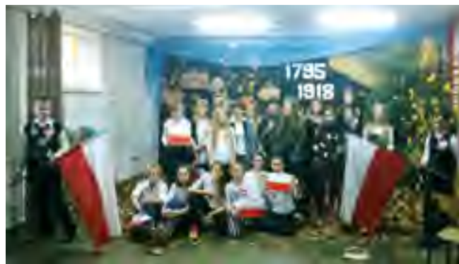
Akademie z okazji Święta Niepodległości w ZKiW w Turzu.