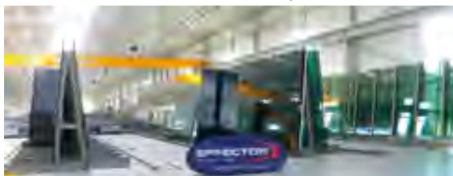
Nowa firma w Wędkowach zajmująca się produkcją szyb zespolonych.

Nowy oddział spółki Effect Glass został przeniesiony ze Starogardu Gdańskiego do miejscowości Wędkowy. Zmiana siedziby zakładu produkcyjnego była spowodowana niewystarczającymi warunkami lokalowymi oraz brakiem realnych perspektyw rozwoju. Możliwości produkcyjne w Starogardzie Gdańskim wy-