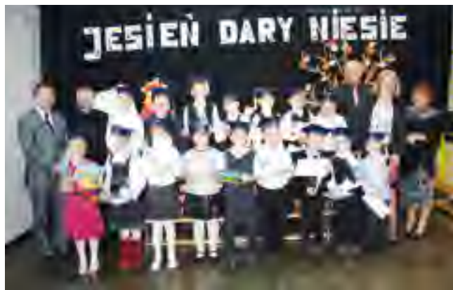
Pasowanie pierwszoklasistów w ZKiW u Turzu.

Pierwszoklasistom życzymy radości, wspianiałych kolegów i koleżanek oraz wielu sukcesów w naszej szkole.