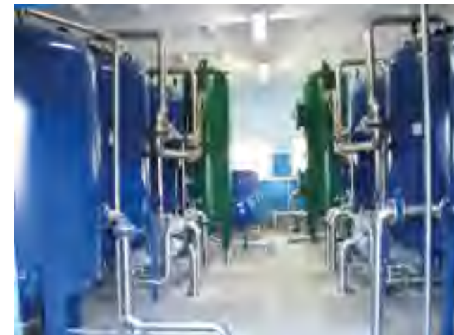
Stacja uzdatniania wody w Waćmierku.

Teren obejmujący projekt znajduje się w atrakcyjnym dla inwestorów miejscu, tuż przy skrzyżowaniu autostrady A1 i drogi krajowej nr 22. W 2010 r. został on wyróżniony w IV edycji konkursu ogólnopolskiego Grunt na Medal. Teraz jego atrakcyjność wzrosła jeszcze bardziej poprzez uzbrojenie tych terenów. Mamy nadzieję, że niebawem pojawią się przedsiębiorcy, którzy zain-