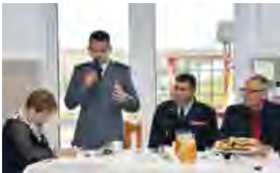
O działalności policji i straży pożarnej rozmawiano na XXXI sesji Rady Gminy Tczew.

Radni Gminy Tczew podjęli również uchwały w sprawie zmiany budżetu gminy Tczew na rok 2013, w sprawie zmiany Wieloletniej Prognozy Finansowej Gminy Tczew, w sprawie wyrażenia woli przystąpienia do opracowania i wdrażania Planu gospodarki niskoemisyjnej, a także podjęto uchwałę zmieniającą uchwałę w sprawie zawarcia Porozumienia Międzygminnego z Gminą Miejską Tczew w sprawie powierzenia Gminie Miejskiej Tczew wykonywania zadania własnego Gminy Tczew w zakresie utrzymywania składowisk i unieszkodliwiania odpadów.