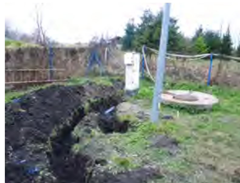
Przebudowa przepompowni w Rokitkach.

Zakres prac przy przebudowie przepompowni ścieków w Rokitkach obejmuje budowę przepompowni ścieków sanitarnych wraz z pompami i wyposażeniem zlokalizowanej na terenie istniejącej pompowni, która zostanie zlikwidowana. Zadaniem nowej przepompowni będzie tłoczenie ścieków do istniejącego układu rurociągów tłocznych. Podobnie będą przebiegały prace przy przebudowie przepompowni ścieków w Stanisławiu. Ze względu na wielkość przepompowni, koszt przebudowy przepompowni ścieków w Rokitkach wynosi prawie 250 tys. zł, a w Stanisławiu ok. 100 tys. zł.