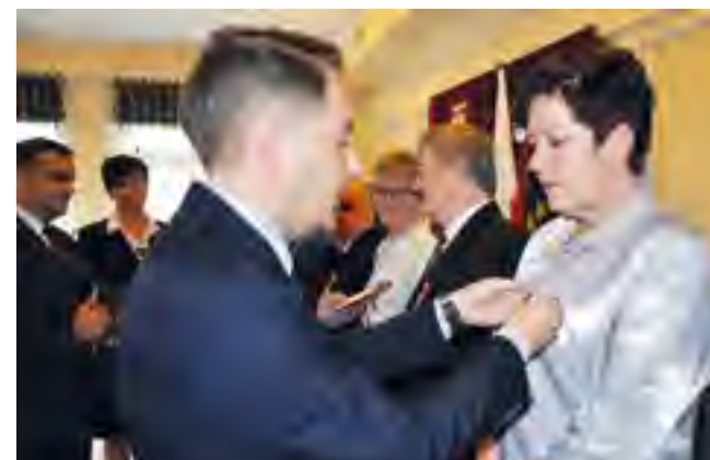
Wicewojewoda Michał Owczarczak wręczył odznaczenia pracownikom socjalnym.

Starosta Powiatu Tczewskiego Józef Puczyński wręczył wszystkim dyrektorom domów pomocy społecznej nagrody oraz życzenia dla wszystkich pracowników socjalnych.