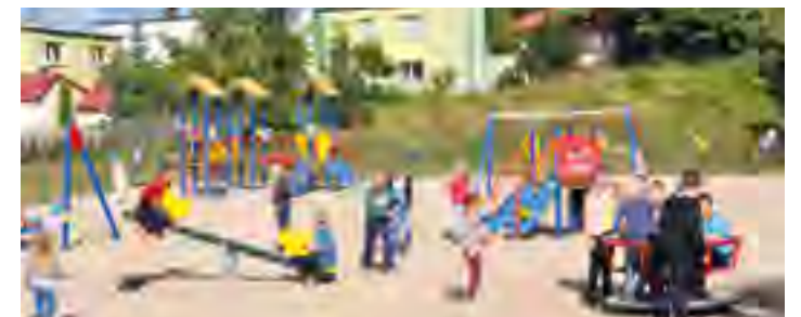
Plac zabaw w Rokitkach.

Powierzchnia placu wynosi 1462,4 m 2 . Tam zamontowane zostały urządzenia zabawowe takie jak: wieża ze ścianką wspinaczkową, trzy wieże, dwie huśtawki wahadłowe, huśtawka wagowa dwuosobowa, bujak konik i karuzela. Ponadto w ramach zadania zamontowano ławki, a plac zabaw został ogrodzony.