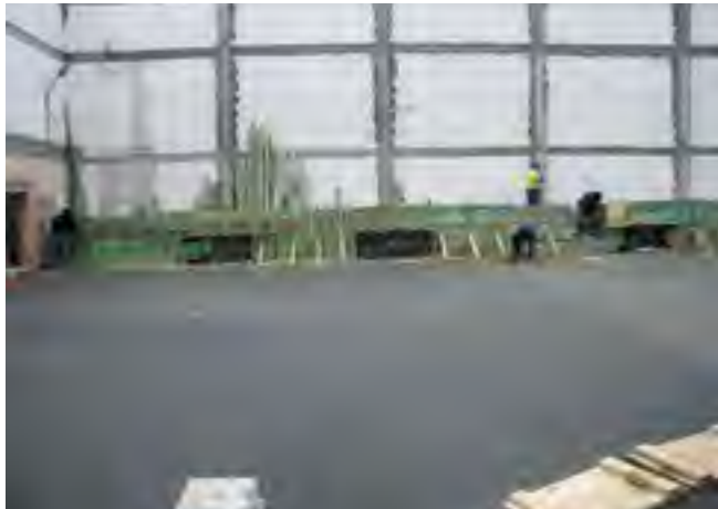
Budowa sali gimnastycznej w Miłobądku.

Budowa potrwa do lipca 2014 roku i już w przyszłym roku szkolnym uczniowie cieszyć się będą nową salą gimnastyczną, która będzie miała 483,80 m 2 , trybuny dla publiczności na 50 osób. Boisko będzie o wymiarach 12mx24m i dostosowane zostanie do gry w piłkę ręczną, siatkową, koszykową i tenisa ziemnego. Taki obiekt umożliwi w przyszłości organizowanie różnych turniejów sportowych. W ramach zadania zakupiony zostanie sprzęt sportowy, m.in.: piłki, materace, ławki gimnastyczne oraz inne akcesoria sportowe niezbędne do prowadzenia lekcji z wychowania fizycznego. Koszt zadania to 1,8 mln zł.