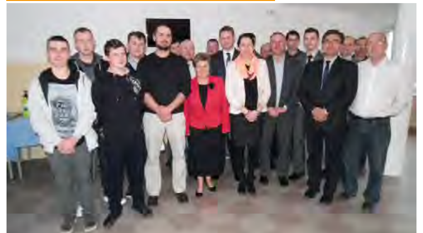
Uczestnicy Olimpiady Młodych Producentów Rolnych wraz z zaproszonymi gośćmi.