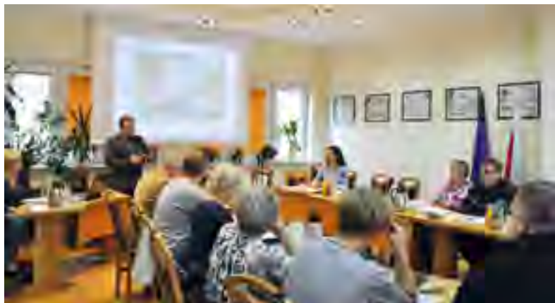
Spotkanie z sołtysami.

Kolejno omówione zostały sprawy związane z gospodarką komunalną. W związku z tym, że ustawa śmieciowa weszła w życie z początkiem lipca znane są już pierwsze zestawienia dotyczące kosztów zagospodarowania odpadów i ich wywozu. Władze gminy planują zaproponować Radzie Gminy obniżenie stawek za odbiór odpadów od kwietnia przyszłego roku. Po kilku miesiącach funkcjonowania systemu gospodarki odpadami w Gminie Tczew i powtórnej analizie kosztów funkcjonowania systemu możliwe jest zaproponowanie Radzie Gminy zmniejszenia stawek opłaty za gospodarowanie odpadami komunalnymi. Stawka opłaty za gospodarowanie odpadami komunalnymi zostanie określona na takim poziomie, aby pokryła koszty funkcjonowania całego systemu.