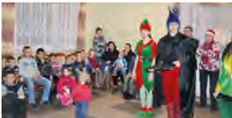
Mikołajkowa zabawa w Miłobądzu.

Najmłodsi mieszkańcy sołectwa Miłobądz 3 grudnia bawili się na zabawie mikołajkowej. Dzieci wraz z rodzicami licznie przybyły do świetlicy wiejskiej w Miłobądzu, aby spotkać się z Mikołajem.