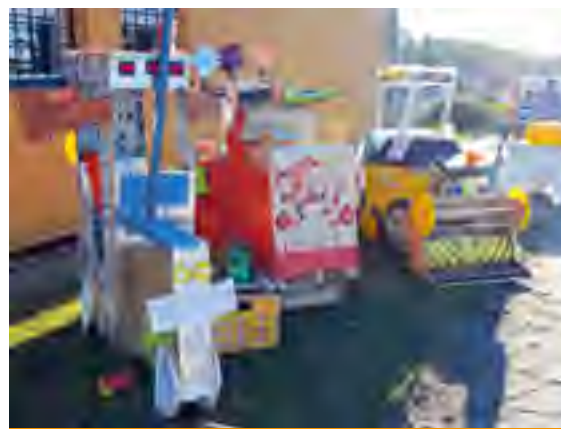
Ekologiczne maszyny rolnicze.