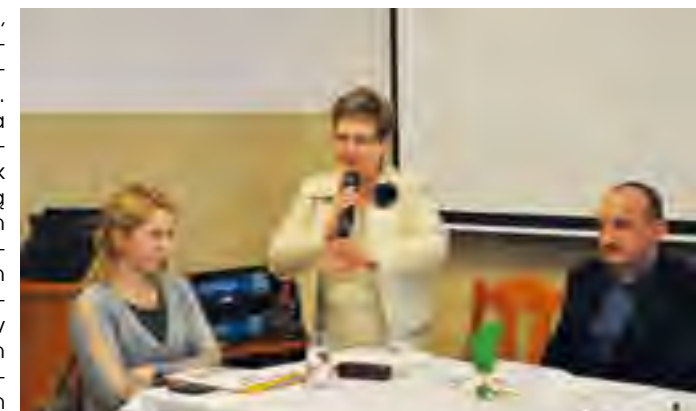
Zaproszeni goście mówili o sytuacji w rolnictwie.

Radni podjęli także uchwały w sprawie zmiany budżetu gminy Tczew na rok 2013, w sprawie zmiany Wieloletniej Prognozy Finansowej Gminy Tczew, w sprawie zbycia nieruchomości wchodzących w skład gminnego zasobu nieruchomości, uchwały w sprawie skargi na działalność Wójta oraz w sprawie uchwalenia Statutu Gminy Tczew.