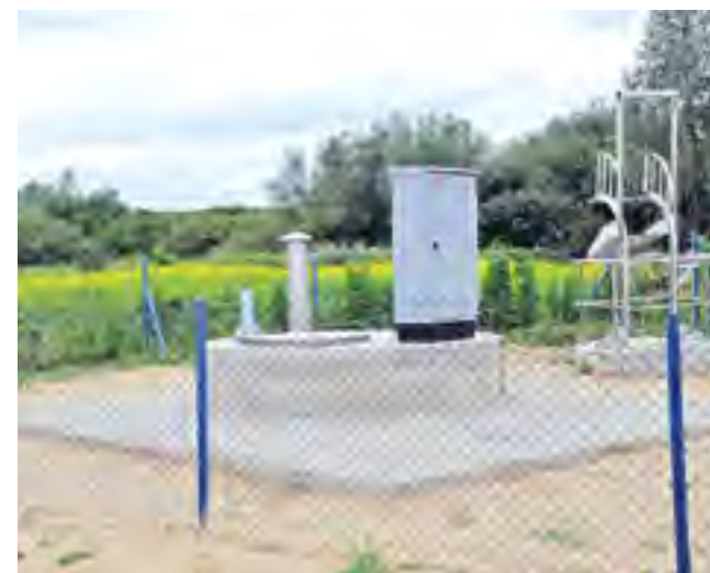
Przepompownia ścieków w Rokitkach.

Dnia 25.06.2014 r. dokonano protokolarnego odbioru robót związanych z przebudową przepompowni ścieków w Rokitkach. W ramach zadania dotychczasowa przepompownia została zlikwidowana, a w jej miejsce wybudowano nową wraz z pompami i wyposażeniem, której zadaniem będzie tłoczenie ścieków do istniejącego układu rurociągów tłocznych. Ponadto wybudowano odcinek kanalizacji sanitarnej fi 200 PVC od istniejącej gminnej sieci kanalizacyjnej do połączenia z przepompownią oraz odcinek sieci kanalizacji sanitarnej tłocznej fi 110 PVC od przepompowni do połączenia z istniejącym rurociągiem tłocznym fi 110 PVC. Koszt zadania to 244 tys. zł.