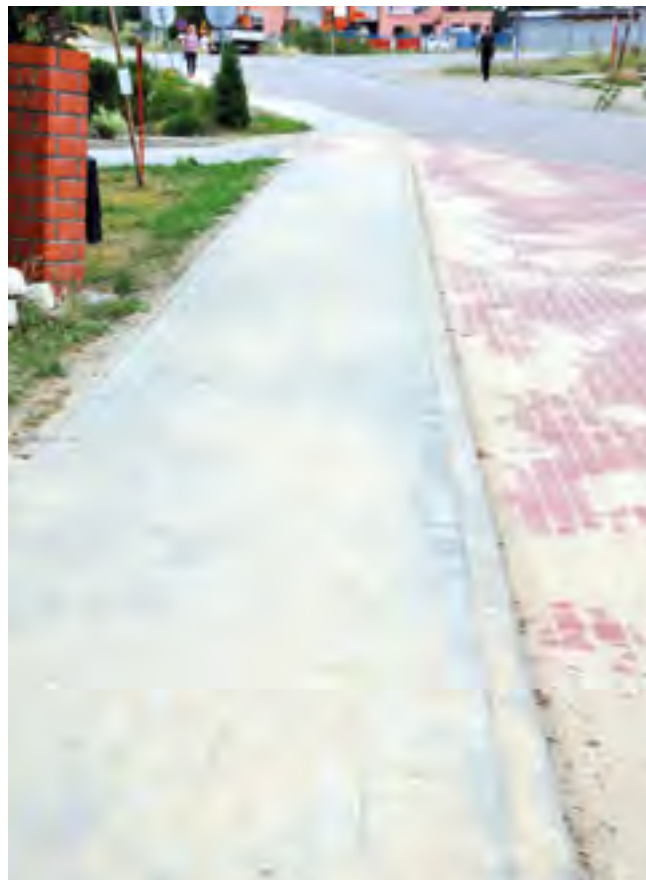
Czarlin, ul. Lipowa.

1 lipca 2014r. zakończono przebudowę chodnika w ciągu ul. Lipowej w Czarlinie. Zakres prac obejmował przebudowę chodnika na odcinku 596 mb o szerokości 1,5m od skrzyżowania z drogą krajową nr 22 do skrzyżowania z drogą wewnętrzną. Zadanie obejmowało całkowitą wymianę nawierzchni chodnika, która wykonana została z kostki brukowej na podsypce cementowo – piaskowej, wymianę krawężników i obrzeży wraz z całkowitą wymianą nawierzchni zatoki autobusowej. Podczas prac związanych z wymianą nawierzchni zatoki autobusowej wyregulowany zostanie wpust uliczny znajdujący się na jej początku, aby wody opadowe z powierzchni zatoki i chodnika mogły zostać prawidłowo i skutecznie odprowadzone. Całkowity koszt inwestycji to ponad 134 tys. zł.