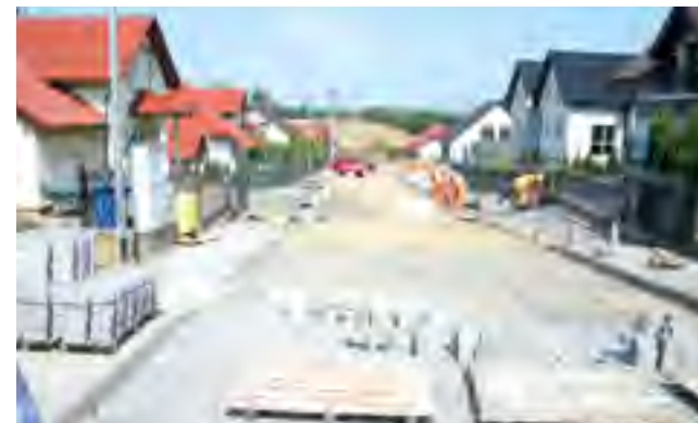
Rokitki, ul. Kwiatowa.

Dobiega końca przebudowa ulicy Kwiatowej w Rokitkach. Zakres zadania obejmuje przebudowę układu drogowego na odcinku 935,45 mb pomiędzy licznymi zabudowaniami. Obecnie w ramach zadania wybudowana została kanalizacja deszczowa, a także przebudowana została sieć wodociągowa. Z obu stron jezdni zaprojektowane są ciągi pieszce. Nawierzchnia drogi oraz chodnika wykonana będzie z kostki brukowej betonowej. Wybudowane zostaną także wjazdy i podejścia do posesji. Całkowity koszt zadania to ponad 1,9 mln zł. Inwestycja ta realizowana jest przy udziale finansowym właścicieli posesji znajdujących się przy tej ulicy.