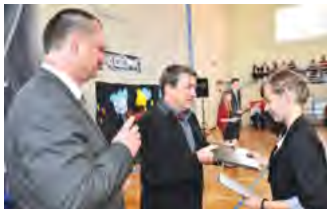
Wójt wręczył stypendia dla wybitnie uzdolnionych uczniów.