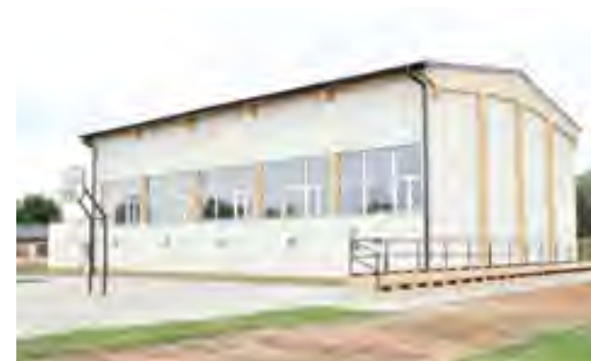
Nowa sala gimnastyczna w Miłobądzu.

zadania zakupiony został sprzęt sportowy, m.in.: piłki, materace, ławki gimnastyczne oraz inne akcesoria sportowe niezbędne do prowadzenia lekcji z wychowania fizycznego. Koszt zadania to prawie 1,8 mln zł. W latach kolejnych planuje się rozbudowę całej jednostki. Koszt rozbudowy Szkoły Podstawowej w Miłobądzu szacuje się na ok. 7 mln. zł.