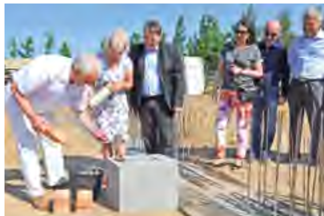
Uroczysty akt wmurowania kamienia węgielnego pod budowę świetlicy.

z układem ścian nośnych murowanych i żelbetowych oraz tarczownicami żelbetowymi. Elementem wyróżniającym będzie przeszkolona ściana sali głównej. W ramach zadania budynek zostanie wyposażony w niezbędny sprzęt umożliwiający funkcjonowanie świetlicy. Dodatkowo zagospodarowany zostanie teren wokół budynku wraz z postawieniem ogrodzenia. Koszt inwestycji to kwota ponad 2 mln zł. Termin zakończenia zadania to 30 kwietnia 2015 r.