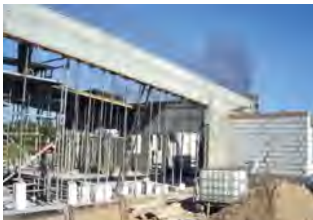
Budowa świetlicy w Szpęgawie.

Nowy obiekt będzie największą i najnowocześniejszą świetlicą ze wszystkich w gminie. Sama sala będzie miała prawie 160 m 2 , przy powierzchni całkowitej 364 m 2 . Architektura budynku wykonana będzie w technologii tradycyjnej