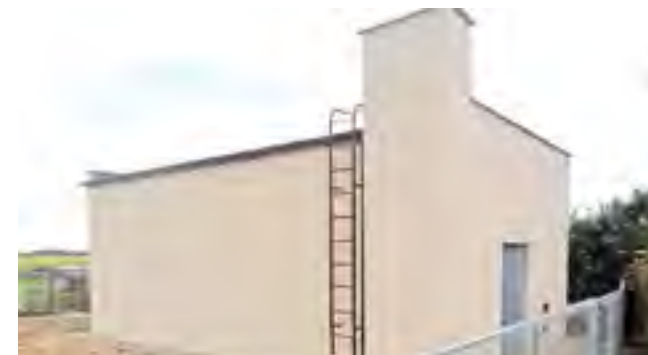
Hydrofornia w Zajączkowie.

Dnia 30.06.2014 dokonano protokolarnego odbioru prac związanych z wykonaniem zadania pn: „Przebudowa hydroforni w Zajączkowie”. Koszt robót budowlanych wyniósł prawie 70 tys. zł. W ramach zadania przeprowadzono kapitalny remont istniejącego obiektu w tym: wykonanie ocieplenia obiektu, izolacji fundamentów, ocieplenia pokrycia dachowego, prace wykończeniowe wewnątrz obiektu, polegające na ułożeniu posadzki, tynkowaniu i malowaniu. Ponadto w ramach zadania wykonano ogrodzenie obiektu.