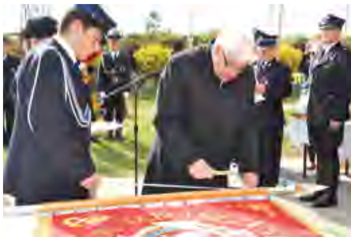
Zaproszeni goście dokonali wbicia pamiątkowych gwoździ w drzewiec sztandaru.