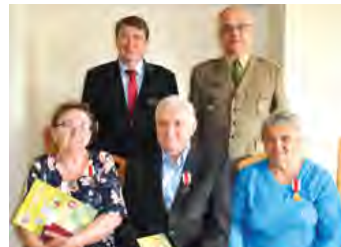
Mieszkańcy uhonorowani odznaczeniami państwowymi.