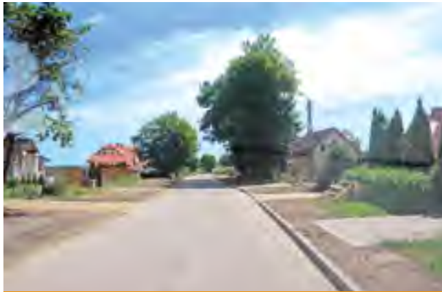
Dąbrówka, ul. Łąkowa.

Prawie 60 % wydatków inwestycyjnych pochłonię w bieżącym roku prace na drogach gminnych. W budżecie na rok 2014 zaplanowano przebudowy i remonty na blisko 9,5 km dróg za kwotę ponad 5 mln zł.