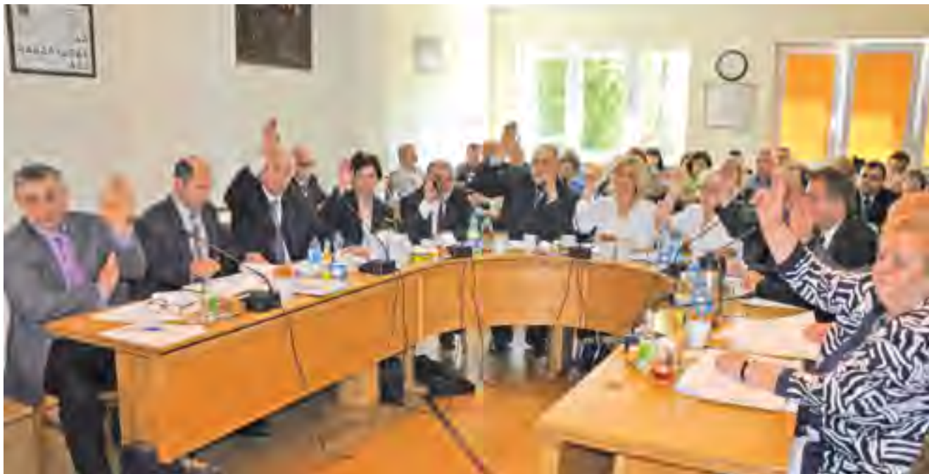
Głosowanie radnych za udzieleniem Wójtowi absolutorium.

uchwałę Nr XXV/162/2013 Rady Gminy Tczew z dnia 06 marca 2013r. w sprawie przystąpienia do sporządzenia zmiany do Studium Uwarunkowań i Kierunków Zagospodarowania Przestrzennego Gminy Tczew, która przeszła jednogłośnie. Ponadto Radni przyjęli sprawozdanie z działalności Gminnego Ośrodka Pomocy Społecznej w Tczewie za rok 2013 oraz ocenę zasobów pomocy społecznej na rok 2013 dla Gminy Tczew.