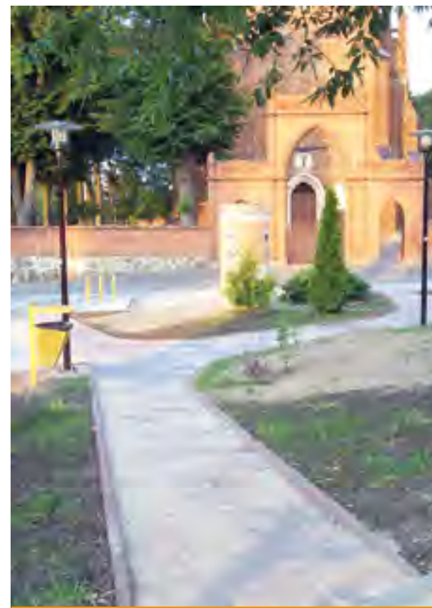
Zagospodarowany plac przed kościołem w Miłobądzu.

Na realizację tego zadania gmina otrzymała dofinansowanie z Programu Rozwoju Obszarów Wiejskich na lata 2007-2013 osi 4 Leader w ramach działania „Małe projekty”. Koszt zadania wynosi 93.511,38 zł, z czego prawie 45 tys. zł stanowi kwota dofinansowania.