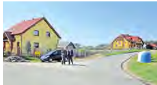
Lubiszewo, ul. Leśna i ul. Sambora.

Zakres prac obejmował profilowanie i zagęszczanie podłoża, ułożenie krawężnika na remontowanym odcinku drogi i na skrzyżowaniach oraz utwardzenie drogi na odcinku 765 mb o szerokości 5 m mieszkanką mineralno-asfaltową z betonu asfaltowego. Wykonane zostały wjazdy do posesji i po obu stronach pobocza o szerokości 0,5m. Całkowity koszt zadania to ponad 263 tys. zł.