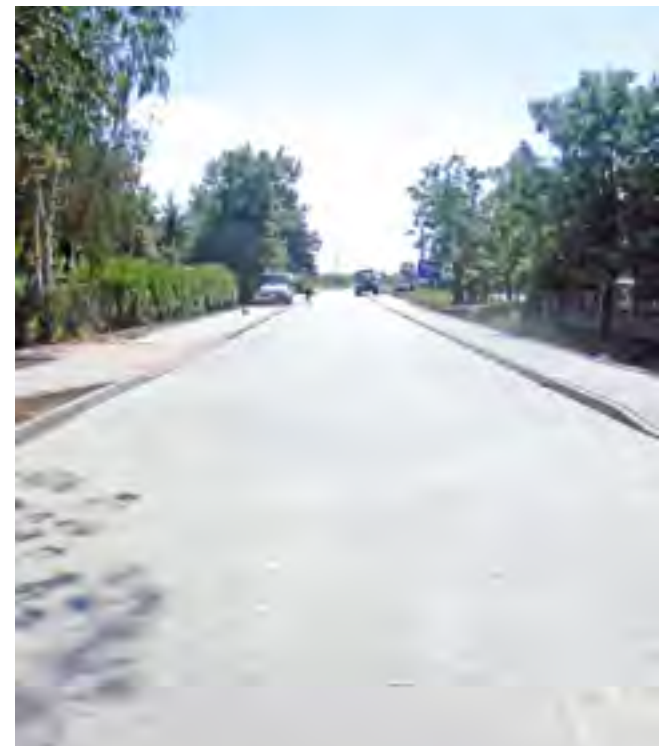
Tczewskie Łąki, ul. Zajęczkowska.

Przypomnijmy, że pod koniec 2011 roku realizowany był I etap przebudowy ulicy Zajęczkowskiej w Tczewskich Łąkach, który polegał na naprawie drogi, wyprofilowaniu i plantowaniu terenu odcinka drogi od mostku do torów PKP, gdzie ułożone zostały płyty drogowe typu youmb wraz z wykonaniem uzupełnienia z gruzu betonowego. Łączny koszt tego zadania wyniósł wówczas 380 tys. zł, a Gmina Tczew pozyskała na to zadanie dofinansowanie w wysokości 70 tys. zł z Funduszu Ochrony Gruntów Rolnych oraz 164 tys. zł wpłacił lider konsorcjum budowy trasy kolejowej E-65