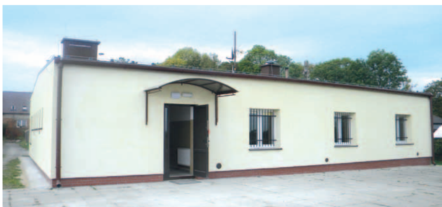
Wyremontowana świetlica wiejska w Mieścinie.

multimedialny ma być miejscem spotkań i działań na rzecz rozwoju kultury i edukacji w sołectwie.