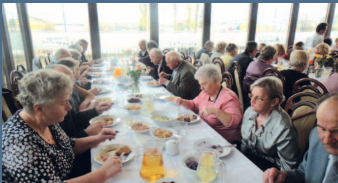
Seniorzy spotkali się w restauracji Akropolis.

Takie spotkania to wspaniała okazja do oderwania się od codzienności, porozmawiania z sąsiadami i powspominania. Z kolei taniec przy dobrej muzyce może wyleczyć nie jedno schorzenie. Dlatego też takie inicjatywy należy doceniać i wspierać, aby stały się rytuałem. Dzień Seniora w Polsce powstał z inicjatywy Polskiego Związku Emerytów, Rencistów i Inwalidów, a jego celem jest zwrócenie uwagi społeczeństwa na ludzi starszych i niepełnosprawnych oraz popularyzowanie idei pełnego udziału seniorów w rozwoju kulturalnym i ekonomicznym społeczeństwa. Ze swojej roli świetnie wywiązują się pełni życia i pogody ducha emeryci z Czarlina, którym energii i woli życia pozazdrościć mógłby niejeden młody.