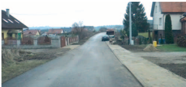
Lubiszewo ul. Słoneczna.

Zakończyło się zadanie pn. „Przebudowa ulicy Słonecznej w Lubiszewie”. Zakres prac obejmował m.in.: ułożenie nawierzchni bitumicznej na istniejącej nawierzchni z trylinki na odcinku 274 m. W ramach zadania wykonano koryto i podbudowy pod nawierzchnię bitumiczną oraz przełożono chodnik wraz z krawężnikami i obrzeżami. Koszt zadania to kwota 127 119,54 zł.