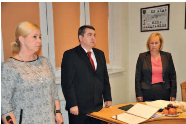
Wójt Gminy Tczew Roman Rezmerowski złożył uroczyste ślubowanie.