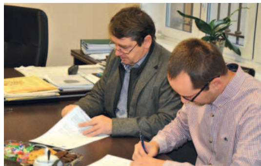
Podpisanie umowy z wykonawcą.