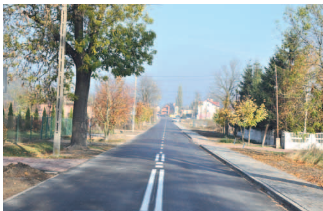
Czarlin ul. Klonowa.

Całkowity koszt inwestycji wyniósł 883 957,96 zł.