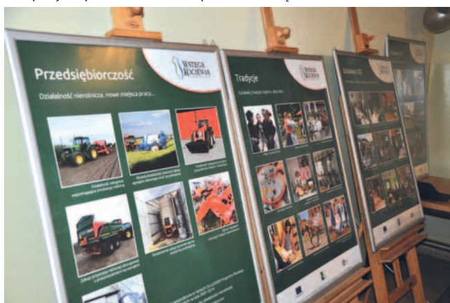
Podczas spotkania prezentowano projekty zrealizowane w gminie Tczew.