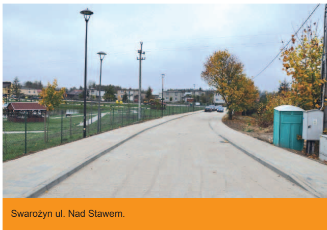
Swarzędź ul. Nad Stawem.

Zadanie obejmowało przebudowę ulicy o charakterze osiedlowym, o długości 268,80 m i szerokości 5 m wraz z odwodnieniem poprzez spadki do kanalizacji deszczowej. Nawierzchnia została utwardzona kostką betonową typu polbruk. Przebudowa drogi obejmowała również budowę chodnika po obu stronach drogi oraz przebudowę zjazdów o powierzchni 182 m 2 . W ramach zadania ułożono 330 mb kanalizacji deszczowej oraz zamontowanych zostało 7 studzienek rewizyjnych. Wykonana przebudowa przyczyniła się do lepszego dojazdu do posesji oraz zwiększenia bezpieczeństwa mieszkańców ulicy.