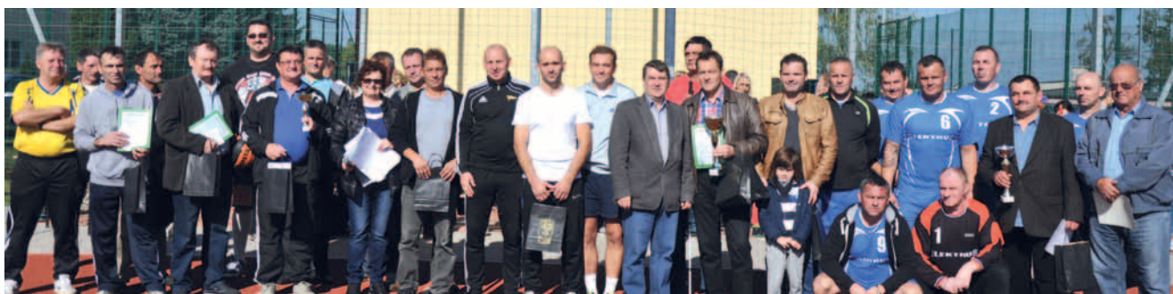
Uczestnicy turnieju wraz z organizatorami i zaproszonymi gośćmi.