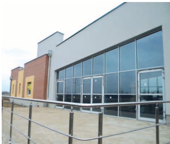
Budowa Gminnego Centrum Sportowo-Rekreacyjnego w Szpęgawie.

Nowy obiekt będzie największą i najnowocześniejszą świetlicą ze wszystkich w gminie. Sama sala będzie miała prawie 160 m 2 , przy powierzchni całkowitej 364 m 2 . Architektura budynku wykonana będzie w technologii tradycyjnej z układem ścian nośnych murowanych i żelbetowych oraz tarczownicami żelbetowymi. Elementem wyróżniającym będzie przeszklona ściana sali głównej. W ramach zadania budynek zostanie wyposażony w niezbędny sprzęt umożliwiający funkcjonowanie świetlicy. Dodatkowo zagospodarowany zostanie teren wokół budynku wraz z postawieniem ogrodzenia. Koszt inwestycji to kwota ponad 2 mln zł. Termin zakończenia zadania to 30 kwietnia 2015 r.