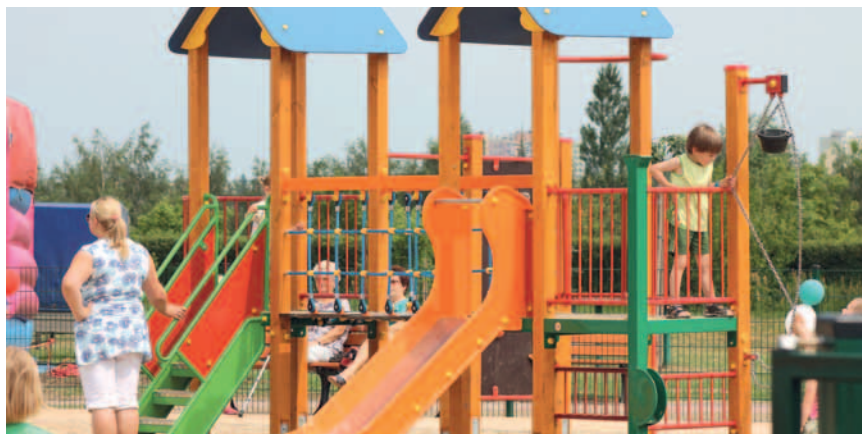
Duże szanse na pozyskanie dofinansowania na budowę placów zabaw w miejscowościach Zajączkowo i Dąbrówka Tczewska.

G mina Tczew przeszła pomyślnie ocenę wniosku złożonego na „Budowę placów zabaw w miejscowościach Zajączkowo i Dąbrówka Tczewska” i została umieszczona na liście operacji zakwalifikowanych do współfinansowania. Istnieje duża szansa na otrzymanie przez Gminę dofinansowania w kwocie 168.786,00 zł. Warto wspomnieć, że Beneficjenci w ramach konkursu złożyli 90 wniosków z czego 70 zostało ocenionych pozytywnie. Zadanie obejmuje wyposażenie placów zabaw w urządzenia zabawowe, ławeczki, stojaki na rowery, metalowe kosze na śmieci, tablicę regulaminową, a także urządzenia w ramach strefy fitness. Place zostaną ogrodzone.