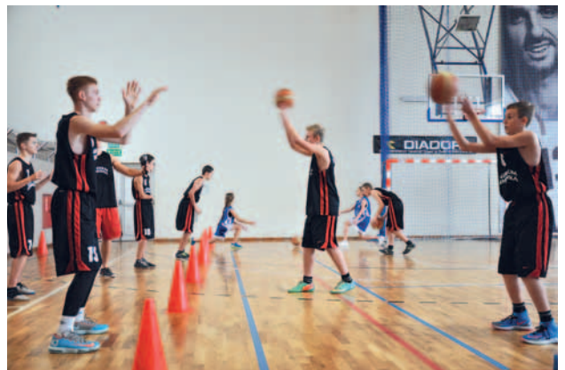
Zaprezentowano sekcję koszykówki, która prężnie rozwija się w Gimnazjum.

zycznego. Jubileusz szkoły jest okazją do wspomnień, które, choć minione, zawsze pozostają w pamięci. Przygotowany program uroczystości pozwolił wczuć się w realia i atmosferę