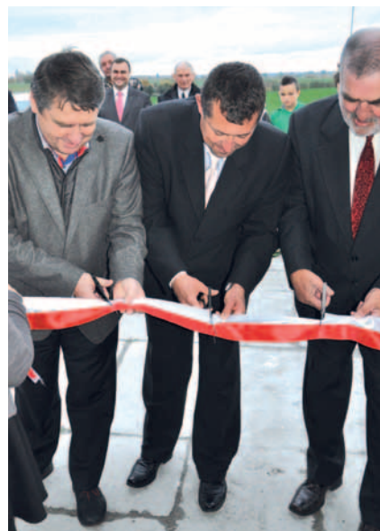
Uroczyste przecięcie wstęgi.

wejściem do świetlicy oraz wymieniono instalację odgromową. Wewnątrz budynku przeprowadzony został remont posadzek w pomieszczeniu głównym świetlicy, wymieniona została stolarka drzwiowa, a także wszystkie pomieszczenia zostały wymalowane. Odświeżono również pomieszczenia kuchenne oraz sanitarne, w których zamontowano nowe wyposażenie. Rozbudowana została także instalacja elektryczna oraz zamontowano nowy sprzęt multimedialny (projektor, ekran elektryczny, głośniki ścienne, szafka multimedialna na sprzęt, zintegrowany wzmacniacz stereo) wraz z instalacją anteny szerokopasmowej RTV do odbioru cyfrowej telewizji naziemnej. Zmodernizowana świetlica wyposażona w sprzęt