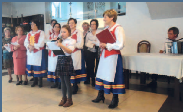
Członkinie Koła Gospodyń Wiejskich zadbały o część artystyczną.