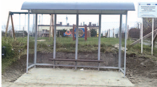
Wiaty przystankowa w Mieście.

W miejscowości Malenin na dz. nr 80/1 oraz w Mieście na dz. nr 78 postawione zostały nowe wiaty przystankowe. Koszt zadania to kwota 21 tys. zł. Wiaty o wymiarach długość - 360 cm, głębokość - 100 cm, wysokość - 240 cm, zostały wykonane z rur malowanych proszkowo, stanowiących konstrukcję szkieletową oraz płyt z poliwęglanu litego jako ściany. Zadaszenie wiaty wykonano w kształcie łuku, natomiast wewnątrz zamontowano ławkę drewnianą oraz tabliczkę na rozkład jazdy. Wykonawcą była firma Usługi Ogólnobudowlane MC-KWAK Zdzisław Kaczyński z Miłobądzia.