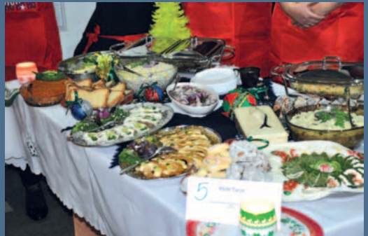
Koło Gospodyń Wiejskich z Turza otrzymało nagrodę publiczności za najładniejszy stół bożonarodzeniowy.

Ostatnim i najprzyjemniejszym dla podniebienia punktem uroczystości była degustacja świątecznych i wigilijnych potraw.