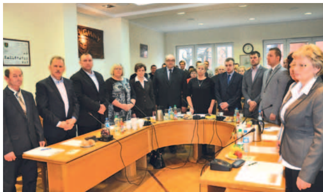
Ślubowanie nowo wybranych radnych.