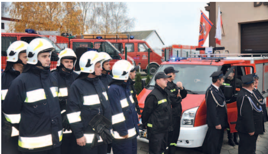
Jednostka OSP z Dąbrówki otrzymała samochód ratowniczo-gaśniczy.

samochodu uczestniczyła w usuwaniu miejscowych zagrożeń oraz pożarów. Poza tym jednostka udziela się w życiu kulturalnym gminy. Strażacy zabezpieczają imprezy organizowane przez władze gminy oraz niosą sztandar OSP. Obecnie nowy sprzęt umożliwi ochotnikom udział w akcjach ratowniczo-gaśniczych. Będą oni także wspierać jednostkę OSP Miłobądk, która należy do Krajowego Systemu Ratowniczo-Gaśniczego.