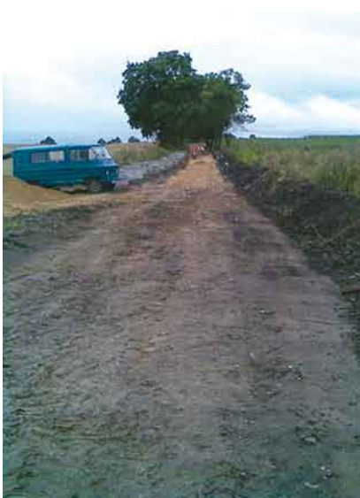
Droga Turze - Małzewko.

W trosce o bezpieczeństwo mieszkańców oraz podniesienia komfortu życia Wójt gminy w miarę posiadanych środków stara się poprawić stan istniejących dróg gminnych. W związku z tym, w miarę możliwości finansowych, co roku budowane są kolejne odcinki dróg gminnych. W ostatnich dwóch latach zakupiono 12 454 ton kruszywa, który został wbudowany w część dróg gminnych. Ponadto położono trylinę na ul. Polnej w Lubiszewie, wybudowano drogę do hydroforni w Turzu. Przebudowano wjazd na drogę powiatową w Bąldowie oraz zmodernizowano drogę Turze-Małzewko. Na powyższe zadania gmina wydała 1,3 mln zł. Gmina Tczew dofinansowała w wysokości 100 000 zł. modernizację drogi powiatowej Turze-Małzewko. Złożyła również projekt do RPO WP ( Regionalny Program Operacyjny dla Województwa Pomorskiego) na zadanie pn. Przebudowa drogi w Rokitkach – alternatywna droga do węzła A-1 w Stanisławiu. Zawarła również z powiatem tczewskim porozumienie w celu przebudowy dróg powiatowych znajdujących się w granicach admini-