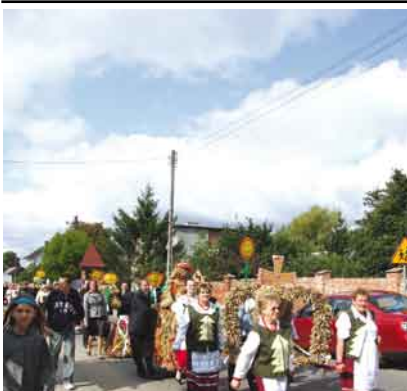
Oczyszczalnia w Turzu.