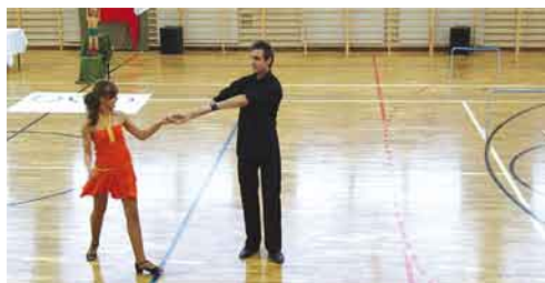
Taneczne występy z udziałem uczniów Gimnazjum w Dąbrówce.