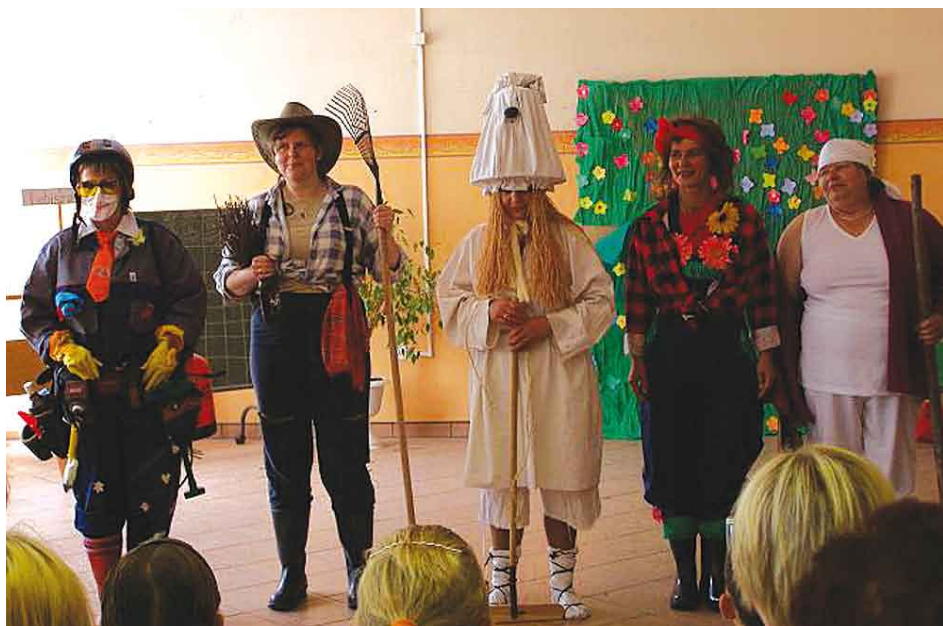
Występy Turniej KGW.

Wszystkim uczestniczącym kołom serdecznie gratulujemy oraz dziękujemy za zaangażowania oraz ogromny wkład pracy w przygotowanie się do turnieju gminnego.