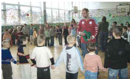
Zabawa andrzejkowa. Tańce urozmaicone były licznymi konkursami oraz wróżbami.

27. 11. 2008 r. na terenie szkoły odbyły się zabawy andrzejkowe dla uczniów klas 0 – III i IV – VI. Tańce urozmaicone były licznymi konkursami oraz wróżbami.