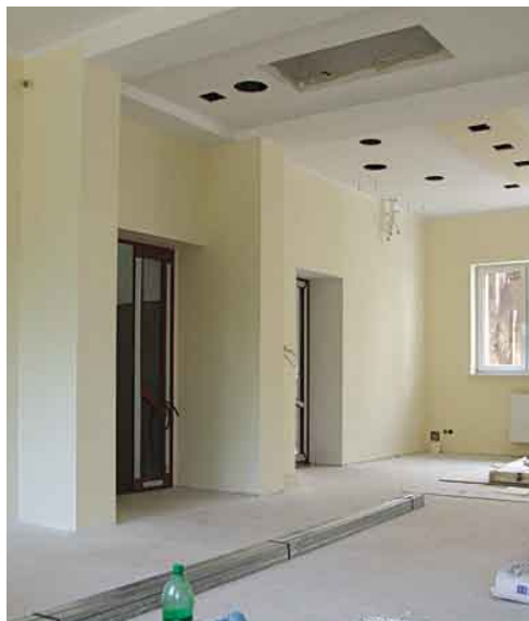
Remont Sali obrad w Urzędzie Gminy Tczew.

Cały czas konsekwentnie jest realizowana polityka udoskonalania obiektów użyteczności publicznej w Gminie Tczew.