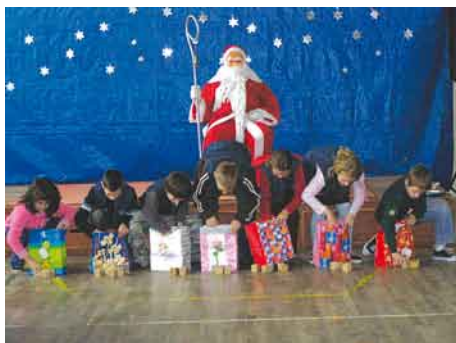
5 grudnia szkołę odwiedził Święty Mikołaj i przyniósł podarki.

5 grudnia szkołę odwiedził Święty Mikołaj i przyniósł podarki. Ale zanim obdarował dzieci prezentami, odbyło się przedstawienie w wykonaniu uczniów klasy II „W oczekiwaniu na Świętego Mikołaja”. Potem były konkursy zręcznościowe dla klas 0 – III. W każdej konkurencji brało udział po siedem losowo wybranych uczestników, bo tyle głosek ma słowo Mikołaj. Zwycięzcy otrzymali nagrody a pozostali słodkie upominki.