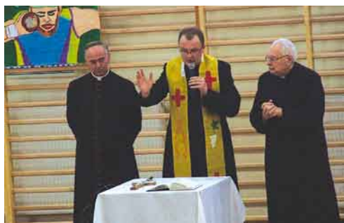
Poświęcenie obiektu przez księży.