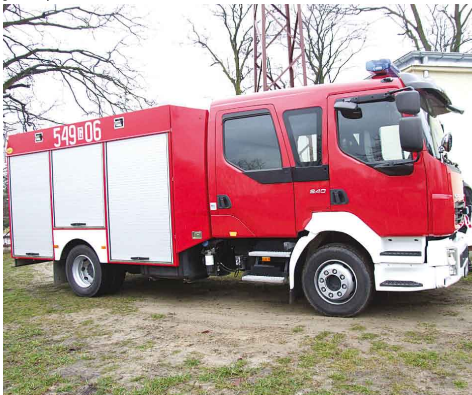
Nowy samochód ratowniczo-gaśniczy dla OSP w Miłobądzu.

W 2009 roku we współpracy z Państwową Strażą Pożarną planuje się stworzenie przy remizie w Swarzędzie Posterunku Straży Autostradowej, którego głównym celem ma być udzielanie pomocy podczas zdarzeń na autostradzie A-1. Punkt będzie wyposażony w dwa samochody: średni drogownictwa drogowego oraz samochód gaśniczo-ratowniczy. Dyżur pełniony będzie całonocowo.