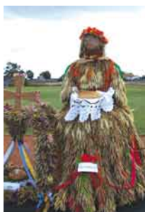
Najładniejszy wieńiec – Sołectwo Szerbice