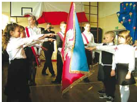
Uroczyste ślubowanie i pasowanie na uczniów.

Dnia 21 października i 9 grudnia uczniowie szkoły pojechali do Skowarcza do Muzeum Miodu. Znajdowały się tam bar miodowy i trzy sale. W pierwszej pani przewodnik opowie-