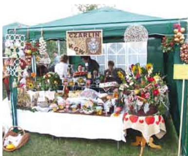
Najładniejsze stoisko – Koło Gospodyń Wiejskich Czarlin