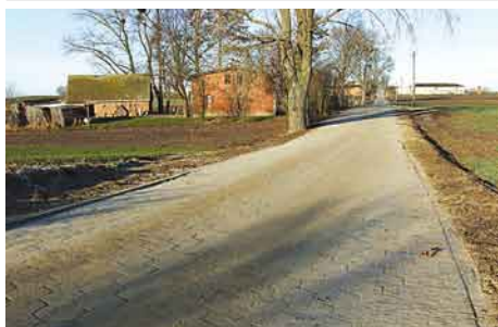
Przebudowana droga Goszyn-Małzewo.

stracyjnych gminy (Turze – Małzewo – Swaróżyn i Swaróżyn - Godziszewo). Na zadanie pn. Przebudowa dróg powiatowych nr 2714G i 2713G (Swaróżyn - Godziszewo) – etap I, zaplanowano ponad 2 mln. złotych dofinansowania z budżetu gminy. 23 października została wydana decyzja o środowiskowych uwarunkowaniach zgody na realizację przedsięwzięcia pn. Budowa sieci kanalizacji sanitarnej w Tczewskich Łąkach, realizowanej przez gminę Tczew w ramach „Kompleksowego programu gospodarki ściekowej Gminy Tczew. Zakres budowy sieci pozwoli na odebranie ścieków od mieszkańców wsi Tczewskie Łąki. Sieć zostanie zlokalizowana w drogach gminnych i wzdłuż dróg gminnych. Przewiduje się również budowę następujących sieci: