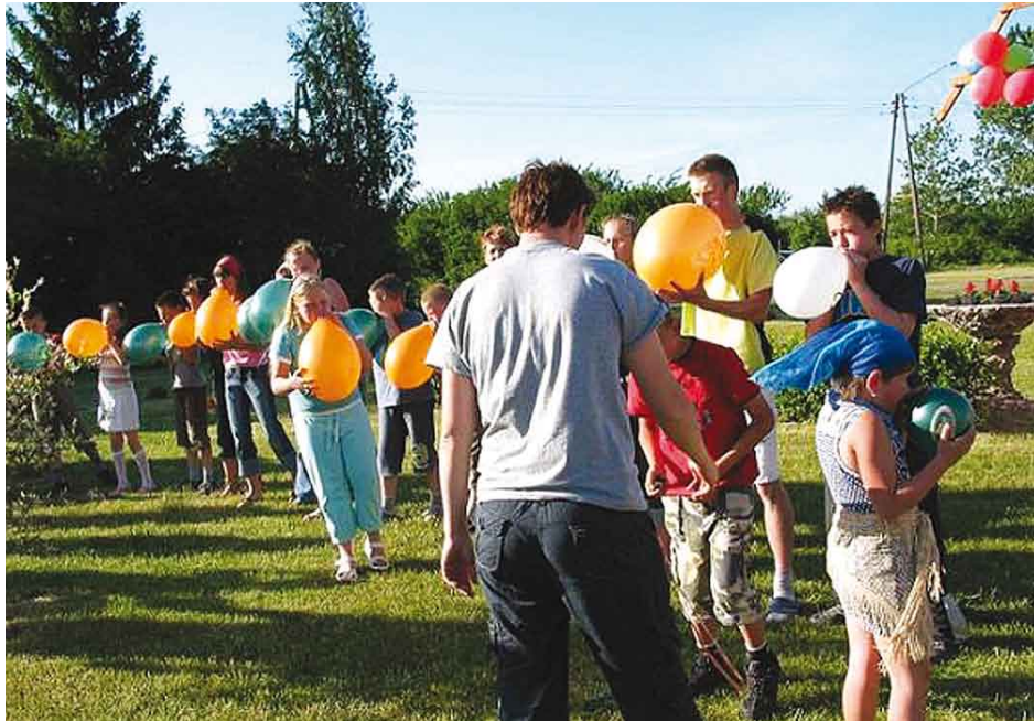
Dzień dziecka - konkurencje, konkursy dla dzieci.