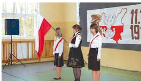
Uroczysta zmiana warty przy flagdzie.

Z okazji Dnia Edukacji Narodowej w Zespole Kształcenia i Wychowania w Swarzędzie miała miejsce uroczysta akademia. Dzieci z klasy III a przygotowały część artystyczną, w której recytowały wiersze, śpiewały piosenki i składały serdeczne życzenia wszystkim pracownikom naszej szkoły. Chór uświetnił występy młodszych kolegów piosenkami.