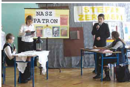
Dzień patrona szkoły-uroczysta akademia.

Dzieci gorącymi brawami nagrodziły uczniów klas IV, V i VI biorących udział w uroczystej akademii o Patronie Szkoły – Stefanie Żeromskim. Poważny nastrój ożywiły piosenki zaśpiewane z dużym zaangażowaniem przez chór szkolny. Imprezę urozmaiciły liczne konkursy przygotowane przez organizatorów, m. in. Konkurs ortograficzny, rywalizacja klasowa: „Śladami Żeromskiego” – ciekawostki z życia pisarza oraz konkurs plastyczny dla klas młodszych o kielecczyźnie pt.: „Tak ją widzę – Tak ją maluję”. Nagrodzeni uczniowie otrzymali pamiątkowe dyplomy i upominki.