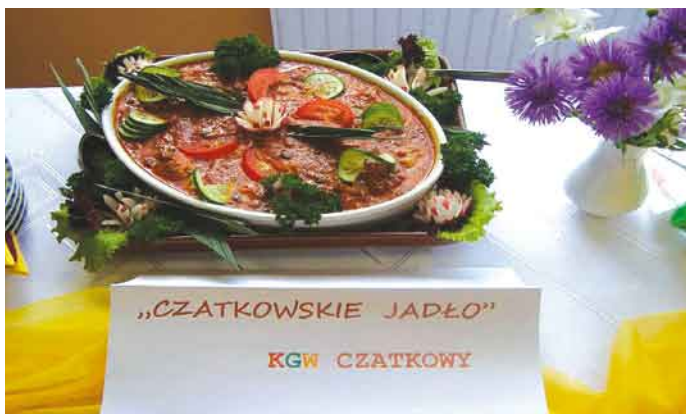
Czatkowskie jadlo konkurs KGW.

staropolsku, czatkowskie jadlo, pasztet w cieście drożdżowym oraz kaczkę z nadzie-