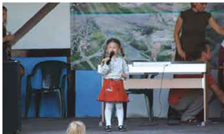
Najmłodsi uczestnicy podczas wokalnych występów.

W lipcu w Szpęgawie odbył się festyn rekreacyjno-rozrywkowy. Mieszkańcy Szpęgawy oraz okolicznych miejscowości bawili się w szpęgawskim parku w amfiteatrze. Organizatorzy zadbali o zabawę dla wszystkich. Dzieci miały możliwość pojeździć na kucyku, pobawić się na nadmuchanych placach zabaw, poskakać na trampolinie oraz pojeździć na quadach. Rodzice mogli spędzić sobotnie popołudnie bawiąc się przy wspaniałej muzyce, oglądając występy swoich pociech. Sporo emocji dostarczyła uczestnikom festynu loteria fantowa. Sprzedano 360 losów. Wiele osób wróciło do domów z cennymi nagrodami. Dzięki sponsorom, którzy ufundowali nagrody, pani sołtys nagradzała dzieci występujące na scenie, a osobom najlepiej bawiącym się wręczała karnety wstępu do klubu EBRO. Najwięcej publiczności przyciągnął występ zawodowego aktora, który za pomocą kukieł zaprezentował parodie krótkiego koncertu Tiny Turner oraz tańca zwycięskiej pary tanecznej z programu taniec z gwiazdami. Ponadto było kilka stoisk z zabawkami, wata