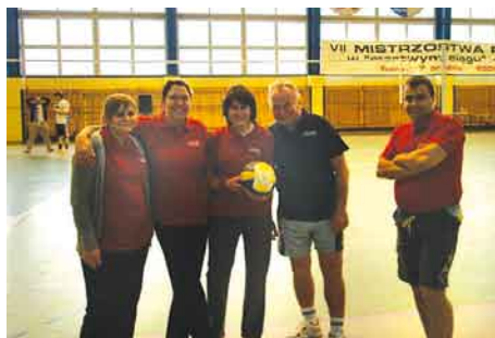
Drużyna siatkarska reprezentująca Gminę Tczew w Turnieju Samorządowców Powiatu Tczewskiego w Piłce Siatkowej.