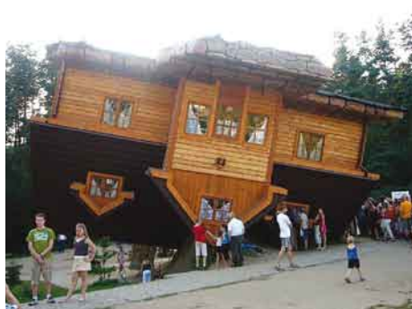
Dom na dachu - Szymbark.

q Dzień sportu – wyjazd dzieci do Parku Wodnego w Sopocie. W wycieczce uczestniczyło 77 dzieci wraz z 8 opiekunami. Park Wodny stanowi atrakcję Trójmiasta, ściągając coraz liczniejsze rzesze miłośników relaksu i dobrej zabawy. Przez cały rok można tu zażywać kąpieli i masażu bez względu na pogodę, co nad naszym kapryśnym Bałtykiem jest na pewno dużym atutem.