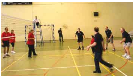
Rozgrywki drużyn w piłce siatkowej.