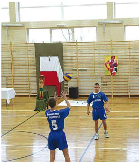
Podczas otwarcia Sali uczniowie Gimnazjum nie odmówili sobie „przetarcia parkietu” grając w siatkówkę.