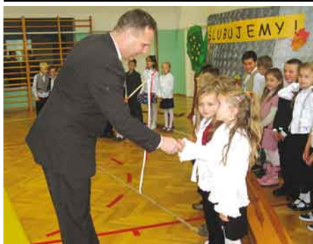
Uroczyste ślubowanie klas pierwszych.

Dnia 29. 10. 2008 r. odbyło się uroczyste ślubowanie klas pierwszych. Uczniowie przygotowali przedstawienie słowno – muzyczne z udziałem Ekoludka. Każdy pierwszoklasista otrzymał paczkę ze słodyczami i przyborami szkolnymi.