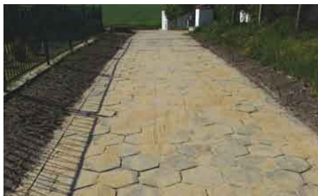
Droga dojazdowa do hydroforni w Turzu.