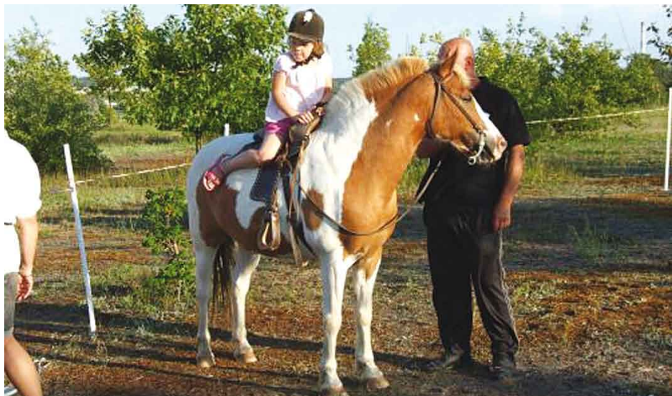
Wiele radości sprawiała najmłodszym możliwość przejażdżki na kucyku.

cukrowa, popcorn oraz bar gastronomiczny, a wieczorem przygotowano ognisko.