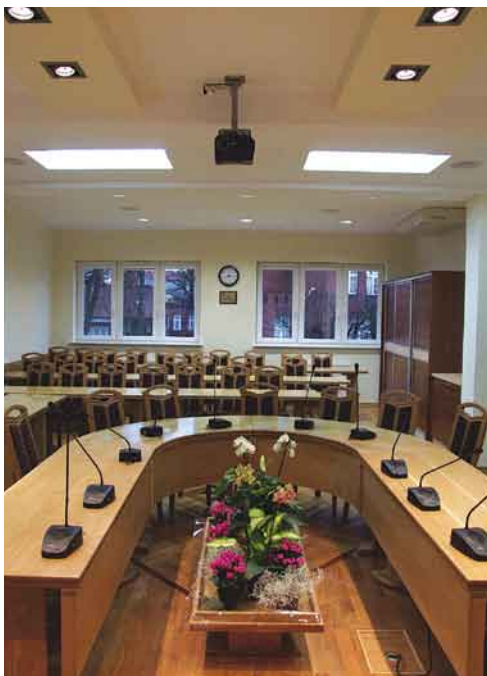
Sala obrad po remoncie.