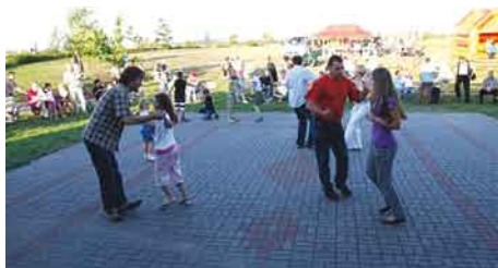
Rodzinne zmagania taneczne.

cukrowa, popcorn oraz bar gastronomiczny, a wieczorem przygotowano ognisko.