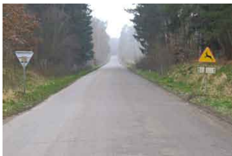
Droga powiatowa Boroszewo.