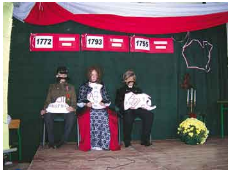
Inscenizacja dotycząca historycznych wydarzeń.