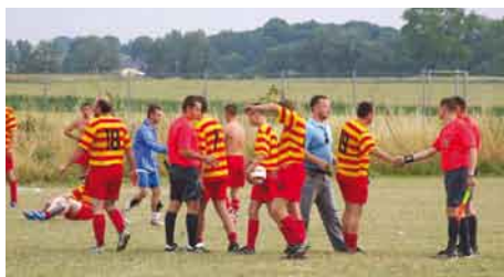
Podczas meczu obowiązywały przepisy gry w piłkę nożną P.Z.P.N.