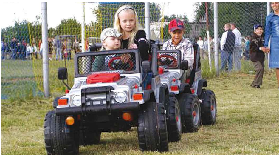
Przejażdżka na quadach.