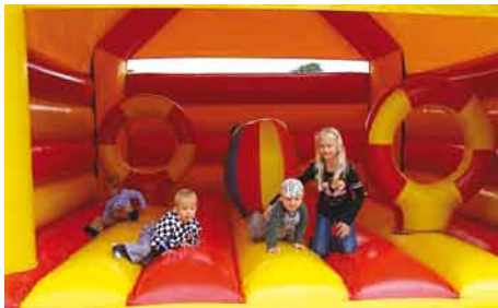
Dmuchańce place zabaw.

W lipcu w Dąbrówce odbył się festyn rodzinny. Zabawa była wspaniała. Wiele atrakcji dla dzieci przyciągnęło rzesze mieszkańców. Dmuchańce, place zabaw, trampolina, samochodziki to tylko część atrakcji festynu. Organizatorzy przygotowali również paczki dla dzieci z okazji spóźnionego dnia dziecka. Zarówno dorośli jak i dzieci bawili się świetnie, jedynym problemem była pogoda. Wichura, deszcz i burza przestraszyła uczestników i część powróciło do domów.