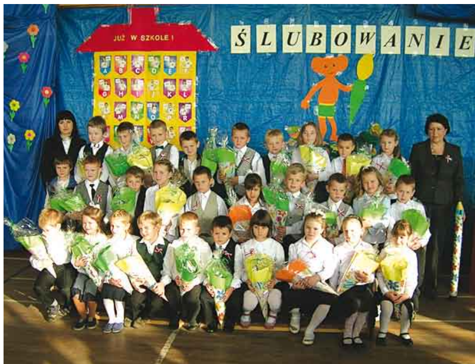
Dzieci dały dowód na to, że zasługują na przyjęcie do braci uczniowskiej.