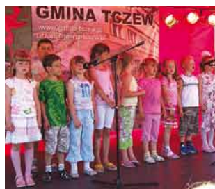
Podczas dożynkowych występów nie mogło zabraknąć popisów najmłodszych mieszkańców Gminy Tczew

Ponadto wręczono nagrody dla laureatów piętnastej edycji konkursu Piękna Wieś 2008. Kilkuletnie doświadczenie wykazało, że dzięki konkursowi poprawia się estetyka zagród wiejskich i wsi oraz stan środowiska naturalnego. Coraz liczniejsza z roku na rok grupa uczestników świadczy o docenianiu idei i trosce o wygląd wsi. Regulamin konkursu się nie zmienił. Jest organizowany w trzech kategoriach: zagroda rolnicza, nierolnicza, wieś. Komisja podczas