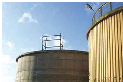
Oczyszczalnia ścieków w Turzu- nowy osadnik wtórny.

Oprócz zadań inwestycyjnych oświatowych kontynuujemy zadania z zakresu gospodarki wodno-ściekowej. Woda jako podstawowy nośnik niezbędny do prawidłowego i zdrowego funkcjonowania każdego z nas, jest objęta szczególną troską władz gminy. Systematyczny rozwój gminy powoduje konieczność rozbudowy sieci i modernizację już istniejących obiektów. W poprzednich wydaniach „Wieści Naszej Gminy” przekazywaliśmy dokładne „raporty” z obecnego stanu technicznego oczyszczalni ścieków w Turzu. Dla przypomnienia oczyszczalnia działa od 1996 roku i przyjmuje 280 m 3 /d ścieków. Oczyszczalnia będzie zmodernizowana i przebudowana tak, aby mogła przyjąć 600 m 3 /d ścieków, a parametry oczyszczanych ścieków będą lepsze niż przewidują normy. Na dzień dzisiejszy oczyszczalnia jest w trakcie rozbudowy i modernizacji. Wykonawcę wyłoniono w wyniku przetargu w oparciu o zapisy ustawy Prawo Zamówień Publicznych. Jest nim Przedsiębiorstwo Realizacji Inwestycji „Dak-Bud” ze Starogardu Gd. Koszt całego zadania w zakresie robót budowlanych nie powinien przekroczyć 5 mln. zł. Termin zakończenia zadania planuje się w lipcu 2009 r.