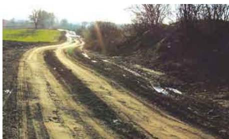
Droga Goszyn-Małzewo przed przebudową.