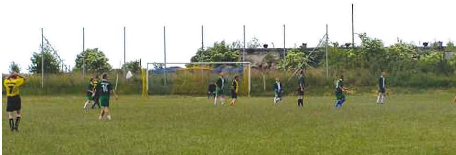
Mecz piłki nożnej to tylko część atrakcji festynu.