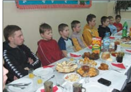
Młodzież OSP w Swarożynie.

Gmina Tczew jest też wiodącym partnerem projektu „Bezpieczny powiat”, którego celem jest poprawa bezpieczeństwa w powiecie tczewskim poprzez wyposażenie w specjalistyczne środki transportu jednostek OSP. To projekt partnerski 5 gmin powiatu: Morzeszczyn, Gniew, Subkowy, Tczew, Pelplin. W ramach projektu zakupione mają zostać samochody strażackie oraz przeprowadzone szkolenia pierwszej pomocy dla członków OSP. Udział własny gminy w tym projekcie to 29,58 %. Łączne nakłady gminy Tczew szacowane są na 1 955 286 zł z tego środki własne to 578 373,59 zł. Z programu wyasygnowanych ma być 1 376 915,50 zł, a realizacja zadań przewidziana jest na lata 2011 – 2013.