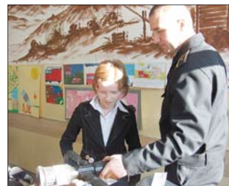
Strażacy sprawdzali wiedzę uczniów ze znajomości sprzętu strażackiego.