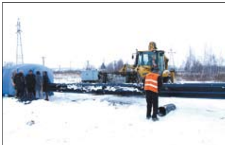
Realizacja zadania pn. Kompleksowy Program Gospodarki Ściekowej Gminy Tczew.

Jak komentuje Krzysztof Hetman wiceminister rozwoju regionalnego – są dwie przyczyny tego zjawiska. Jedną to brak aktywności władz samorządów, a drugą to brak środków własnych, czyli bardzo małe budżety mniejszych gmin, co uniemożliwia występowanie o duże dotacje.