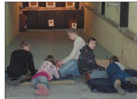
Ferie w Czarlinie.