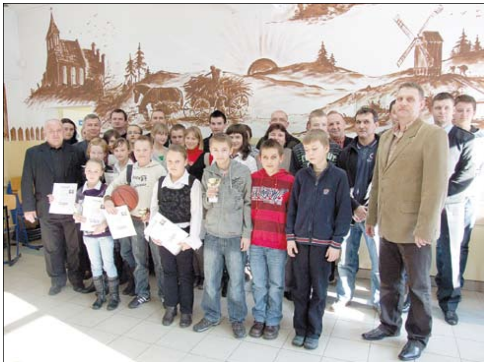
Uczestnicy turnieju i zaproszeni goście.