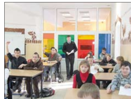
Uczestnicy turnieju podczas testu sprawdzającego.