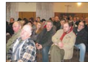
Mieszkańcy Rokitek na zebraniu wiejskim.

Przedmiotem projektu jest przebudowa układu drogowego w Rokitkach ulicy Tczewskiej od granic administracyjnych z miastem Tczew poprzez „rondo” w centrum, dalej ulica Kasztanowa do mostu na Kanale Ulgowym o łącznej długości 2,193 km. W ciągu drogi musi być wybudowana nowa sieć kanalizacji deszczowej, która zapewni odbiór wód opadowych z ulicy, jak również z sąsiednich tj. ul. Leśnej, Kwiatowej, Cyprysowej, Krótkiej i Pięknej. Zmodernizowane zostanie oświetlenie przebudowanych ulic przez wymianę starych opraw rżeniowych na 36 sztuk nowej generacji opraw sodowych oraz 8 nowych punktów świetlnych. Nowe oświetlenie spełniać będzie wymagania, co do norm natężenia oświetlenia oraz jej równomierności, a ponadto wyeliminuje straty pobieranej energii elektrycznej. W ciągu