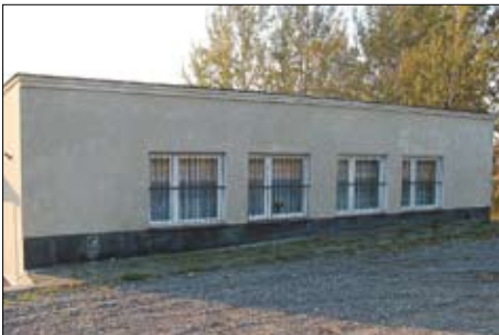
Świetlica wiejska w Czatkowach.

Celem zadania jest aktywizacja życia kulturowego i społecznego na bazie świetlicy wiejskiej we wsi Czatkowy. Doposażenie świetlicy umożliwi mieszkańcom wsi organizowanie kursów kulinarnych, akademii gotowania dla dzieci - przygotowanie potraw kociewskich i kuchni