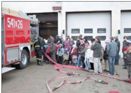
Uczestnicy zimowiska z Rokitek odwiedzili Straż Pożarną w Tczewie.

W Śliwinach o najmłodszych zatroszczyły się panie z miejscowego Koła Gospodyń Wiejskich. W przygotowaniu feryjnych atrakcji pomagali też rodzice dzieci. Zadbano nie tylko o przyjemności, ale i o coś dla zdrowia. Od 22 do 25 lutego w świetlicy wiejskiej przeprowadzono zajęcia sportowe, m.in. rozegrano turniej tenisa stołowego. Nie brakowało też zadań rozwijających manualne i zręcznościowe uzdolnienia najmłodszych mieszkańców tego sołectwa. Były także tańce z balonem oraz konkurencje dydaktyczne m.in. "Prawda czy fałsz" oraz wiele innych zajęć wypełniających wolny czas od szkoły. Ale było też coś, co szczególnie lubią robić dzieci – zajęcia kulinarne. Z ogromnym przejęciem dzieci piekły ciasteczka. Najpierw własnoręcznie wyrabiały ciasto, po czym wykrawały z niego cudowne kształty i... do pieca. Innym razem przygotowały sałatkę owocową. I tym razem niesamowitą frajdę sprawiło im nie tylko przygotowanie sałatki, ale i jej zjedzenie – mniam! Grom, zabawom i konkursom z nagrodami prawie nie było końca. Gospodynie zadbały również o wyżywienie swoich feryjnych podopiecznych. Codziennie dzieci otrzymywały ciepły posiłek oraz mnóstwo przekąsek i słodczy. To jednak nie wszystko – najmłodszych podczas zajęć odwiedziła Joanna Szlicht, sekretarz gminy wręczając im drobne upominki ufundowane przez Wójta Gminy Tczew.