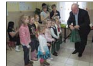
Henryk Łucki zastępca wójta gminy Tczew wręcza prezenty małym artystom.