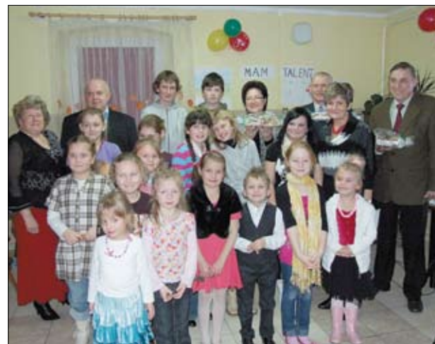
Uczestnicy i zaproszeni goście przeglądu talentów.

Gratulujemy Paniom pomysłu i dziękujemy za trud pracy włożony w przygotowanie zabawy.