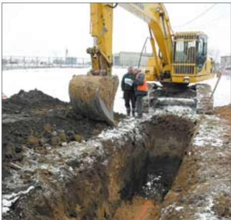
Budowa sieci kanalizacyjnej.

W wyniku realizacji umowy zostanie wybudowane 30,3 km sieci grawitacyjno- tłocznej