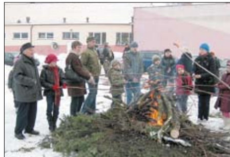
Ognisko w Lubiszewie.

o tym jak wygląda służba strażacka i jaki powinien być prawdziwy strażak. Także wizyta w policji dała młodym mieszkańcom sołectwa sporo okazji do poznania kulis pracy policjantów. Niektórzy zdecydowali się przymierzyć mundury, aby sprawdzić, czy w nich im do twarzy. Jednak największą atrakcją była wizyta u technika kryminalistyki, który od każdego uczestnika pobrał odciski palców. Wizyta w Centrum to już same doznania estetyczne, kulturalne i ciekawie pokazana historia. To tam dzieci i młodzież podziwiała wystawę „Pradzieje Tczewa”, która obrazuje dzieje Tczewa i okolicznych terenów od czasów najdawniejszych, aż po wczesne średniowiecze. Poznali, jak żyli nasi przodkowie. Zobaczyli jak polowali, jak uprawili ziemię, wyrabiali narzędzia i w co się ubierali. Mogli też samodzielnie wybić sobie pamiątkowego denara Sambora II oraz zrobić super fotkę na tle dioramy w stroju człowieka z epoki kamienia.