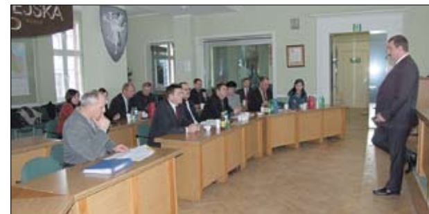
Spotkanie w Urzędzie Miasta Tczew.

Dnia 15 stycznia br. Prezydent Tczewa zaprosił wóldarzy gmin sąsiadujących z miastem na spotkanie do Urzędu Miejskiego