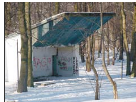
Obecny amfiteatr w Turzu.