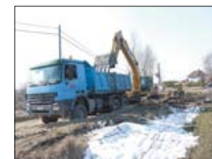
Prace budowlane drogi w Rokitkach.