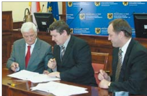
Uroczyste podpisanie umowy o dofinansowanie.