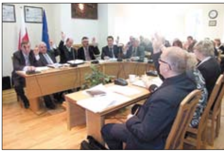
Radni Gminy Tczew uchwalają budżet na rok 2010.

W projekcie budżetu ujęto również 877 tys. zł. z przeznaczeniem na kulturę i ochronę dzie-