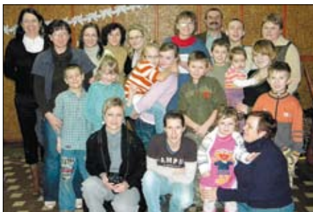
Uczestnicy zimowiska w Śliwinach.

A jak bawiono się w Rokitkach? I tu nie brakowało atrakcji dla najmłodszych. Oprócz tych typowych dla zimowiska zajęć świetlicowych, było też kilka pozycji bardzo pobudzających intelektualnie. Na przykład 23 lutego feriovicze zwiedzili Komendę Powiatową Państwowej Straży Pożarnej w Tczewie i Komendę Powiatową Policji w Tczewie oraz obejrzeli wystawę „Pradzieje Tczewa” w Centrum Wystawienniczo-Regionalnym Dolnej Wisły w Tczewie. W Straży najbardziej młodych interesowało wyposażenie, co więcej mogli przejechać się wozem bojowym, a także podziwiać Tczew z lotu ptaka, a właściwie z wysokości kilkudziesięciu metrów – z kosza umieszczonego na końcu wysięgnika drabiny. Spróbowali też swoich sił przy zwijaniu wężu gaśniczych. Śmiechu było przy tym, co niemiara. Dzieci były zachwycone, że mogły zobaczyć jak przygotowuje się do transportu na desce ratowniczej chorego z urazem kręgosłupa. Z zapartym tchem słuchały opowieści zawodowego strażaka,