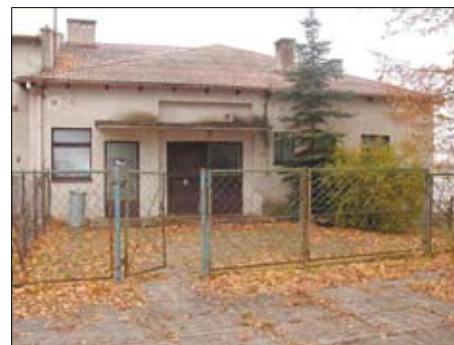
Świetlica wiejska w Dalwinie

Władze gminy w br. planują również składać wniosek w ramach PROW na zadanie pn. „Zagospodarowanie terenu przy remizie w Swarzędzie”. Projekt inwestycji zakłada budowę parku rekreacyjnego ze sceną oraz pomostem. Ma to być ogrodzony plac, na którym zlokalizowane będą ciągi spacerowe, ścieżki rowerowe, obiekty sportowe, plac zabaw dla dzieci oraz mini plaża nad oczkiem wodnym. Planowany koszt tego zadania to ponad 1,4 mln zł.