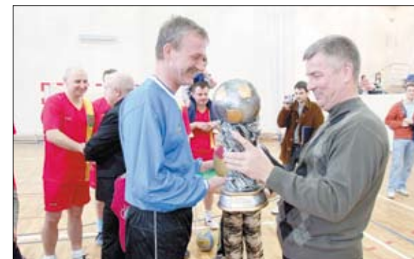
Wręczenie pucharu zwycięskiej drużynie.

Zawody dostarczyły wiele emocji zarówno zawodnikom jak i kibicom na trybunach. Turniej został wpisany do kalendarza imprez cyklicznych, także przyszły rok może posłużyć jako rewanż dla niezadowolonych wyników drużyn.