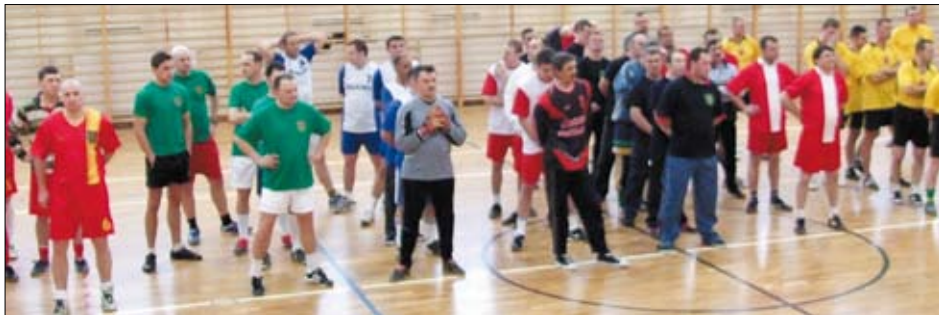
Uczestniczące zespoły sportowe.