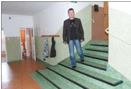
Dyrektor Zespołu Kształcenia i Wychowania w Turzu prezentuje wykonane remonty.

W trosce o bezpieczeństwo najmłodszych w Szkole Podstawowej w Turzu wyremontowano część szkoły, którą użytkują najmłodszy uczniowie. Remontem zostały objęte toalety, dwie klasy oraz ciąg komunikacyjny. Zadanie kosztowało ponad 60 tys. zł