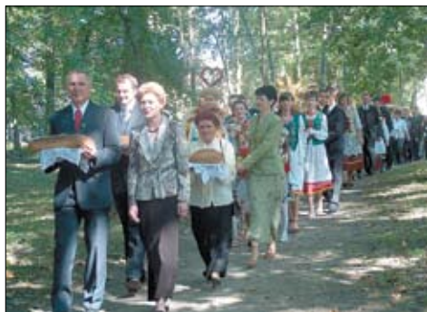
Dożynki Gminne 2006.