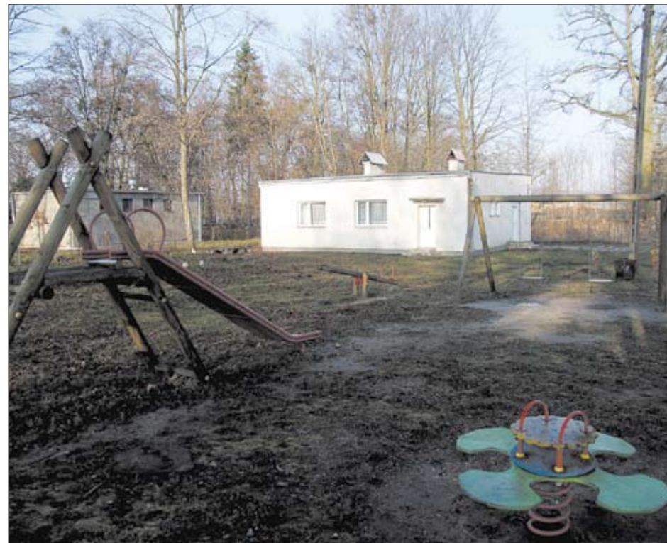
Plac zabaw przy świetlicy wiejskiej w Szczerbicy.

składzie) o pow. 264m 2 , nawierzchni poliuretanowej z odwodnieniem wraz z doposażeniem placu zabaw o 7 elementów. Celem przedsięwzięcia będzie aktywizacja i integracja społeczności wiejskiej w Szczerbicy. Realizacja zadania służyć będzie podniesieniu jakości życia na wsi oraz zaspokojeniu potrzeb społecznych i kulturalnych poprzez stworzenie infrastrukturalnych warunków do rozwoju inicjatyw społecznych i aktywności mieszkańców wsi w dziedzinie kultury i sportu. Całkowita wartość projektu wynosi 399 516,92 zł. z tego 85% kwoty dofinansowania tj. 339 589,38 zł.