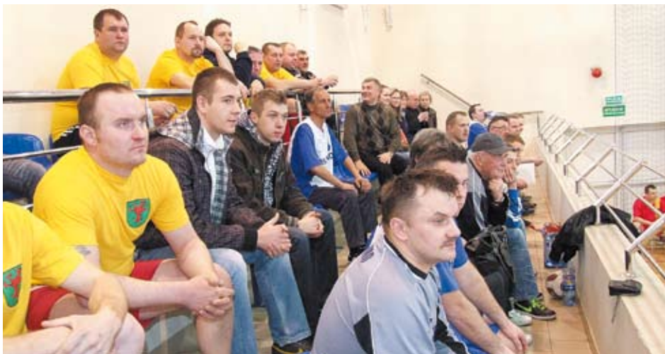
Uczestnicy turnieju oraz ich kibice na trybunach.