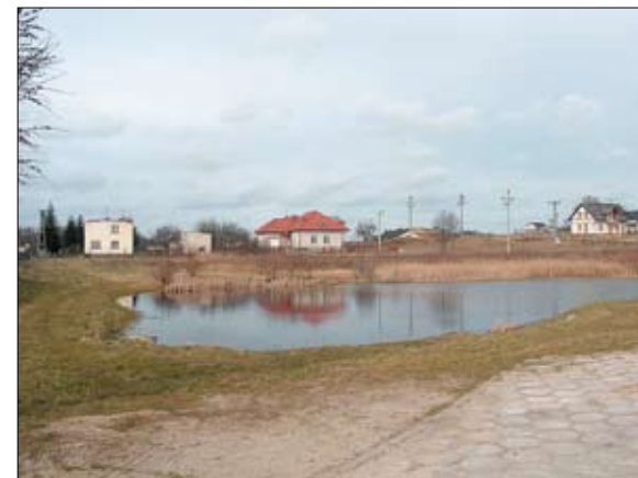
Tak obecnie wygląda teren przy remizie w Swarzędzie.

W planie odnowy miejscowości Dalwin znajduje się min. zadanie - remont świetlicy wiejskiej oraz boks garażowy w Dalwinie. O środki na tę inwestycję Gmina również ubie-