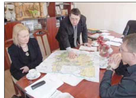
Prace nad studium uwarunkowań i kierunków zagospodarowania przestrzennego.

Zakłada się, że w czerwca 2010 r. dokument planistyczny będzie już obowiązywał.