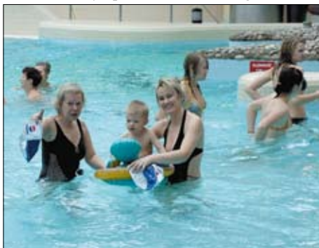
Szpegawa w aquaparku.

A jak bawiono się w Rokitkach? I tu nie brakowało atrakcji dla najmłodszych. Oprócz tych typowych dla zimowiska zajęć świetlicowych, było też kilka pozycji bardzo pobudzających intelektualnie. Na przykład 23 lutego feriovicze zwiedzili Komendę Powiatową Państwowej Straży Pożarnej w Tczewie i Komendę Powiatową Policji w Tczewie oraz obejrzeli wystawę „Pradzieje Tczewa” w Centrum Wystawienniczo-Regionalnym Dolnej Wisły w Tczewie. W Straży najbardziej młodych interesowało wyposażenie, co więcej mogli przejechać się wozem bojowym, a także podziwiać Tczew z lotu ptaka, a właściwie z wysokości kilkudziesięciu metrów – z kosza umieszczonego na końcu wysięgnika drabiny. Spróbowali też swoich sił przy zwijaniu wężu gaśniczych. Śmiechu było przy tym, co niemiara. Dzieci były zachwycone, że mogły zobaczyć jak przygotowuje się do transportu na desce ratowniczej chorego z urazem kręgosłupa. Z zapartym tchem słuchały opowieści zawodowego strażaka,