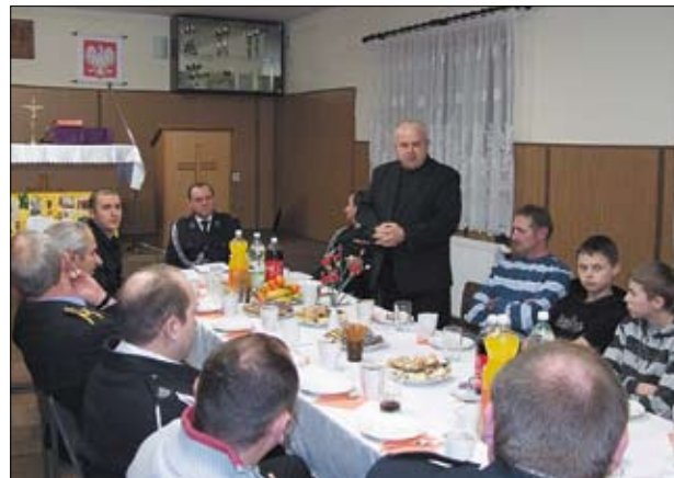
Zebranie sprawozdawcze OSP Rokitki.

kupiono za 166 000 zł przy udziale 86 000 zł z kasy gminnej.