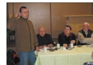
Przedstawiciel firmy WAKOZ omówił jak będą przebiegały prace budowlane.

ulic zostaną całkowicie przebudowane chodniki, które będą wykonane z kostki polbrukowej. Natomiast nawierzchnia jezdni będzie asfaltowa. Zadanie, którego całkowita wartość jest szacowana na kwotę 8.440.363,89 zł otrzymała 50-cio procentowe wsparcie wydatków kwalifikowanych ze środków EFRR.