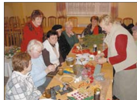
Klub Aktywnego Seniora.