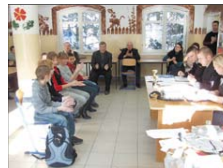
Zawodnicy udzielali odpowiedzi ustnych z zakresu wiedzy pożarniczej.