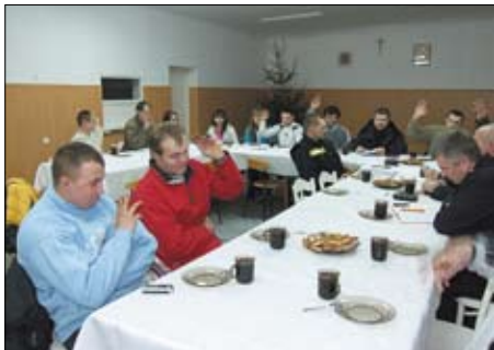
Zebranie sprawozdawcze OSP Małzewo.

Co warto podkreślić aż 4 wozy (3 lekkie i 1 średni) zakupione zostały w ciągu ostatniej kadencji samorządu. Volvo z Miłobądz kosztowało 417 300 zł, z czego gmina dała ok. 300 000 zł. Fordy dla Boroszewa i Rokitek kosztowały 320 727,40 zł, a udział własny gminy to 218 780 zł. Ford, jaki trafił do jednostki w Turzu za-