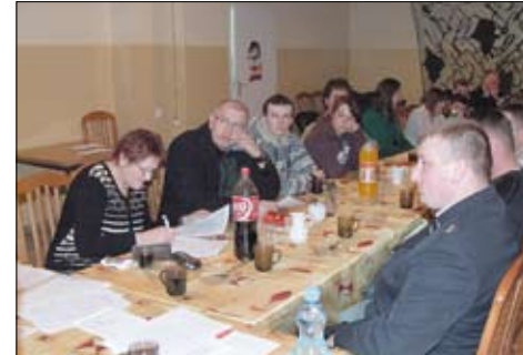
Zebranie sprawozdawcze OSP w Miłobądz.