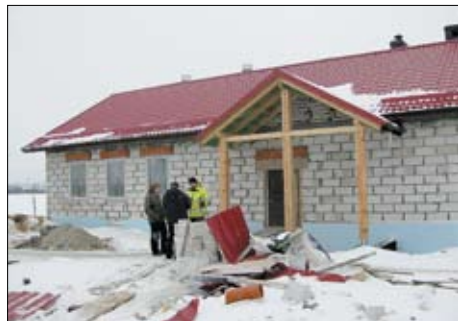
Świetlica w Tczewskich Łąkach