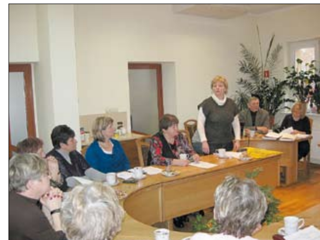
Spotkanie robocze w Urzędzie Gminy Tczew.