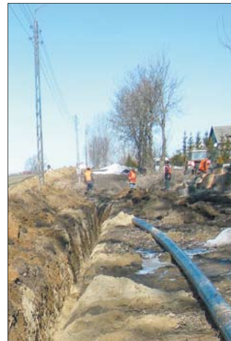
Budowa wodociągu w Zajęczkowie.