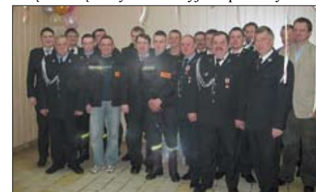
Ochotnicza Straż Pożarna w Dąbrówce.

W tym roku w Dąbrówce odbędą się uroczyste obchody dnia strażaka. Z tej okazji przewidziane jest wiele atrakcji dla całej społeczności lokalnej. O tym, co przygotowali strażacy będziemy mogli przekonać się już 1 maja br. Z kolei 13 czerwca br. na boisku w Dąbrówce odbędzie się festyn rekreacyjno-sportowy.