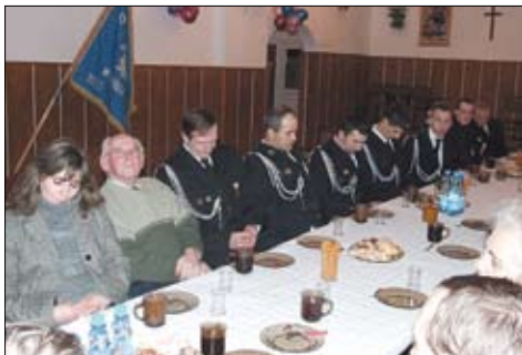
Zebranie sprawozdawcze OSP Boroszewo.