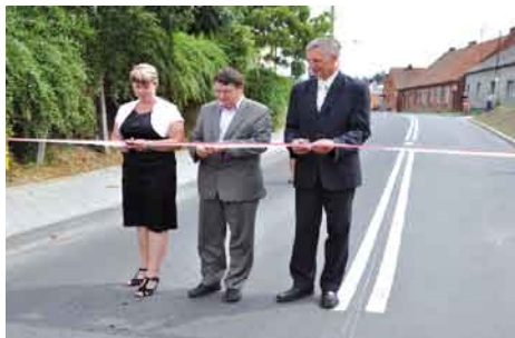
Droga w Rokitkach.

Na zakończenie uroczystości Pani sołtys zaprosiła wszystkich uczestników na poczęstunek do świetlicy.