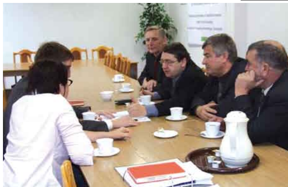
Delegacja z gminy Tczew wybrała się do GDDKiA w Gdańsku w celu omówienia spraw bezpieczeństwa na drodze krajowej nr 22.

Inwestycja obejmuje przebudowę układu drogowego od Gnieszewa do Zabagna. Na odcinku 7 km zostanie poprawiona nawierzchnia, wykonane zostaną wjazdy na posesje mieszkańców, przebudowane zostaną skrzyżowania oraz powstaną zatoczki dla autobusów. Wybudowany zostanie również chodnik na odcinku 1,3 km. Obecnie układany jest chodnik w Swarzędzie.