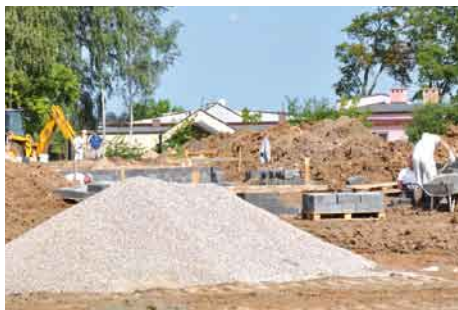
Budowa boiska w Lubiszewie.

zaplecze higieniczno-sanitarne o wysokim standardzie. Całość będzie ogrodzona i oświetlona.