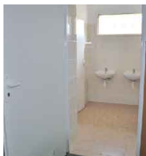
Dzieci mogą już korzystać z nowo wyremontowanych toalet