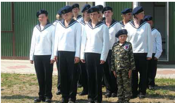
Uczestniczki obozu w galowych strojach witały gości podczas dnia otwartego.