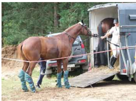
Powrót do domu był trudny nikt nie chciał odjeżdżać nawet konie protestowały.