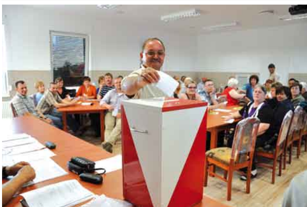
Wybory w Tczewskich Łąkach.