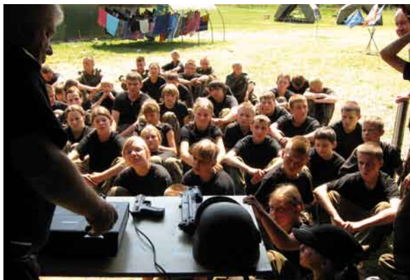
Spotkanie młodzieży z funkcjonariuszami Straży Ochrony Kolei.

Takie obozy to dobra szkoła przetrwania. Dzieci poznają żołnierski kunszt, uczą się dyscypliny, zaradności oraz samodzielności. Tegoroczny program zajęć był przeogromny min. zajęcia sprawnościowe, konkursy strzeleckie, gra w paintball, wycieczka do Szybarka i do Gdyni, wieczorne ogniska, a nawet