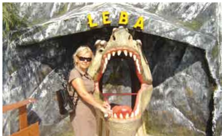
Łeba - park dinozaurów.

Poniżej prezentujemy galerię zdjęć jak spędzali wakacje mieszkańcy naszej gminy.