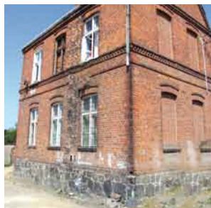
W takim budynku odbywały się kiedyś zebrania wiejskie.

Po części oficjalnej zaproszeni goście udali się do środka klimatyzowanej sali, w której odbyła się krótka prezentacja miejscowości Tczewskich Łąg oraz nowego sprzętu audio wideo zamontowanego w świetlicy. Wszyscy obecni mogli również zobaczyć na zaprezentowanym filmie jak powstawała świetlica.