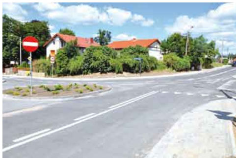
Nowa droga w Rokitkach.