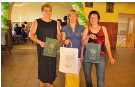
Uczestniczki konkursu z nagrodami.

ścigów konnych, rzucania lassem, kankana, biesiadowania w saloonie przy muzyce country.