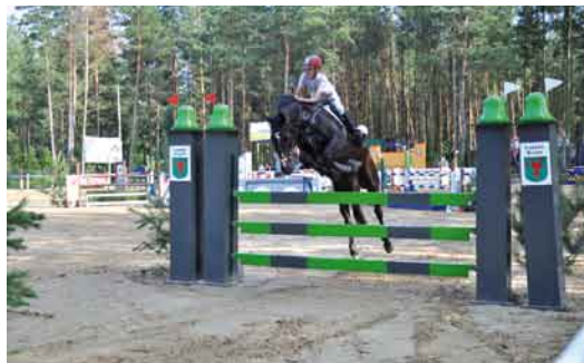
Zawody konne w skokach przez przeszkody