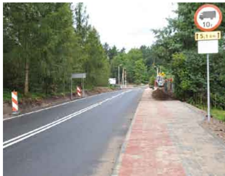
Droga powiatowa nr 2714 G.

Z końcem sierpnia zakończyły się prace budowlane na odcinku 263 m drogi powiatowej nr 2714G tj. od skrzyżowania z drogą krajową nr 22 przez przejazd kolejowy do połączenia z niedawno wyremontowaną drogą. Na tym odcinku wymieniono nawierzchnię jezdni, przebudowano zjazdy publiczne i indywidualne, wykonano odwodnienie, dokończono ciąg pieszo rowerowy oraz przebudowano oświetlenie uliczne. Zadanie wykonywane było przez Starostwo Powiatowe, jednak Wójt Gminy Tczew i tym razem partycypował w kosztach wykonania inwestycji.