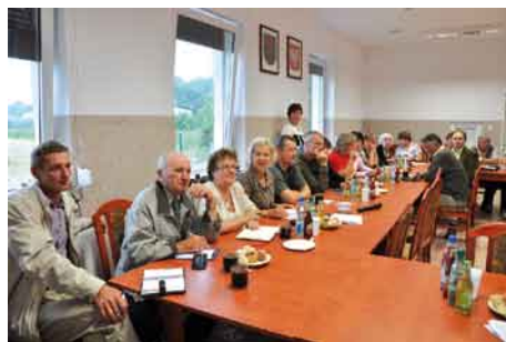
Sołtysi i przewodniczący KGW.

Zebrania z sołtysami i przewodniczącymi KGW mają charakter roboczy i mają na celu osiągnięcie jak najlepszej współpracy pomiędzy władzą wykonawczą, czyli wójtem gminy, a jej mieszkańcami, za pośrednictwem ich przedstawicieli, jakimi są sołtysi oraz przewodniczące KGW.