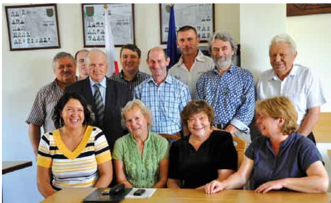
Uczestnicy konkursu Piękna Wieś na uroczystym wręczaniu nagród.