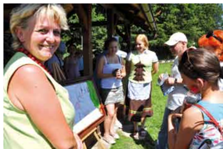
Jury oceniało talenty plastyczne pań.

Pierwsza pt. potrawa z ziemniaków ukoiliła podniebienia jury. W drugiej oceniano talenty plastyczne. Zadanie polegało na przygoto-