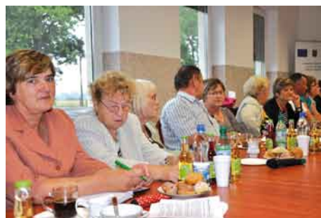
Sołtysi i przewodniczący KGW.