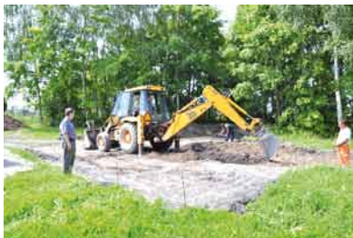
Budowa placu zabaw w Lubiszewie w ramach programu radosna szkoła.

Ze względu na napływające prośby od rodziców w sprawie utworzenia przedszkola, obecnie przygotowany jest projekt na rozbudowę i tej szkoły.