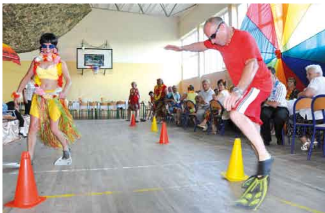
Konkurencja - bieg w płetwach.

ścigów konnych, rzucania lassem, kankana, biesiadowania w saloonie przy muzyce country.