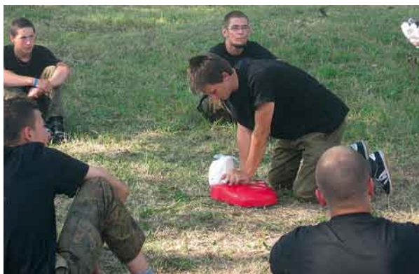
Zajęcia z pierwszej pomocy.