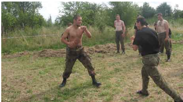
Ćwiczenia z samoobrony.

Rodzice mogli odwiedzić swoje pociechy podczas tzw. dnia otwartego. Obozowicze pokazali swoim gościom jak mieszkają oraz zaprezentowali nabyte umiejętności.