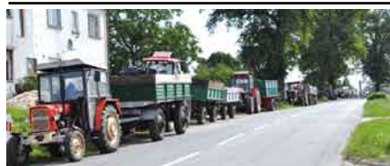
Długie kolejki do skupu zbóż.