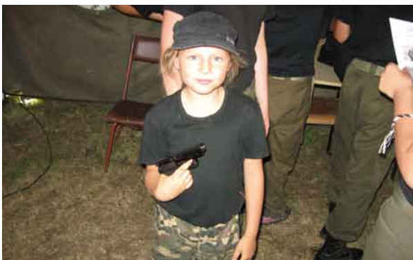
Najmłodsza uczestniczka obozu.