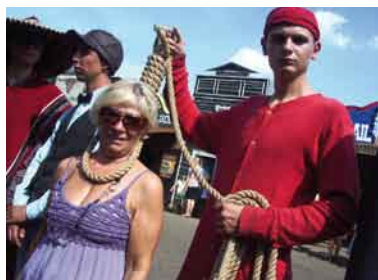
Rudnik - miasteczko westernowe.