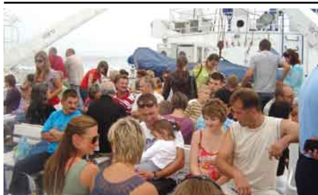
Rejs na Hel.