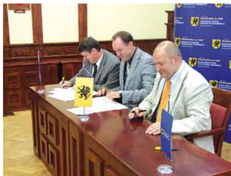
Podpisanie umowy z Marszałkiem Mieczysławem Struk i Wicemarszałkiem Wiesławem Byczkowskim.

Projekt obejmuje budowę boiska sportowego o nawierzchni poliuretanowej oraz placu zabaw wraz z zagospodarowaniem terenu przy świetlicy wiejskiej. Łączna powierzchnia wybudowanych obiektów wyniesie 320,40 m 2 . Plac zabaw wzbogaci się o dwie zabawki tj. piaskownicę wyprofilowaną umożliwiającą za-