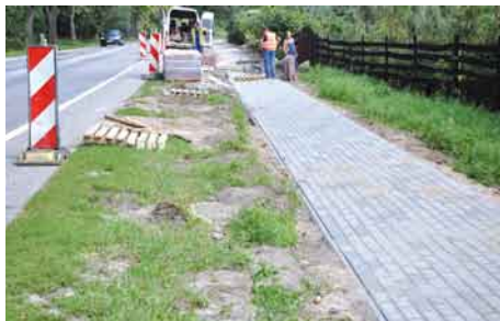
Budowa nowego chodnika.

W końcu doczekaliśmy się rozpoczęcia przebudowy drogi krajowej nr 22 Starogard Gdański – Gnieszewo. Wielu radnych gminy Tczew wraz z Wójtem prowadziło liczne rozmowy z Generalną Dyrekcją Dróg Krajowych i Autostrad w Gdańsku w sprawie poprawy bezpieczeństwa oraz usprawnienia ruchu na drodze nr 22. Długo uzgadniany projekt przebudowy tej drogi wszedł w fazę realizacji.