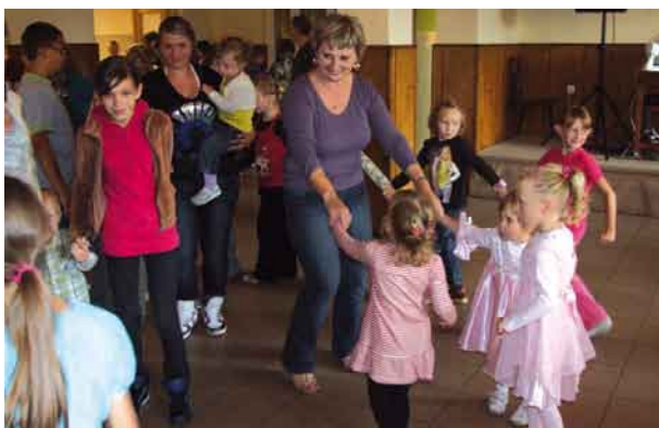
Tanecznym krokiem dzieci żegnały wakacje.