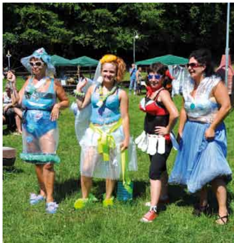
Moda XXII wieku

Gratulujemy Paniom z Koła Gospodyń Wiejskich Czatkowy zwycięstwa i życzymy powodzenia na wojewódzkim turnieju w Żukowie.