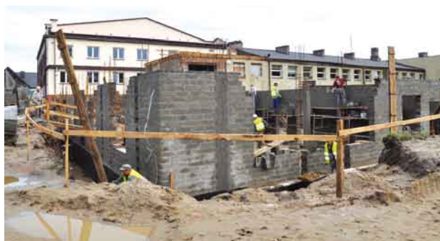
Prace budowlane wykonywane są zgodnie z harmonogramem.