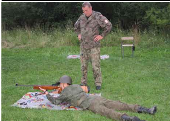
Strzelanie - najlepsza frajda dla uczestników obozu.