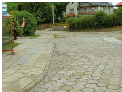
Tak kiedyś wyglądała droga w Rokitkach.