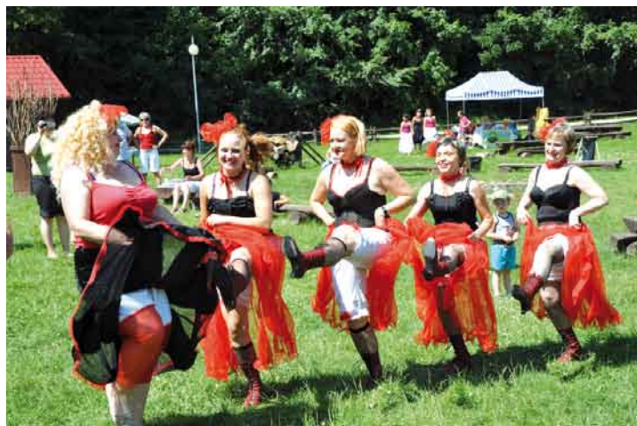
Kankan w wykonaniu gospodyń z Czatków.

W kolejnej konkurencji panie zaprezentowały się w nowoczesnych strojach XXII wieku. Kto by pomyślał, że plastikowe butelki po napojach to wspaniały materiał na buty, a zakrętki od nich to elegancka biżuteria.