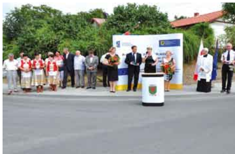
Droga w Rokitkach.