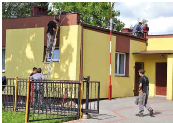
Prace instalacyjne na budynku remizy OSP w Turzu.

Obecnie prace wykonywane są w remizie w Turzu. Zgodnie z umową prace zakończyć się mają do 31 października br.