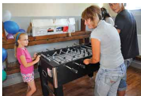
Nieliczni wybrali rozrywkę przy stole z piłkarzykami.