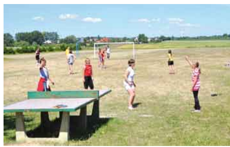
Pogoda sprzyjała zabawom sportowym na boisku przy świetlicy.