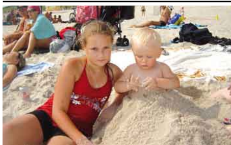
Zabawy na plaży w Łebie.