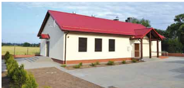
Teraz mieszkańcy do dyspozycji mają nowy budynek.