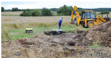
Budowa kanalizacji w Goszynie.