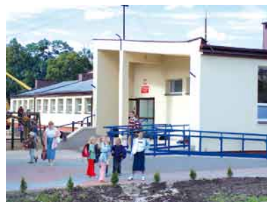
ZESPÓŁ KSZTAŁCENIA I WYCHOWANIA W SWARZĘDZIE.

ly. Budowany już jest plac zabaw dla najmłodszych dzieci w ramach rządowego programu „radosna szkoła”. Taki sam plac zabaw powstaje również przy Zespole Kształcenia i Wychowania w Turzu.