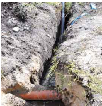
Budowa wodociągu w Zajączkowie.

Koszt przedsięwzięcia wynosi 688 398,94 zł. brutto. Przewidywany termin ukończenia zadania to przełom października i listopada tego roku.