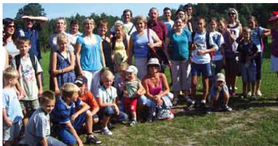
Zbiórka przed wyjazdem.