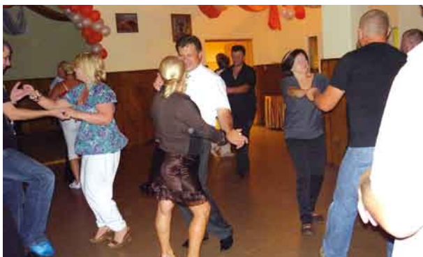
W godzinach wieczornych zabawa dla dorosłych z okazji pożegnania lata.