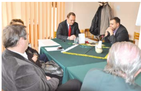
Spotkanie z posłem Eugeniuszem Kłopotek

Mieszkańcy naszej gminy spotkali się z posłem Eugeniuszem Kłopotek. Podczas spotkania omawiane były indywidualne problemy przybyłych osób związane z zagospodarowaniem przestrzennym, prawem łowieckim i sytuacją w rolnictwie. Poseł powiedział również kilka słów na temat pracy w sejmie oraz panujących tam nastrojów przedwyborczych.