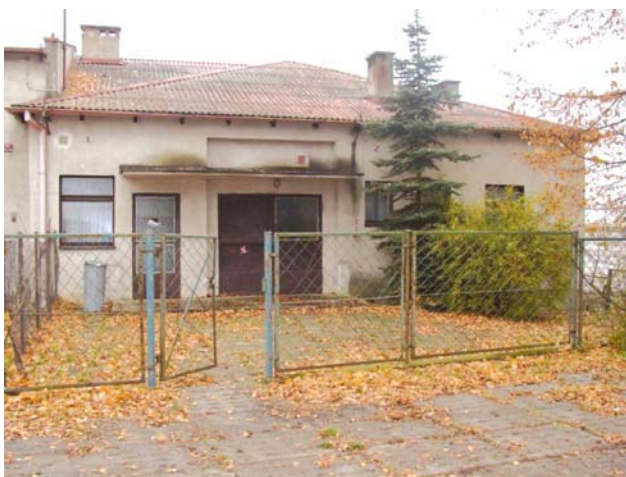
Świetlica wiejska w Dalwinie

Projekt pn. „Aktywizacja życia kulturowego – przebudowa świetlicy wiejskiej i boksu garażowego w Dalwinie” uzyskał średnią ocenę punktową 52,29 i tym samym znalazł się na pierwszej pozycji na liście rankingowej ocenionych operacji. Wniosek o przyznanie pomocy został zgłoszony na konkurs w ramach działania odnowa i rozwój wsi do LGD Wstęga Kocięwia. Ponieważ wniosek mieścił się w limicie posiadanych środków, został wybrany do realizacji, a następnie przekazany do DPROW, gdzie przejdzie przez kolejne oceny ekspertów.