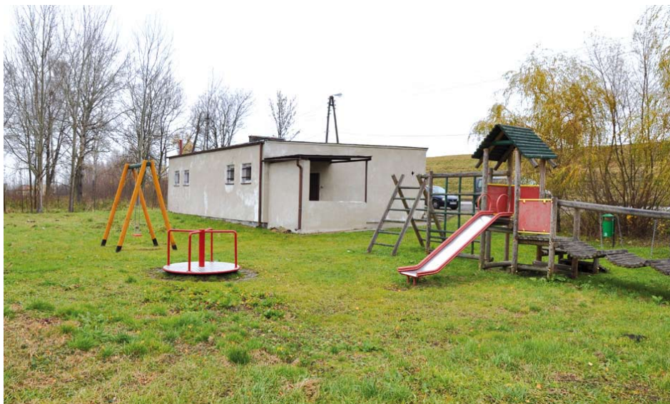
Plac zabaw przy świetlicy w Czatkowach

posażony w urządzenia zabawowe pozwoli na integrowanie i aktywizację najmłodszych mieszkańców sołectwa Czatkowy. Całkowity koszt zadania wynosi 66 982 zł., z tego kwota dofinansowania wynosi 41 178 zł.