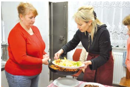
Przygotowywanie smacznych sałatek

pięć dni prowadzone były zajęcia pod hasłem: „Rozwój osobisty człowieka oraz oferta konstruktywnego spędzania przez młodzież czasu wolnego poprzez rozwój zainteresowań”. Zajęcia miały nauczyć młodzież konstruktywnych zachowań prospołecznych potrzeb-