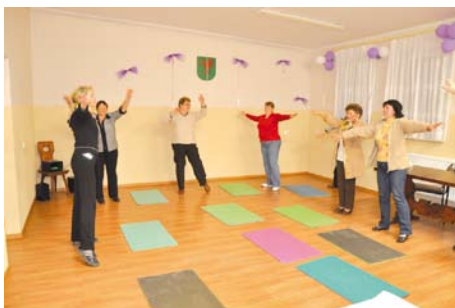
Panie poprawiały swoją kondycję fizyczną

Powyższe warsztaty mają służyć integracji mieszkańców, podnoszeniu świadomości i rozwijaniu aktywności społeczności lokalnej.