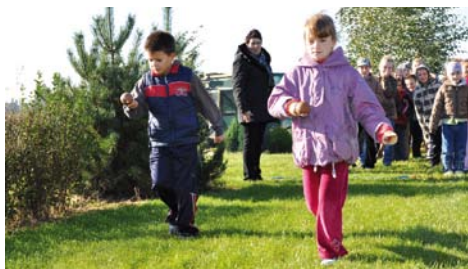
Zabawy sprawnościowe dla dzieci

konkursy z nagrodami. Głównym punktem imprezy było pieczenie ziemniaków na ognisku, a następnie ich konsumpcja. Impreza miała na celu promowanie aktywności dzieci w konkurencjach i zabawach sportowych oraz poszerzenie wiedzy ucznia na temat ziemniaków, ich cech i przeznaczenia.