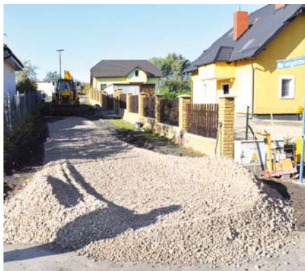
Baldowo ul. Na Wzgórzu

W ostatnim czasie wykonanych zostało wiele zadań związanych z poprawą nawierzchni dróg gminnych. W Gniszewie na części ulicy Spokojnej została ułożona trylinka. Wykonany