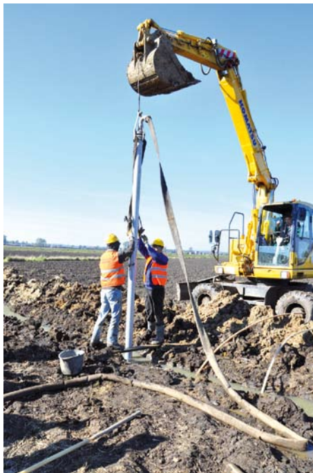
Budowa kanalizacji w Tczewskich Łąkach

W ramach zadania wybudowane zostanie 30,3 km sieci grawitacyjno- tłocznej, 19 prze-