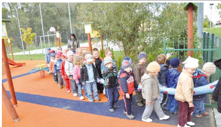
Dzieci ze smutkiem opuszczają plac zabaw

łą kwotę Gmina musiała wyłożyć jako wkład własny. Warto, ponieważ place zabaw są wyposażone w tzw. bezpieczną nawierzchnię i certyfikowany sprzęt, tak aby najmłodsi uczniowie bawili się radośnie i bez troski.