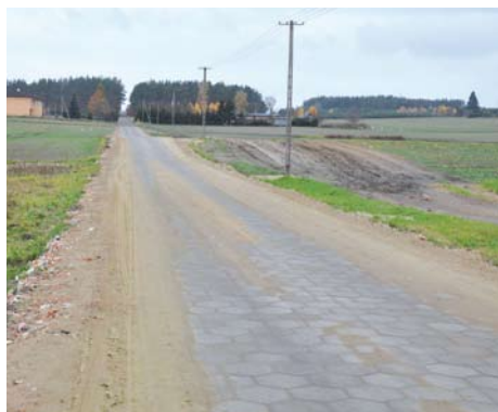
Gniszewo ul. Spokojna

Na przyszły rok planuje się postawienie kolejnych 70 punktów świetlnych.