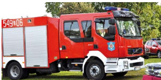
Samochód strażacki ratowniczo-gaśniczy średni marki Volvo