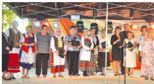
Laureaci konkursów na najładniejszy wieniec dożynkowy i stroik

Serdeczne podziękowania składamy wszystkim osobom zaangażowanym w organizację dożynek w Turzu.