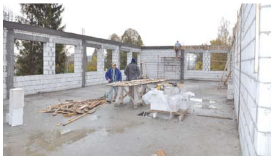
Rozbudowa ZKiW w Swarzędzie

Całkowity koszt projektu wynosi 6 279 334,09 zł., w tym kwota dofinansowania 2 400 000,00 zł.