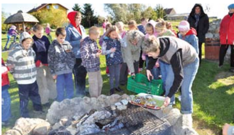
Pieczenie ziemniaków na ognisku