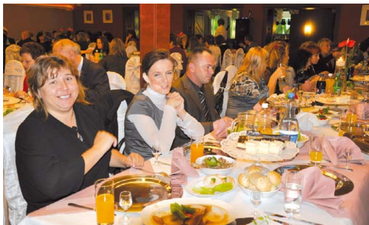
Na pierwszym planie nauczyciele ze SP w Lubiszewie