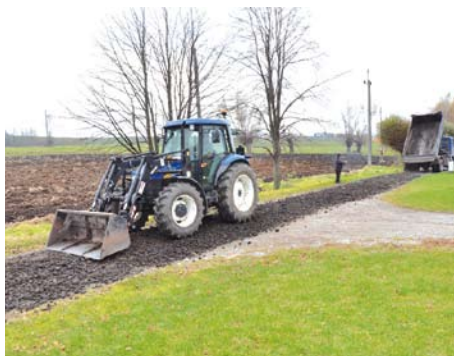
Droga za stacją benzynową Olkop w Zajączkowie

trylinkę rozbiórkową przekazaną przez gminę. Ponadto 98 ton tłucznia zostało wbudowane w