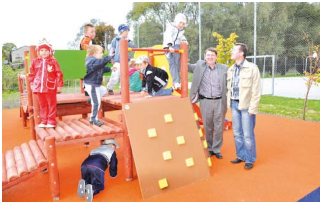
Plac zabaw w Turzu