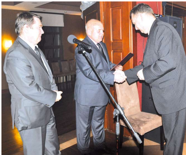
Nagrody wójta dla wyróżnionych nauczycieli

cieli Emerytów i Rencistów przy Starostwie Powiatowym w Tczewie.