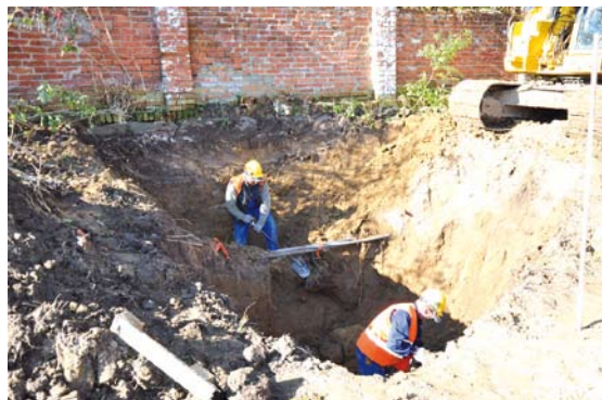
Budowa kanalizacji w Mieściecinie

pompowniami ścieków i 9 przepompowniami przydomowymi. Kompleksowy program gospodarki ściekowej Gminy Tczew obejmuje swym zakresem budowę sieci kanalizacyjnej w Miłobądzu, Maleninie, Mieściecinie, Zajączkowie, Szpęgawie, Dąbrówce, Rokitkach i w Tczewskich Łąkach. Powstaną systemy zbierania ścieków komunalnych, które zostaną przekierowane poprzez sieć miejską do oczyszczalni w Tczewie. Łącznie zostanie podłączonych 2796 mieszkańców oraz nastąpi przyrost 522 RLM od użytkowników instytucjonalnych. Tak ogromna inwestycja ma na celu uporządkowanie gospodarki ściekowej gminy Tczew.