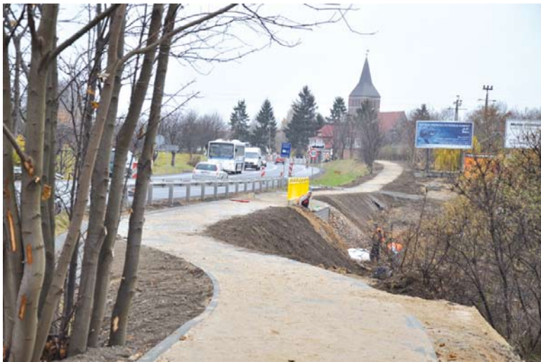
Ostatnie prace przy budowie chodnika w Miłobądzu

2000 roku prowadziła rozmowy z GDDKiA w tej sprawie. Wysłała kilkanaście pism oraz odbyła kilka spotkań z generalną dyrekcją. Pojawiły się obietnice, że przy modernizacji drogi nr 1 wybudowany zosta-