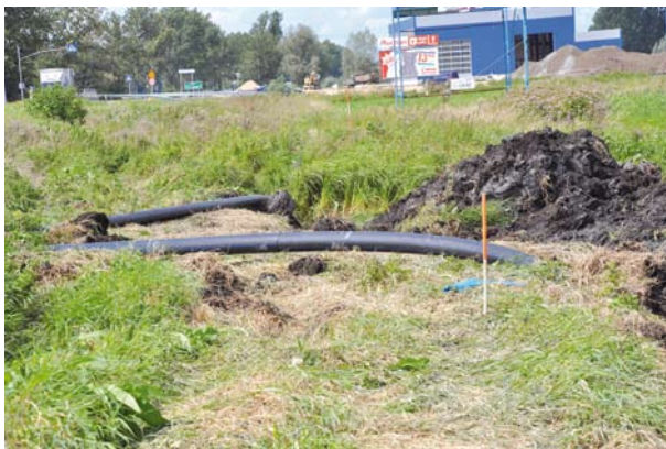
Budowa wodociągu w Zajączkowie

Zakończono prace budowlane uzbrajania terenów inwestycyjnych zlokalizowanych w obrębie Zajączkowa. Zadanie pn. „Uzbrajanie terenów inwestycyjnych w sieć wodno-kanalizacyjną w miejscowości Zajączkowo - etap I” obejmowało budowę sieci wodociągowej Ø 160-200 PE z ujęcia wody „MOTŁAWA” w Tczewie do połączenia z istniejącą gminną siecią wodociągową