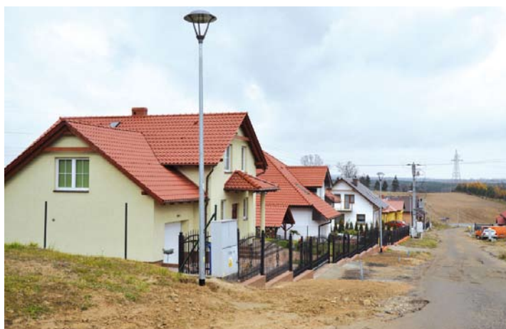
Rokitki ul. Kwiatowa