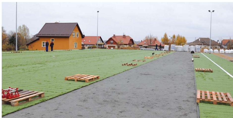
Budowa boiska sportowego w Lubiszewie

Wykonawca rozpoczął już prace budowlane. Zgodnie z umową inwestycja zakończyć ma się pod koniec listopada br. Całkowity koszt zadania to ponad 870 tys. zł. Na powyższe zadanie Wójt Gminy Tczew Roman Rezmerowski pozyskał środki w ramach rządowego programu „Moje boisko - Orlik 2012”. Inwestycję dotują rząd (333 tys. zł) i urząd marszałkowski (333 tys. zł), resztę płaci gmina.