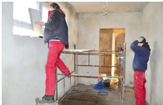
Prace budowlane w zapleczu higieniczno-sanitarnym

Wykonawca rozpoczął już prace budowlane. Zgodnie z umową inwestycja zakończyć ma się pod koniec listopada br. Całkowity koszt zadania to ponad 870 tys. zł. Na powyższe zadanie Wójt Gminy Tczew Roman Rezmerowski pozyskał środki w ramach rządowego programu „Moje boisko - Orlik 2012”. Inwestycję dotują rząd (333 tys. zł) i urząd marszałkowski (333 tys. zł), resztę płaci gmina.