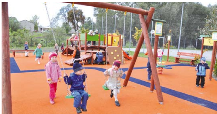
Plac zabaw w Turzu

finansowanie na place zabaw w kwocie 127 700,00 zł, tak więc ogólny koszt tych placów zabaw wyniósł 335 925,20 zł. Z ministerstwa można było uzyskać dofinansowanie w wysokości do 50% wartości każdego placu zabaw. Pozosta-