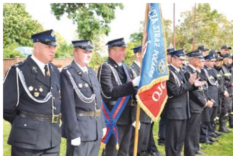
Druhowie OSP w Miłobądzu