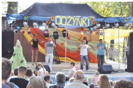
Występ zespołu Skalar

Po przemówieniach zgodnie z wielowiekową tradycją na ręce Wójta złożony został przepiękny