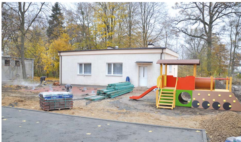
Prace budowlane przy świetlicy w Szczerbiewinie

Całkowity koszt projektu wynosi 399 516,92 zł., z czego dofinansowanie z EFRR wynosi 50% co stanowi kwotę 199 758,46 zł. Wkład własny partnera stanowi 16 873,74 zł., a pozostałą kwotę 182 884,72 zł Gmina Tczew pokryje z własnego budżetu.