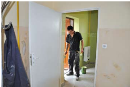
Prace remontowe świetlicy w Czatkowach

trań kociewskich i kuchni innych regionów. Sprzęt audio-video jest niezbędny do aranżowania występów artystycznych oraz szkoleń społeczności wiejskiej. Plac zabaw do-