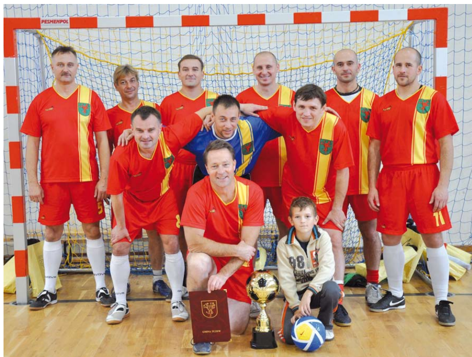
Zwycięska drużyna z Rokitek

Wszystkie drużyny otrzymały nagrody ufundowane przez Wójta Gminy Tczew.