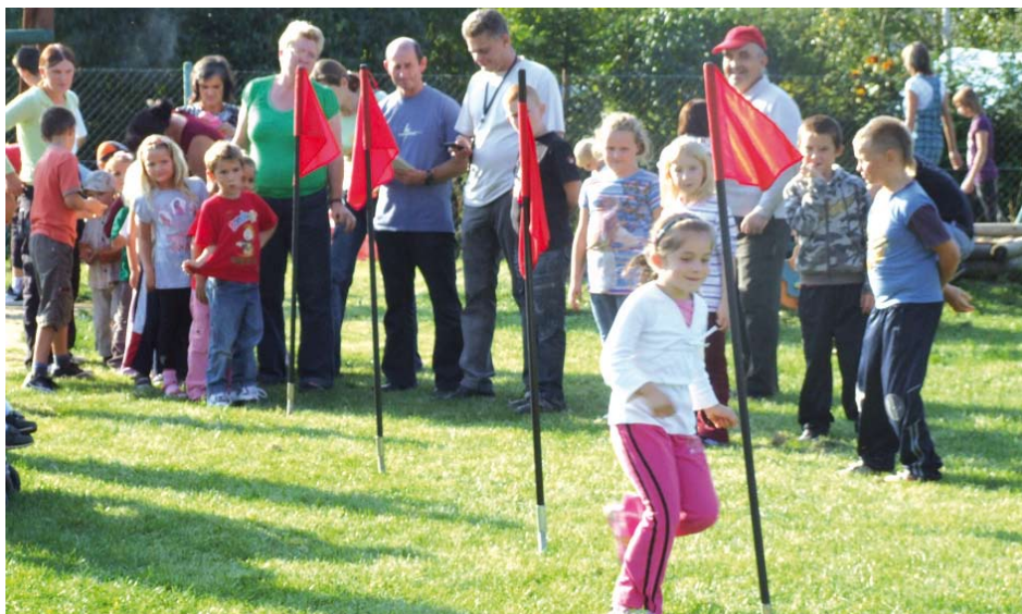
Festyn w Maleninie