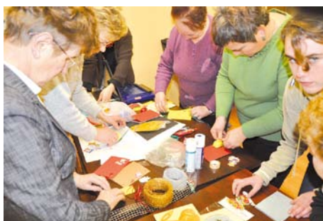
Wykonywanie kartek świątecznych

Celem warsztatów była integracja mieszkańców, podniesienie świadomości i rozwijanie aktywności społeczności lokalnej.