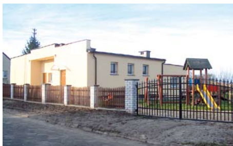
Świetlica wiejska w Bałdowie

W budżecie na rok 2011 zaplanowano wykonanie dokumentacji projektowej przebudowy świetlicy wiejskiej w Bałdowie. W ramach projektu dobudowane zostaną dwa pomieszczenia. Jedno służyć będzie jako pomieszczenie pomocnicze przy kuchni. Drugie natomiast wykorzystywane będzie do celów sportowo-rekreacyjnych, gdzie swoje miejsce znajdzie sprzęt sportowy, który obecnie kurzy się w magazynie w świetlicy.