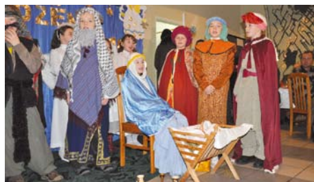
Jasełka w Miłobądzu