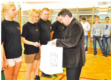
Nagrody dla zwycięzców