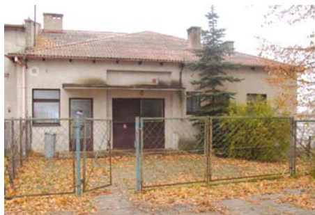
Świetlica wiejska w Dalwinie

nie wyposażona w szafę chłodniczą, szafki kuchenne i szafę przesuwaną do zabudowy. Plac przed budynkiem zostanie wyłożony kostką brukową, zielen wokół obiektu zostanie uporządkowana oraz zmienione zostanie ogrodzenie frontowe. Ponadto zamontowana zostanie nowa elektroniczna syrena alarmowa.