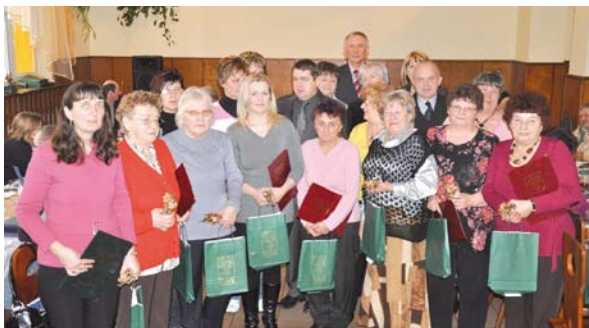
Wspólne zdjęcie przewodniczących kół gospodyń wiejskich z władzami gminy

kie podziękowania. Wójt podziękował paniom słowami: „Dziękuję za dobrą współpracę, za nieustrudzone kultywowanie dziedzictwa kulinarnego i kulturalnego. Dziękuję za aktywną działalność w każdej sferze wykonywanych zadań, a także efektywną pracę na rzecz społeczności lokalnej”.