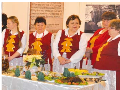
KGW Swarżyn prezentuje stół wigilijny

Każdy z uczestników przeglądu mógł podziwiać odświętnie udekorowane stoły i do woli smakować i rozkoszować się niepowtarzalnym smakiem kociewskich potraw takich jak: barszcz z uszkami, paszteciki, pierogi, śledzie