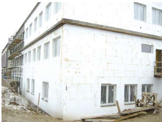
Prace budowlane ZKiW w Swarzędzie

Nowe sale lekcyjne wybudowane w Swarzędzie będą miały powierzchnię w granicach 75 – 90 m 2 . Sale zostaną wyposażone w nowy sprzęt audiowizualny (tablice interaktywne). Zostanie wybudowana sala komputerowa i sala ćwiczeń korekcyjnych. Rozbudowa budynku szkolnego w Swarzędzie zawiera rozbudowę węzła kuchennego i świetlicy. Realizacja zadania pozwoli na zmniejszenie skali dowozu i odwozu uczniów oraz zwiększy możliwości organizacji zajęć fakultatywnych i świetlicowych.