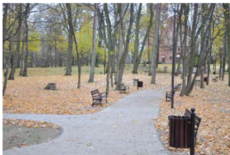
Park w Turzu