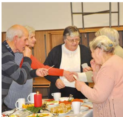
Spotkanie wigilijne w Rokitkach

Podczas spotkań wigilijnych nie zabrakło święconego opłatka, a przy nim życzeń, ciepłych i rodzinnych świąt Bożego Narodzenia oraz szczęśliwego Nowego Roku.