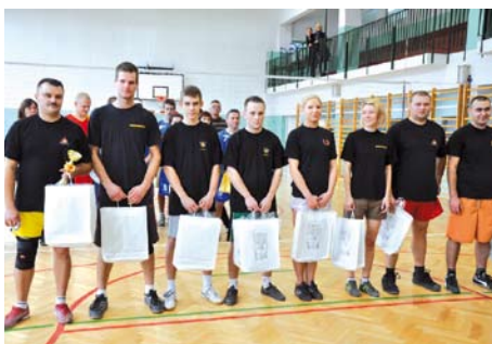
Zwycięska drużyna OSP Swarzędz