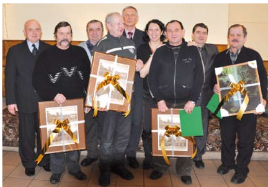
Wspólne zdjęcie przedstawicieli OSP z władzami gminy

Podczas spotkania władze gminy doceniły również pracę najbardziej aktywnych pań w gminie. Są to właśnie kobiety zrzeszone w Kołach Gospodyń Wiejskich, które mimo wielu obowiązków potrafią znaleźć czas i chęci na realizację różnych inicjatyw społecznych. Mimo, że nie kończy się kadencja przewodniczących KGW, gdyż wybierane są na czas nieokreślony, należą im się wiel-