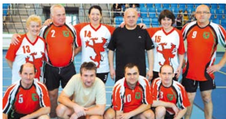
Drużyna reprezentująca Gminę Tczew