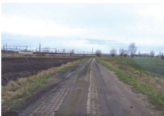
Tczewskie Łąki ul. Żurawia