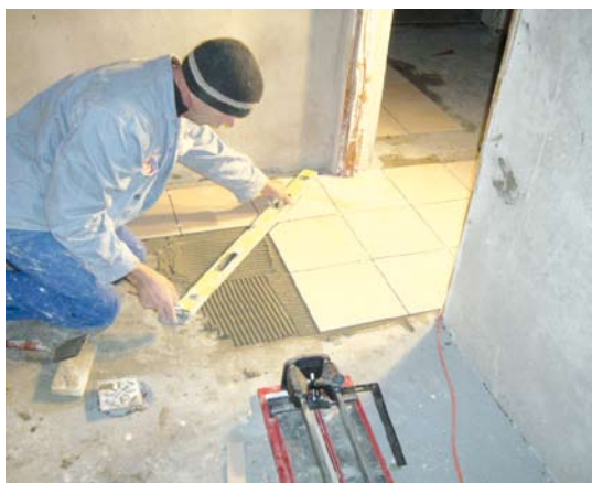
Prace budowlane ZKiW w Swarzędzie

W projekcie przewidziano wykorzystanie podpiwniczonej części budynku szkoły. Na tej części zaprojektowano zdjęcie stropodachu i wykonanie podwyższonego stropu nad parterem oraz nadbudowę piętra. W dobudowanej części zlokalizowano podstawowe funkcje obiektu. W istniejącej części budynku szkoły przewidziano zmianę funkcji pomieszczeń.