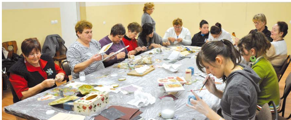
Tak powstawały artystyczne dzieła mieszkańców Bałdowa na warsztatach

Mamy nadzieję, że będzie więcej takich inicjatyw na terenie naszej gminy.