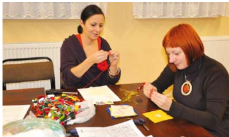
Panie prowadzące warsztaty prezentują technikę haftu