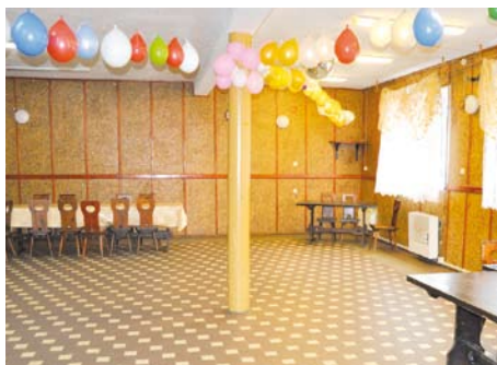
Sala w świetlicy w Śliwinach