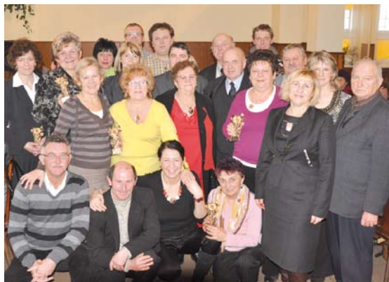
Wspólne zdjęcie sołtysów z władzami gminy