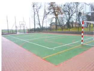
Nowe boisko w Szczerbiecinie