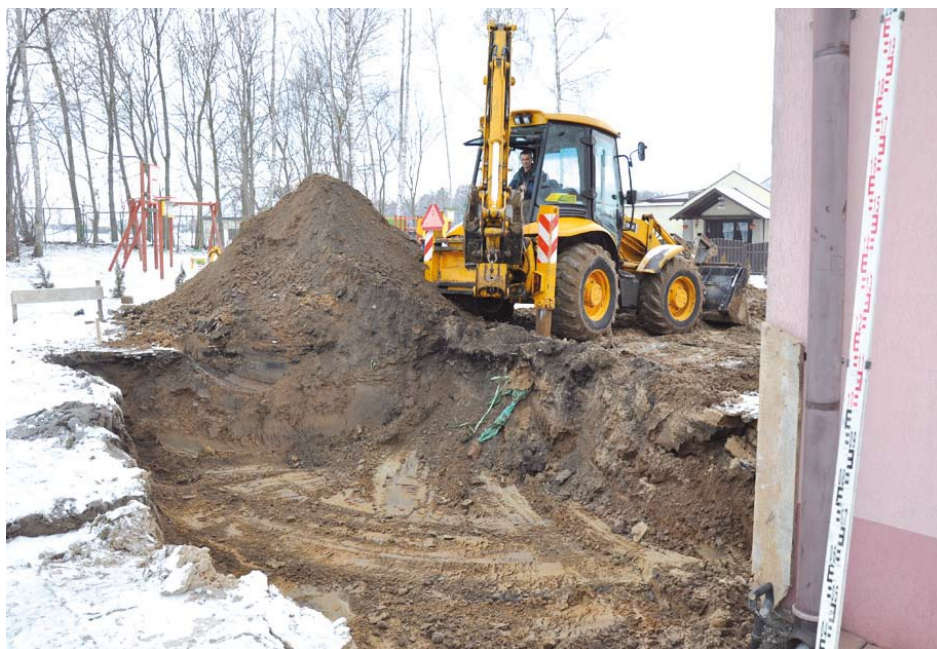
Prace budowlane w Szkole Podstawowej w Lubiszewie

Całkowity koszt projektu wynosi 422 609,29 zł. W budżecie zarezerwowane są także dodatkowe środki na wyposażenie obiektu.