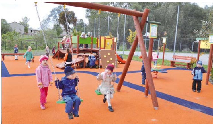
Plac zabaw w ramach programu „radosna szkoła” przy ZKiW w Turzu

Powstanie nowy plac zabaw dla dzieci przy Zespole Kształcenia i Wychowania w Swarzędzie. W związku z utworzeniem przedszkola takie miejsce zabaw na powietrzu jest niezbędne.