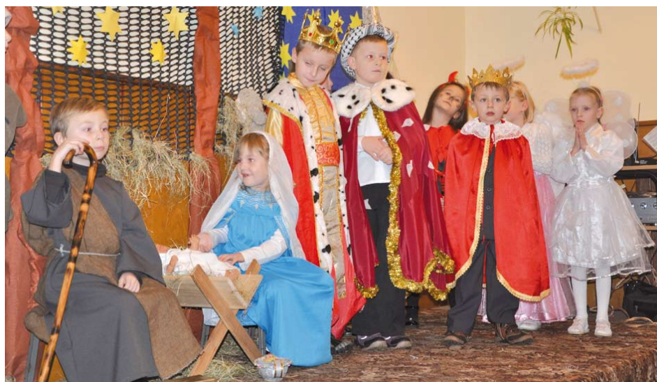
Jasełka w Swarzędzinie