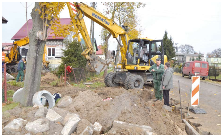
Budowa kanalizacji w Miłobądzu

W ramach zadania wybudowane zostanie 30,3 km sieci grawitacyjno- tłocznej, 19 przepompowni ścieków i 9 przepompowni przydomowych. Kompleksowy program gospodarki ściekowej Gminy Tczew obejmuje swym zakresem budowę sieci kanalizacyjnej w Miłobądzu, Maleninie, Mieście, Zajączkowie, Szpegawie, Dąbrówce, Rokitkach i w Tczewskich Łąkach. Powstaną systemy zbierania ścieków komunalnych, które zostaną przekierowane poprzez sieć miejską do oczyszczalni w Tczewie. Łącznie zostanie podłączonych 2796 mieszkańców oraz nastąpi przyrost 522 RLM od użytkowników instytucjonalnych. Tak ogromna inwestycja ma na celu uporządkowanie gospodarki ściekowej gminy Tczew.