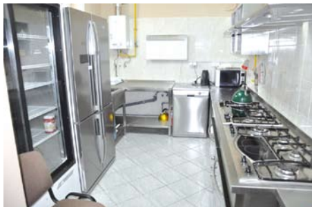
Nowa kuchnia w świetlicy w Czatkowach

Do dopełnienia całości niezbędny jest jeszcze remont zewnętrzny budynku. W budżecie na 2011 rok zaplanowano wykonanie docieplenia budynku