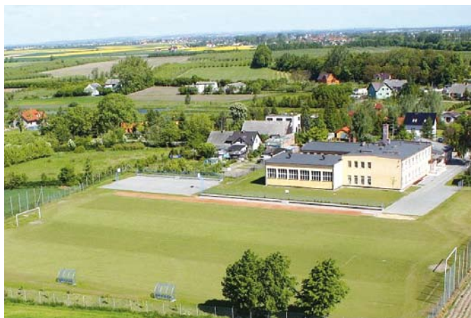
Szkoła Podstawowa w Miłobądku

budynku zaprojektowano szerszą drogę wewnętrzną oraz nowe miejsca postojowe dla pracowników i autobusu szkolnego. Dodatkowo wykonana zostanie druga droga wewnętrzna z miejscami postojowymi umożliwiającą dojazd do przedszkola oraz boisk i placów zabaw. Przedsięwzięcie planowane jest na lata 2012-2014.