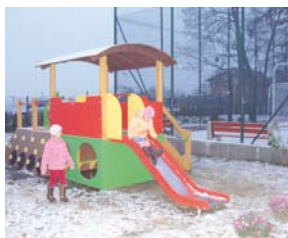
Pierwsze zabawy na placu zabaw