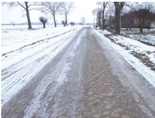
Tczewskie Łąki ul. Zajaczkowska

Złożony został wniosek do terenowego Funduszu Ochrony Gruntów Rolnych o dotację na przebudowę ul. Zajaczkowskiej w Tczewskich Łąkach. Zadanie zostało podzielone na dwa etapy. Pierwszy dotyczy odcinka od mostku do torów PKP, gdzie ułożone zostaną płyty drogowe. Drugi etap obejmuje wykonanie dokumentacji projektowej dla odcinka drogi od skrzyżowania z ul. Motławską do mostku. W tym roku zaplanowano również wykonanie przebudowy ul. Dworcowej w Czarlinie. Za kwotę 300 tys. zł. powstanie nowa nawierzchnia oraz chodnik. Do budżetu wpisano również przebudowę ul. Żurawiej w Tczewskich Łąkach. Zadanie polega na poprawieniu nawierzchni poprzez przełożenie oraz częściową wymianę płyt drogowych. Planowany koszt zadania to 150 tys. zł.