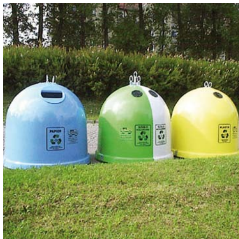
Pojemniki na odpady typu IGLO

Złożony został wniosek o dofinansowanie zadania pn. „Stworzenie systemu selektywnej zbiórki odpadów w Gminie Tczew” w ramach PROW działanie 321 „Podstawowe usługi dla gospodarki i ludności wiejskiej”. Projekt przewiduje zakupienie 168 pojemników o poj. 2m 3 typu IGLO w celu stworzenia 56 gniazd do selektywnej zbiórki odpadów. W gnieździe będą znajdować się 2 pojemniki na opakowania z tworzyw sztucznych oraz 1 pojemnik na odpady szklane. Przewidywany termin realizacji zadania to 2012 rok. Wartość zadania to ponad 196 tys. zł.