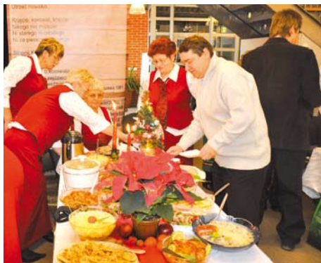
Degustacja potraw wigilijnych

Celem przeglądu była ochrona dziedzictwa kulinarnego Kociewia, pobudzenie aktywności społeczeństwa wiejskiego w zakresie kultywowania tradycyjnej kuchni i obyczajów związanych ze świętami Bożego Narodzenia, integracja społeczności wiejskiej i miejskiej, wymiana doświadczeń, promocja folkloru Kociewia.