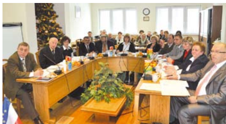
Radni Gminy Tczew podczas uchwalania budżetu na rok 2011

Planowane inwestycje 25 mln zł sięgają ponad połowy budżetu, czyli co druga złotówka pójdzie na zadania inwestycyjne, o ile wszystko pójdzie zgodnie z jego założeniami. Niektóre zadania ujęte w budżecie będą realizowane długoterminowo, co spowoduje ich kontynuację w kolejnych latach.