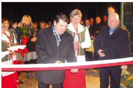
Uroczyste przecięcie wstęgi

Celem przedsięwzięcia jest zwiększenie aktywności i jedności mieszkańców poprzez wspólny udział w organizowanych wydarzeniach sportowych, które swym zakresem będą obejmowały także inne sołectwa.