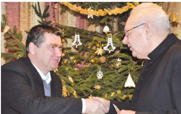
Dzielenie się opłatkiem

Tradycyjnie dzielono się opłatkiem i składało życzenia. Odświętnie nakryte stoły zastawione były wigilijnymi potrawami, przygotowanymi przez Koła Gospodyń Wiejskich. Na