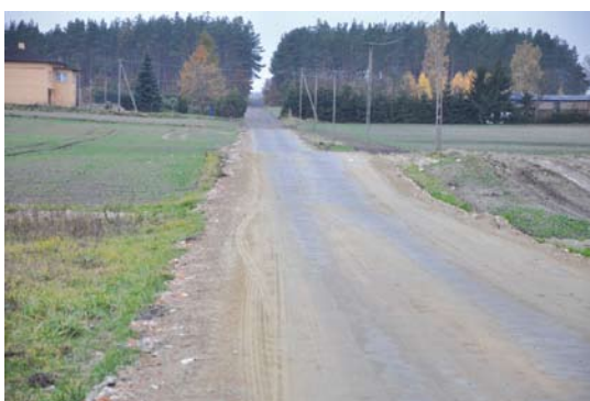
Gniszewo ul. Spokojna