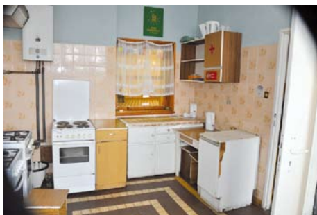
Tak obecnie wygląda kuchnia w świetlicy w Śliwinach

W Śliwinach planuje się kapitalny remont świetlicy wiejskiej. W budynku zostaną przesunięte ścianki działowe w pomieszczeniach toalet. W świetlicy wykonane będzie docieplenie dachu, ścian i posadzek. Instalacje: grzewcza, sanitarna, elektryczna, oświetleniowa i wentylacyjna w całości będą nowe. Świetlica wzbogaci się o sprzęt audio-video i nagłośnieniowo-projekcyjny. Nowe wyposażenie otrzyma również pomieszczenie kuchenne. W ramach zagospodarowania terenu wokół świetlicy będzie ułożony polbruk wzdłuż budynku świetlicy.