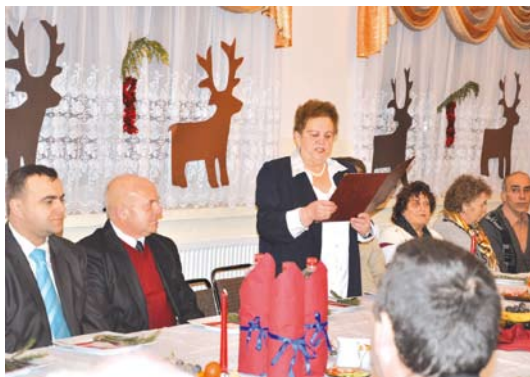
Spotkanie wigilijne w Boroszewie