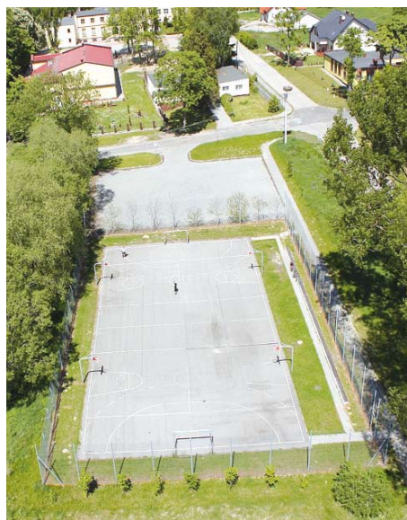
Boisko w Turzu

z boiska, postanowiono wykonać nową poliuretanową nawierzchnię. Zamontowane zostanie również nowe oświetlenie, które swym zasięgiem obejmie parking, boisko oraz place zabaw.