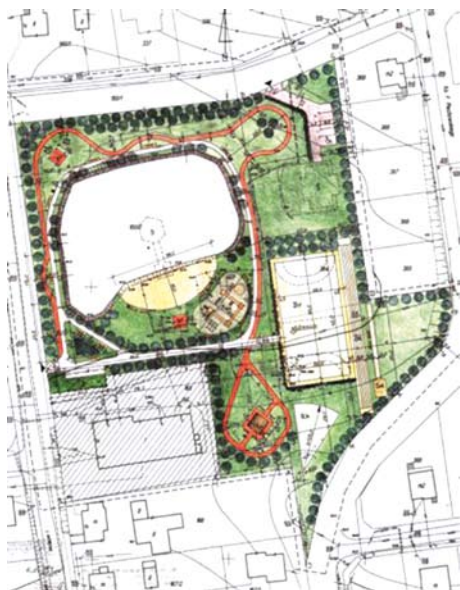
Plan zagospodarowania terenu przy świetlicy w Swarzędzinie

Obecnie trwają prace związane z przygotowaniem postępowania o udzielenie zamówienia publicznego i wyłonienie wykonawcy, który zrealizuje przedmiotowe zadanie.