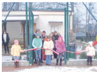
Uroczyste przecięcie wstęgi przez dzieci