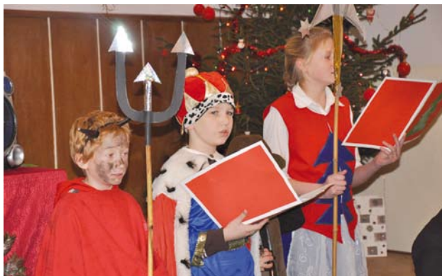
Jasełka w Boroszewie