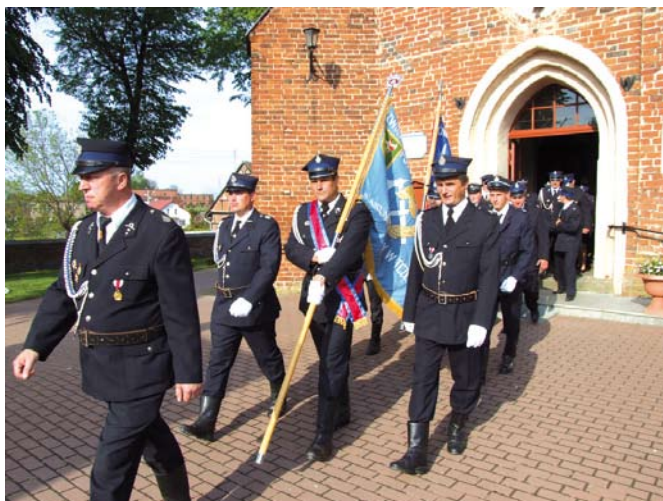
Obchody Dnia Strażaka