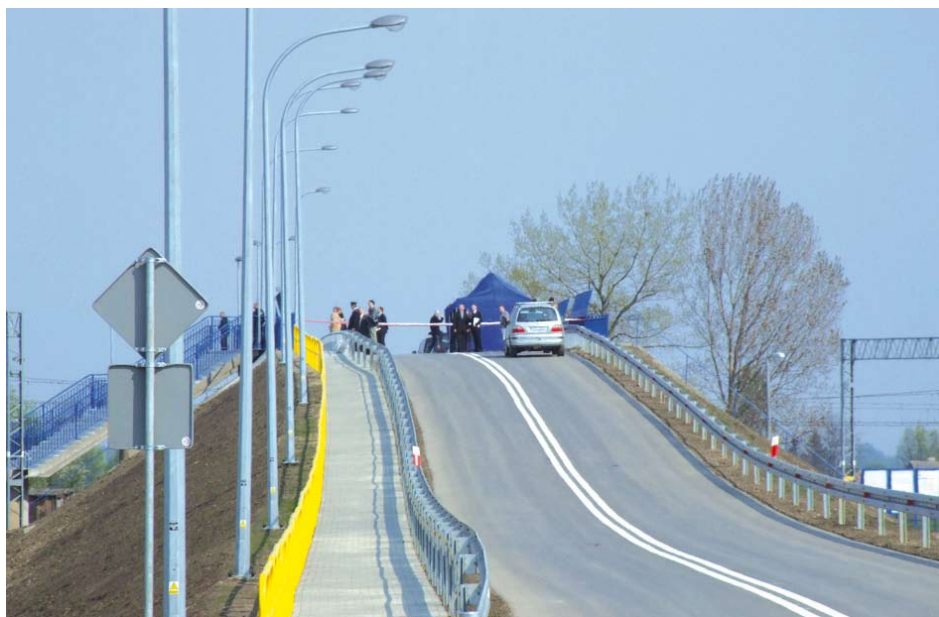
Wiadukt w Miłobądzu