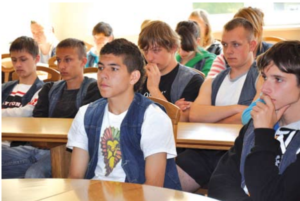
Gimnazjaliści z Dąbrowki