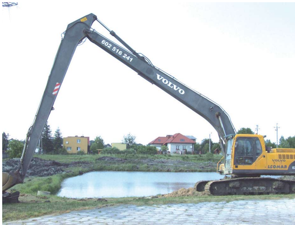
Prace przy pogłębianiu stawu

ta wartość projektu wynosi 936.374,68 zł. Zgodnie z umową wykonawca zobowiązał się zakończyć prace do czerwca 2012 r.