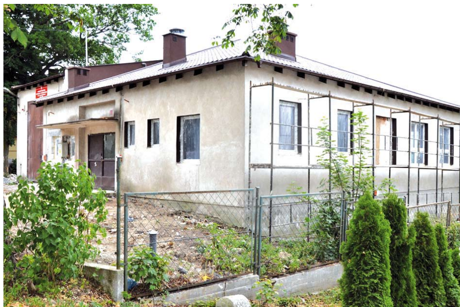
Świetlica w Dalwinie

Zgodnie z umową prace budowlane mają potrwać do października br.