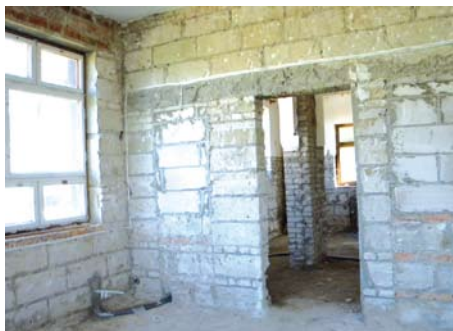
Świetlica w Dalwinie

Zadanie realizowane jest w ramach Programu Rozwoju Obszarów Wiejskich na lata