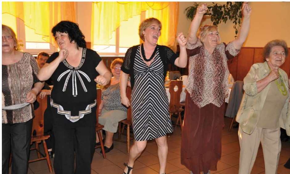
Panie bawiły się znakomicie!