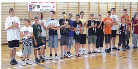
Korsarz Gimnazjum Dąbrówka