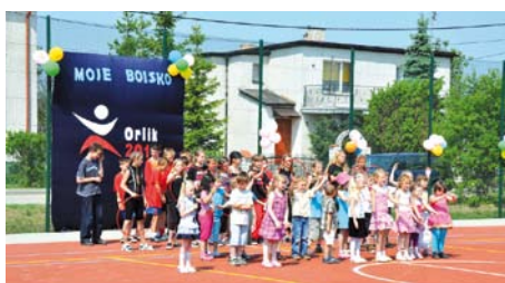
Występy dzieci ze Szkoły Podstawowej w Lubiszewie