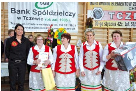
Finaliści konkursu - KGW Bałdowo

Jury konkursu miało twardy orzech do zgryzienia, ponieważ wszyscy uczestnicy zaprezentowali przepiękne ozdoby świąteczne i pyszne ciasta. Zwycięzców wybrano w dwóch kategoriach: młodzież szkolna i środowiska pozaszkolne.