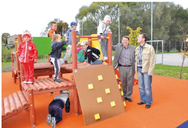
Plac zabaw wybudowany w ramach programu „Radosna szkoła”

Nowy plac zabaw powstanie również przy Zespole Kształcenia i Wychowania w Swarzędzie. W związku z utworzeniem przedszkola takie miejsce zabaw na powietrzu jest niezbędne. W Lubiszewie z kolei istniejący plac zabaw wybudowany w ubiegłym roku w ramach programu „Radosna szkoła” czeka na przedszkolaków. Natomiast starsze dzieci otrzymają plac zabaw przystosowany do wieku dzieci szkolnych.