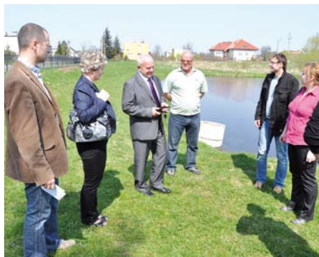
Przekazanie placu budowy w Swarzędynie

Na zadanie gmina ubiegała się o środki z Programu Rozwoju Obszarów Wiejskich. Udało się pozyskać 500 000,00 zł. Całkowi-