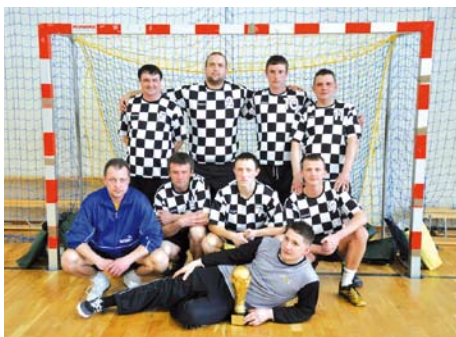
Zwycięska drużyna z Dąbrówki

Rozgrywki piłkarskie dostarczyły wiele emocji zarówno kibicom, jak i uczestniczącym drużynom. Podziękowania należą się Dyrektorowi Gimnazjum za sprawną organizację turnieju oraz wszystkim uczestnikom za udział w rozgrywkach.