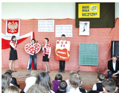
Konkurs „Moja Mała Ojczyzna”