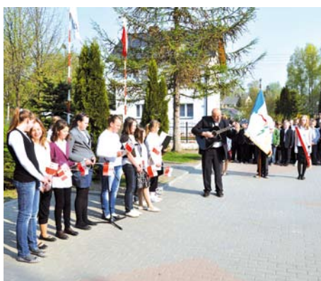
Uroczysty apel z okazji Święta Konstytucji