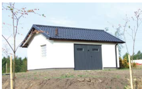
Przepompownia w Szpęgawie

W ramach zadania wybudowane zostanie 30,3 km sieci grawitacyjno- tłocznej. Kompleksowy program gospodarki ściekowej Gminy Tczew obejmuje swym zakresem budowę sieci kanalizacyjnej w Miłobądzu,