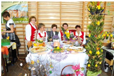
Koło Gospodyń Wiejskich z Bałdowa