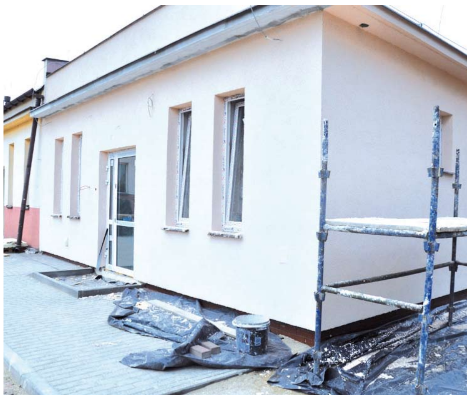
Przedszkole w Lubiszewie

Oddział przedszkolny będzie mógł przyjąć 25 dzieci przedszkolnych z obwodu Szkoły Podstawowej w Lubiszewie. Całkowity koszt projektu wynosi 422 609,29 zł. W budżecie zarezerwowane są także dodatkowe środki na wyposażenie obiektu.