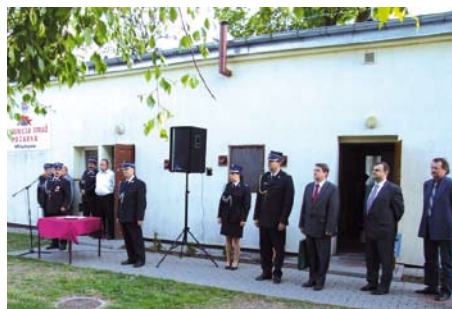
Obchody Dnia Strażaka