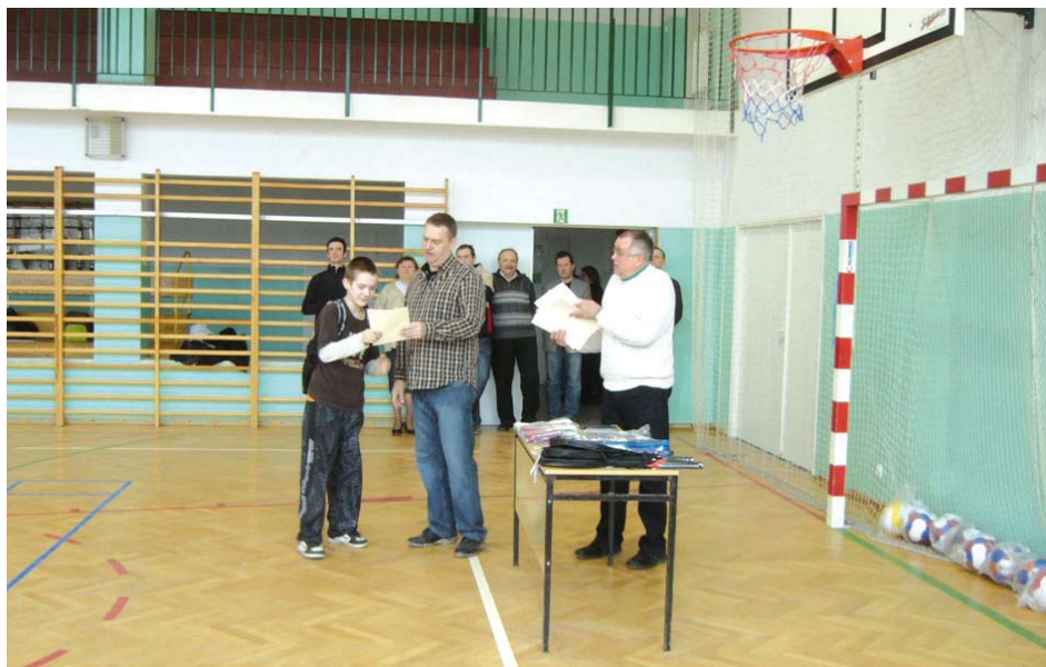
Uroczyste wręczenie dyplomów i nagród

Wszyscy uczestnicy otrzymali nagrody ufundowane przez Wójta Gminy Tczew w postaci sprzętu sportowego, gier planszowych i dyplomów.