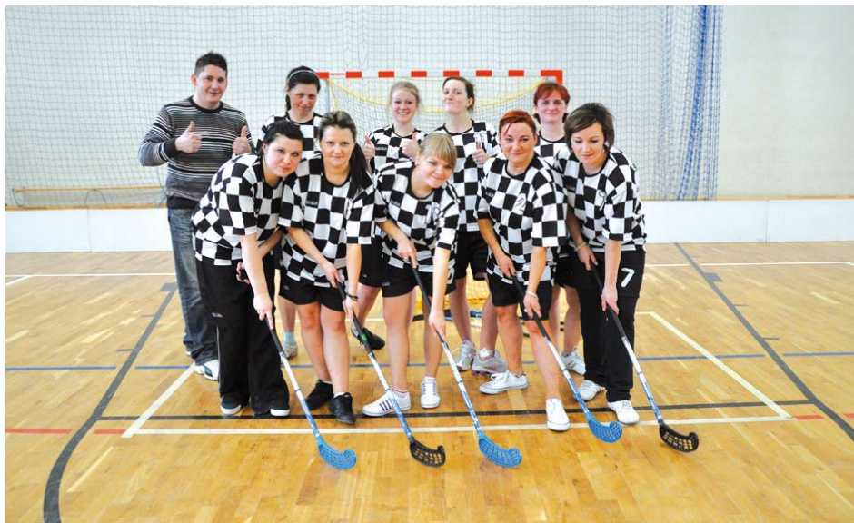
Zwycięska drużyna z Dąbrowki