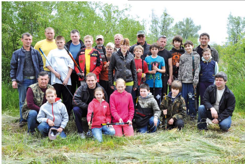
Uczestnicy zawodów wędkarskich wraz z opiekunami