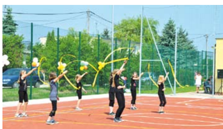
Taniec z szarfą w wykonaniu uczniów ze Szkoły Podstawowej w Lubiszewie