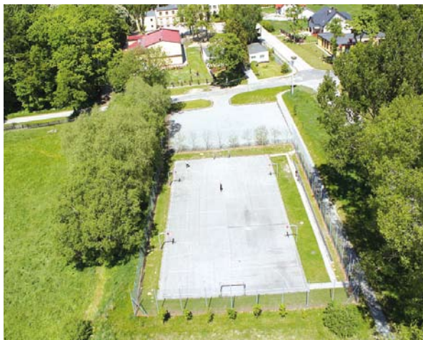
Boisko w Turzu

Ponadto w budżecie zaplanowano 30 tys na nowoczesny plac zabaw dla dzieci szkolnych w Turzu. Przy ul. Czystej zlokalizowa-