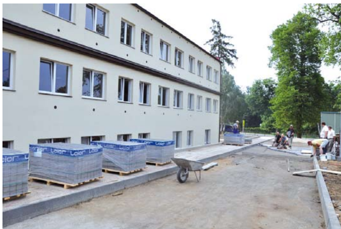
ZKiW w Swarożynie

w tym salę komputerową i salę do ćwiczeń korekcyjnych oraz 4 pomieszczenia dla personelu szkolnego. Na każdym piętrze znajdują się toalety. W podpiwniczonej części mieści się 6 boksów szatniowych oraz 4 pomieszczenia dla dzieci przedszkolnych. Do dyspozycji będzie również duży i nowoczesny węzeł kuchenny oraz 2 świetlice spełniające także funkcje stołówki.