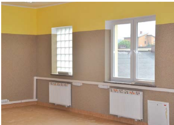
Nowa sala komputerowa w dobudowanej części ZKiW w Swarożynie

Na powyższe zadanie Wójt Gminy Tczew Roman Rezmerowski pozyskał dofinansowanie w ramach Regionalnego Programu Operacyjnego dla Województwa Pomorskiego na lata 2007-2013 Osi Priorytetowej 9. Lokalna infrastruktura społeczna i inicjaty-