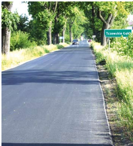
ul. Szkolna w Tczewskich Łąkach

Ulice Szkolna i Motławska wyglądają jak „autostrada”. Dalsze przebudowy dróg tj. ul. Zajązkowska i Żurawia wykona Gmina po otrzymaniu wsparcia finansowego w wysokości 50% przewidywanych kosztów zgodnie z podpisanym porozumieniem z Przedsiębiorstwem Naprawy Infrastruktury z Warszawy lidera Konsorcjum przebudowy trasy kolejowej E-65.