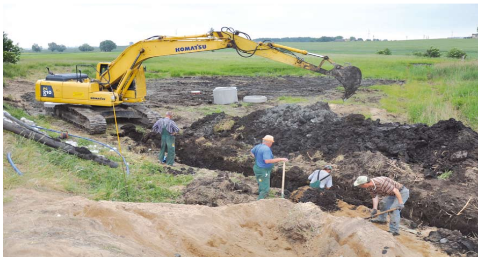
Budowa kanalizacji w Miłobądzu

Maleninie, Mieściecinie, Zajączkowie, Szpęgawie, Dąbrówce, Rokitkach i w Tczewskich Łąkach. Powstaną systemy zbierania ścieków komunalnych, które zostaną przekierowane poprzez sieć miejską do oczyszczalni w Tczewie. Łącznie zostanie podłączonych 2796 mieszkańców oraz nastąpi przyrost 522 RLM od użytkowników instytucjonalnych. Tak ogromna inwestycja ma na celu uporządkowanie gospodarki ściekowej gminy Tczew.