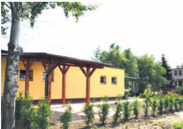
Zmodernizowany obiekt ma jeszcze bardziej ożywić życie kulturalne wsi.

Świetlica w Czatkowach została całkowicie wyremontowana. W sierpniu zakończyły się ostatnie prace modernizacyjne obiektu.