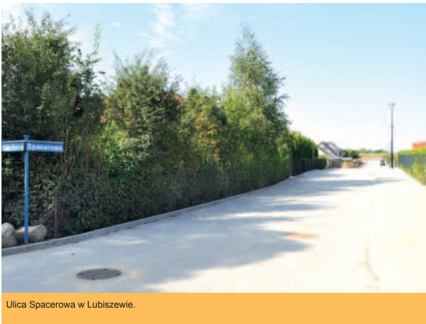
Ulica Spacerowa w Lubiszewie.

W ramach zadania wykonana została kanalizacja deszczowa, którą włączono do istniejącego grawitacyjnego kolektora zrzutowego. Na odcinku 238 metrów, bo taką długość ma ta droga, ułożona została kostka brukowa. Ponadto po jednej stronie ulicy wykonany został chodnik o szerokości 2 m, natomiast szerokość jezdni wynosi 5,5 m. Przebudowa obejmuje również zjazdy do działek. Całkowity koszt robót budowlanych to 411 627,62 zł.