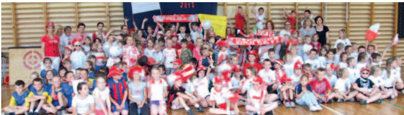
Międzyszkolny Turniej Sportowy klas I - III.