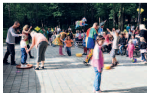
Zabawy z bańkami mydlanymi.