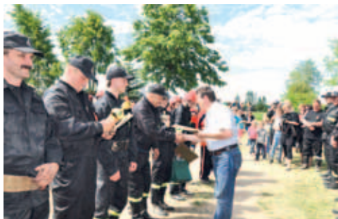
Najmilsza chwila w każdych zawodach - wręczenie pucharów i nagród.

Zwycięskie drużyny uczestniczyły w zawodach powiatowych, które odbyły się 30 czerwca br. w Tczewie. OSP Turze okazało się najlepiej przygotowaną jednostką, zdobywając pierwsze miejsca we wszystkich konkurencjach na eliminacjach powiatowych.