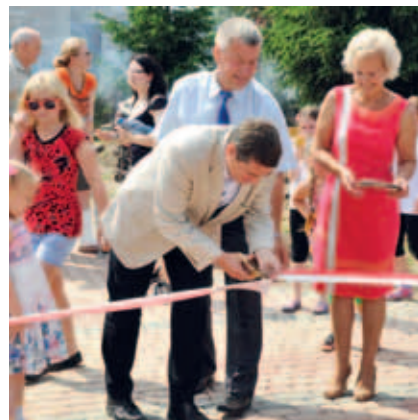
Tradycyjne przecięcie wstęgi oznacza oficjalne oddanie placu zabaw do użytkowania.

Ten dzień zapisze się w pamięci wielu osób szczególnie tych zamieszkanych w Szpęgawie, ponieważ było to otwarcie pierwszego elementu, który wchodzi w skład dużego projektu koncepcyjnego zagospodarowania parku w Szpęgawie.