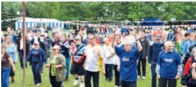
Uczestnicy festyn rozpoczęli od rozgrzewki - w rytm muzyki wykonywali ćwiczenia naśladując instruktorkę.

Impreza zakończyła się wspólnym śpiewaniem i tańcami przy znanych melodiach.