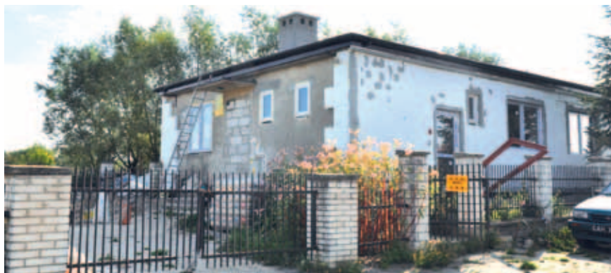
Świetlica w Śliwinach.

Całkowity koszt robót budowlanych to prawie 302 tys. zł. Na to zadanie gmina ubiega się o dofinansowanie w ramach Programu Rozwoju Obszarów Wiejskich. Obecnie wniosek jest w trakcie oceny.