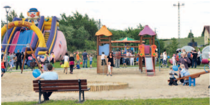
Ten dzień mieszkańcy świętowali hucznie - atrakcji do tego nie brakowało.