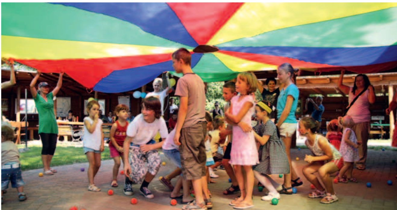
Bawili się nie tylko dzieci - rodzice aktywnie brali udział w zabawach.

Kursy i szkolenia pierwszej grupy uczestników rozpoczęły się już w sierpniu i potrwać do grudnia.