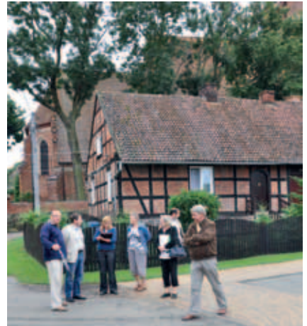
Remont chodnika w Miłobądzu zakończony i odebrany przez komisję odbiorową.

Wykonawcą robót był Zakład Produkcyjno – Usługowo – Handlowy PEKUM sp. z o.o. z Pszczółek, a nad prawidłowym wykonaniem zadania czuwał inspektor nadzoru Waldemar Żmuda. Koszt robót budowlanych to 16.141,77 zł.