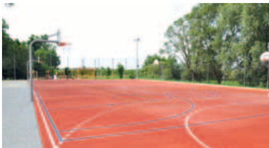
Nowoczesny obiekt sportowy sprzyja upowszechnianiu kultury fizycznej.

W ramach zadania wykonano odwodnienie terenu oraz położono poliuretanową nawierzchnię typu „natrysk”. Zamontowane zostało także nowe oświetlenie, które swym zasięgiem obejmuje nie tylko boisko, ale również parking i place zabaw znajdujące się w sąsiedztwie. Lampy