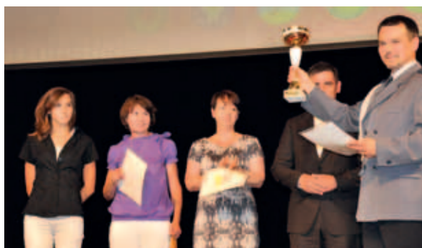
Puchary i dyplomy dla uczestników turnieju siatkówki.