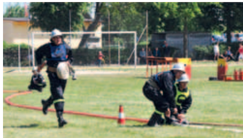
Jedną z konkurencji było zbudowanie linii gaśniczej.