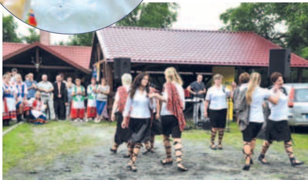
Koło reaktywowało się w 2010 r. i obecnie liczy 20 osób - wszystkie panie są aktywne i chcą rozwijać życie kulturalne w Tczewskich Łąkach.