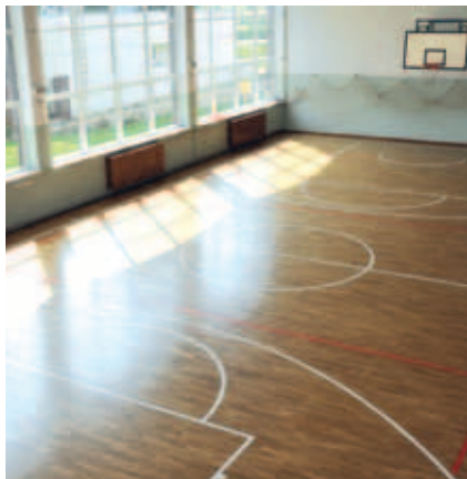
Sala gimnastyczna w Turzu lśni czystością i świeżością.

N a ścianach położony został tynk strukturalny, a parkiet został odnowiony. Wykonano także nowe osłony grzejników oraz listwy odpowietrzające. Ponadto wymalowane zostały pomieszczenia socjalne. Koszt zadania to ok. 65 tys. zł.