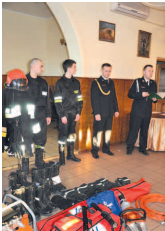
Jednostka OSP Swaróżyn jeszcze bardziej usprawni swoje działania - pomoże jej w tym nowy sprzęt.