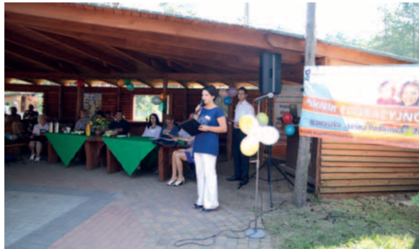
Piknik edukacyjno-integracyjny zorganizowany był przez Gminny Ośrodek Pomocy Społecznej.

Została także przeprowadzona rekrutacja osób, które zostały objęte projektem. Zgłosiło się ponad 50 osób. Miejsc jest tylko 48, dlatego też została utworzona dodatkowa lista - rezerwowa. Zgłoszone osoby podpiszą kontrakty socjalne, w ramach których objęte zostaną opieką specjalistów tj. psychologa