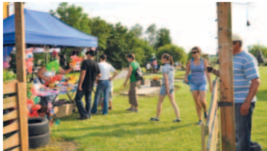
Festyn w Miłobądzu.