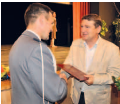
Wójt złożył na ręce Komendanta gratulacje oraz życzenia dla wszystkich policjantów.