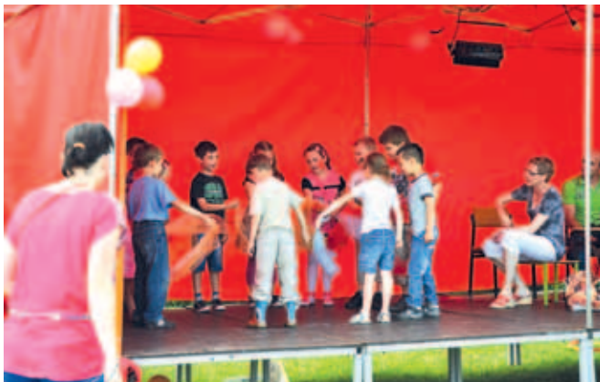
Zaproszeni goście podziwiali młodych artystów na scenie.