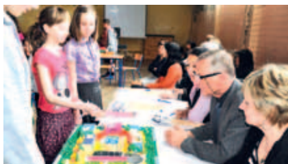
Dzieci przedstawiały swoją wizję na nowoczesne centrum rekreacyjno-sportowe dla mieszkańców gminy Tczew.

Po raz szesnasty stanęły do rywalizacji zespoły ze szkół podstawowych z Lubiszewa, Turza, Swarżyna i Miłobądku.