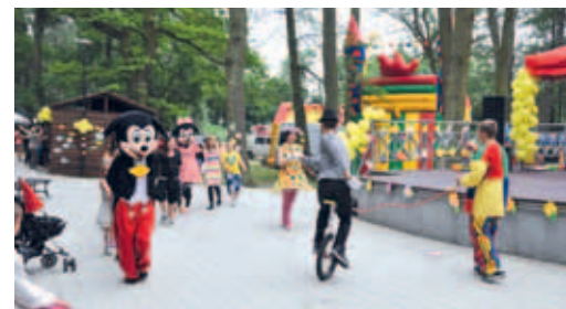
Razem z mieszkańcami gminy Tczew lato witała Myszka Miki i Mini.