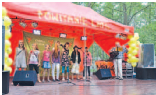
Występ zespołu Syrenki z Miłobądzia.