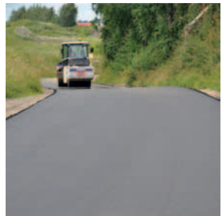
Wyasfaltowana droga Śliwiny - Rokitki.

Odcinek 500 m drogi łączącej Śliwiny z Rokitkami został utwardzony.