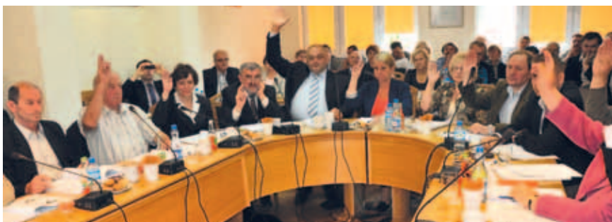
Radni Gminy Tczew podczas głosowania nad uchwałą w sprawie udzielenia Wójtowi absolutorium za wykonanie budżetu w 2011 r.

W drugiej części sesji pod głosowanie poddano 10 projektów uchwał. Wszystkie uchwały za wyjątkiem jednej zostały podjęte. Uchwała odrzucona przez Radnych to uchwała w sprawie przystąpienia do sporządzenia miejscowego planu zagospodarowania przestrzennego dla fragmentu obrębu geodezyjnego Miłobądz.