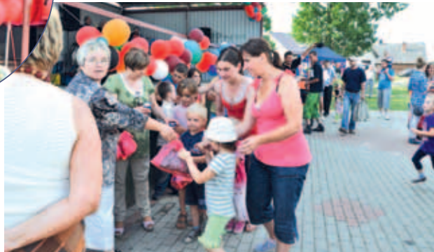
Organizatorzy zadbał o różne atrakcje dla mieszkańców.