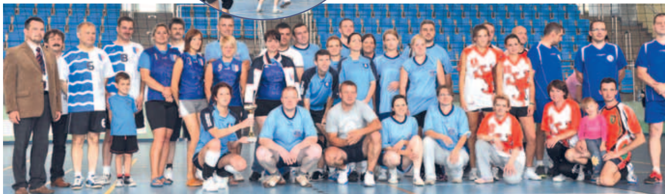
Integracja i rywalizacja - turniej siatkówki.