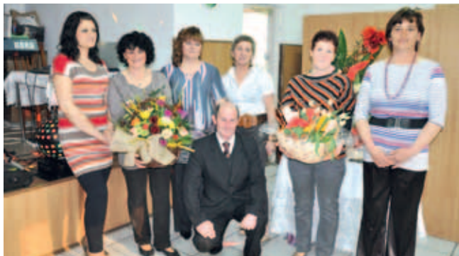
W tym roku KGW Malenin świętowało swój okrągły jubileusz.