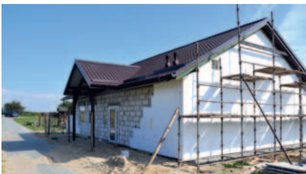
Mieszkańcy z niecierpliwością czekają na nową świetlicę

Świetlica ożywi życie kulturalne i społeczne sołectwa. Do tej pory zebrania wiejskie odbywały się w domu pani sołtys, a działalność wsi była ograniczana ze względu na brak miejsca spotkań. Nowy obiekt pełnić będzie rolę małego centrum edukacyjno-kulturowo-społecznego. Na bazie świetlicy odbywać się będą liczne imprezy okolicznościowe, które jeszcze bardziej zintegrują mieszkańców.