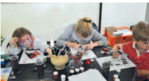
Warsztaty plastyczne dla dzieci.