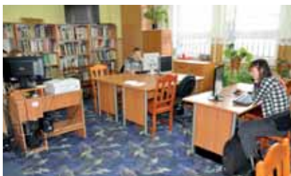
Gminna Biblioteka Publiczna w Swarzędzie.

Swoją działalnością może się pochwalić należąca do Gminy Tczew Gminna Biblioteka Publiczna, mieszcząca się w Swarzędzie na ul. Piastowskiej 25. Przedmiotem jej działalności jest gromadzenie, opracowanie, przechowywanie i ochrona materiałów bibliotecznych, a przede wszystkim udostępnianie zbiorów