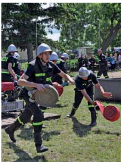
Przedstawiciele jednostek OSP rywalizowali w dwóch konkurencjach: sztafeta pożarnicza i ćwiczenie bojowe.

Zgodnie z regulaminem zawodów przedstawiciele jednostek OSP rywalizowali w dwóch konkurencjach: sztafeta pożarnicza i ćwiczenie bojowe. Sztafeta pożarnicza wyglądem przypominała