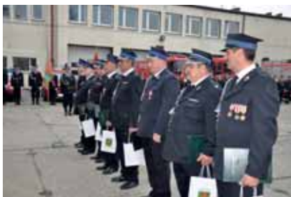
Wójt Gminy Tczew wyróżnił strażaków nagrodą rzeczową za wzorową działalność oraz osobiste zaangażowanie w bezpieczeństwo mieszkańców gminy Tczew oraz powiatu tczewskiego.

Ochotniczy ruch strażacki chlubnie zaznaczył swoje istnienie na kartach historii narodu i państwa polskiego. Przykłady poświęcenia w niesieniu ratunku i pomocy są udziałem licznej rzeszy strażaków ochotników, którzy swoją działalnością zyskują uznanie społeczne. Walka z żywiołem ognia i sił przyrody, ratowanie zdrowia, życia i mienia w obliczu wypadków, katastrof oraz zdarzeń losowych, to tylko