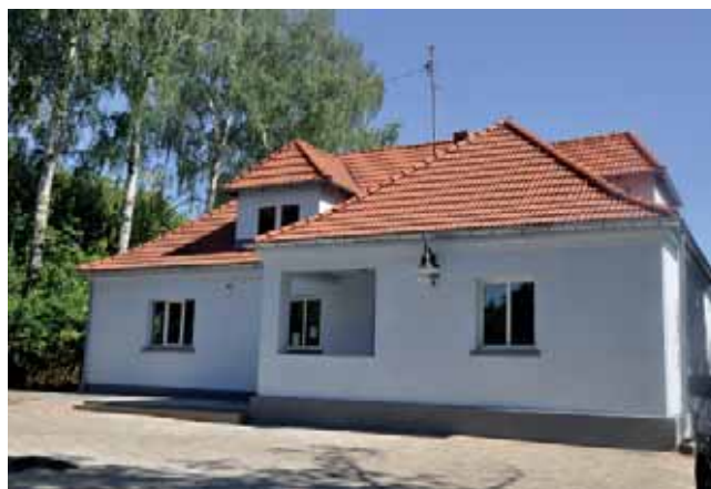
Ośrodek Zdrowia w Swarzędzie.

Pacjenci z Ośrodka Zdrowia w Swarzędzie, na czas remontu przychodni, mogą korzystać ze wszystkich placówek ZOZ Medical Sp. z o.o. (wykaz na stronie www.zozmedical.pl ). Najbliższe ośrodki zdrowia to: w Turzu przy ul. Parkowej 12 tel. 58 536 77 20, w Miłobądku przy ul. Pamięci Narodowej 10, tel. 58 530-03-77, w Tczewie przy ul. Konarskiego 15 (Czyżkowo) tel. 58 531 18 70 oraz ul. Kościuszki 11 tel. 58 5313573. Dla osób wymagają-