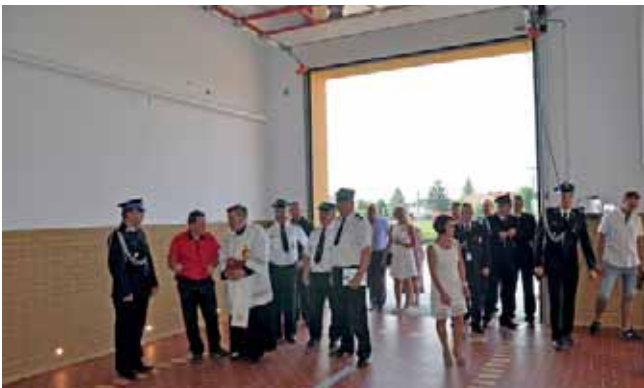
Nowe boksy garażowe w remizie OSP w Swarzędzie.

Jednostka OSP Swarzędz w swoich szeregach skupia 22 członków, w tym 2 kobiety, 4 funkcjonariuszy Państwowej Straży Pożarnej i 2 ratowników medycznych. Na wyposażeniu jednostka posiada dwa samochody: lekki ratownictwa technicznego oraz średni gaśniczy. Posiada również ciężki zestaw hydraulicznych narzędzi ratowniczych, agregaty prądotwórcze, w tym jeden z największych w powiecie tczewskim. OSP w zeszłym roku zakupiła z pozyskanych dotacji motopompę Tohatsu najnowocześniejszą w gminie Tczew. Wyposażona jest w detektor gazowy do badania zawartości dwutlenku węgla w powietrzu oraz wiele innego nowoczesnego sprzętu. Jednostka ta z uwagi na usytuowanie blisko autostrady A1 jest najprężniej działającym oddziałem na terenie Gminy Tczew. Tylko w ubiegłym roku wyjechała do 17 pożarów i 25 zagrożeń miejscowych, w tym wypadków samochodowych i innych. Zrealizowana inwestycja przyczyni się przede wszystkim do szybszego wyjazdu strażaków na akcje ratowniczo-gaśnicze i tym samym do szybszego dotarcia na miejsce wypadku, co ma ogromny wpływ na skutki danego zdarzenia.