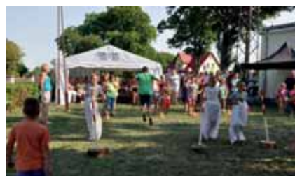
Festyn sportowo-rekreacyjny w Miłobądzu.

19 zaczęła się zabawa taneczna dla dorosłych i trwała do późnych godzin wieczornych. Imprezę poprowadził DJ