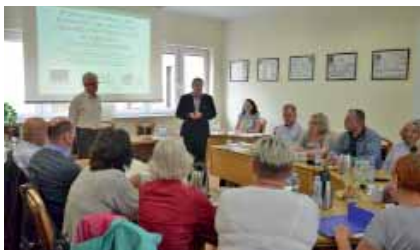
Spotkanie informacyjne o nowej Lokalnej Strategii Rozwoju.

Formularze do wypełnienia dostępne są na stronie www.wstega-kociewia.pl