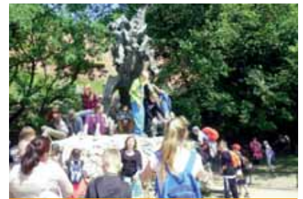
Wycieczka do Częstochowy.

Jaskinię Mroźną, Morskie Oko oraz Wieliczkę. Wszyscy uczestnicy zażyli kąpiele w termach w Bukowinie Tatrzańskiej. Czas pobytu w Częstochowie przypadł na Oktawę Bożego Ciała. Dzieci aktywnie brały udział w procesji na Jasnej Górze. Dziewczynki pruszyły kwiatki, a chłopcy nieśli obrazy. Było to wielkie duchowe przeżycie dla nich i opiekunów. Dzieci wróciły zadowolone i bogatsze o wspaniałe wrażenia.