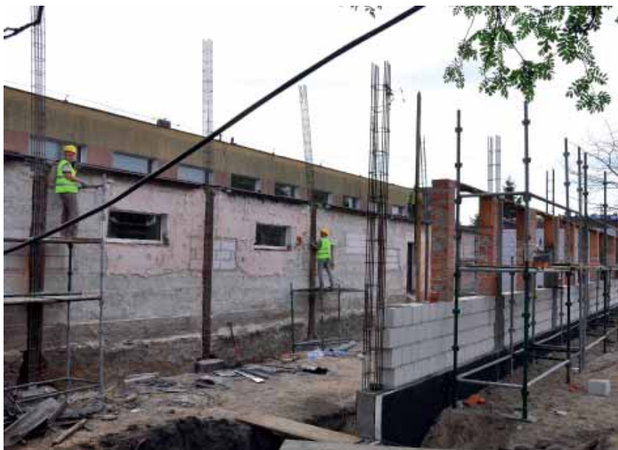
Rozbudowa Szkoły Podstawowej w Miłobądku.

Szkoła zlokalizowana jest na działkach nr 102/2 oraz 102/5 przy ulicy Szkolnej w centrum wsi Miłobądk. Dzięki inwestycji szkoła powiększy się o prawie 900 m 2 powierzchni użytkowej, a istniejący budynek przejdzie generalny remont. Pomieszczenia zostaną przebudowane w zamiarze jak najlepszego zagospodarowania szkoły na cele lekcyjne, socjalne i sanitarne, a także w celu zapewnienia oddzielnego miejsca dla przedszkolaków. Położona zostanie nowa instalacja elektryczna oraz wodno-kanalizacyjna. Wymieniona zostanie stolarka drzwiowa i okienna. Dach będzie docieplony oraz położona zostanie nowa elewacja. Rozbudowana zostanie biblioteka, stołówka oraz kuchnia. Uczniowie będą mieli do dyspozycji 12 sal lekcyjnych, każda o powierzchni ok. 60 m 2 . W ramach zamówienia przewidziano także zakup wyposażenia do pomieszczeń szkolnych nowopowstających oraz doposażenie już istniejących. Przewidziano m.in.: wyposażenie w sprzęt multimedialny i elektroniczny sal komputerowych oraz językowych. Nowe sale lekcyjne zostaną umeblowane oraz wyposażone w pomoce dydaktyczne (książki, tablice edukacyjne, gry edukacyjne). Do części przedszkolnej przewidziano zakup nowego umeblowania sal, zakup zabawek oraz pomocy dydaktycznych, które będą rozwijały umiejętności przedszkolaków zarówno umysłowe jak i ruchowe. Doposażona zostanie kuchnia oraz zaplecze kuchenne (naczynia, garnki, regały kuchenne, urządzenia kuchenne). Zadanie przewiduje także doposażenie świetlicy szkolnej (stoły, krzeselka), biblio-