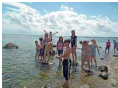
Półkolonie dla dzieci z Zespołu Kształcenia i Wychowania w Turzu.

Dzięki życzliwości Wójta Gminy skorzystały z gimbusa i zwiedziły wybrzeże Morza Bałtyckiego. Były na Klifie Redłowskim, w Sopocie, Sobieszewie, Brzeźnie oraz w Borównie. Bawiły się na brzegu morza, budowały zamki z piasku, zażywały licz-