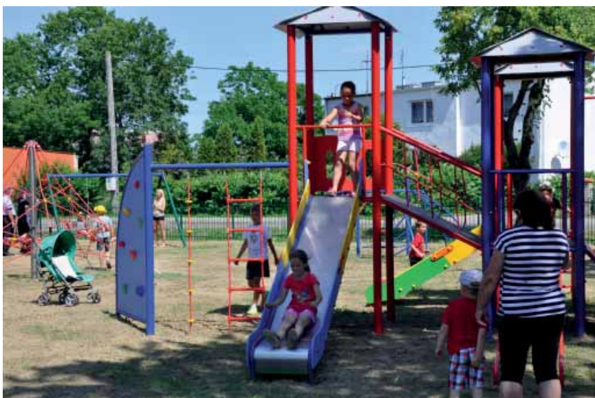
Nowy plac zabaw w Dąbrówce.

Nowy, ogrodzony plac wyposażony został w osiem elementów zabawowych takich jak: piaskownica, zestaw dla malucha, dwie huśtawki, zestaw typu Twierdza, zestaw wspinaczkowy, karuzela z siedziskiem, piramida linowa. W ramach zadania zamontowano również ławeczki do siedzenia, stojak na rowery oraz kosze na śmieci. Dodatkowo na placu wydzielona została strefa fitness, gdzie znajdują się urządzenia do ćwiczeń (wahadło, ławeczka do brzusków i stepper). Koszt zadania to kwota ponad 100 tys. zł, z czego 75% kosztów kwalifikowalnych stanowi kwota dofinansowania, którą Gmina pozyskała w ramach działania „Odnowa i rozwój Wsi” objętego Programem Rozwoju Obszarów Wiejskich na lata 2007-2013.