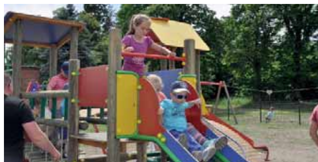
Nowy plac zabaw w Gniszewie.