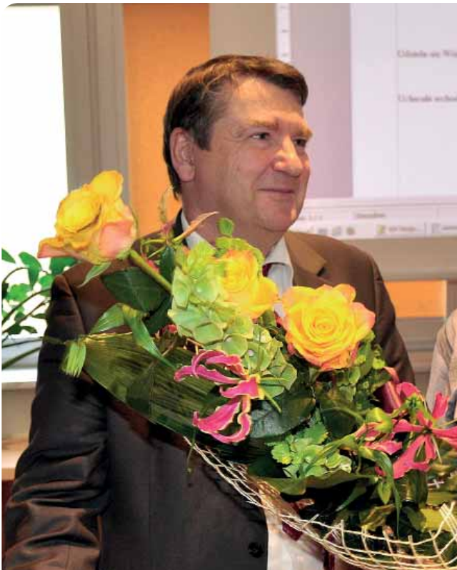
Wójt Gminy Tczew otrzymał absolutorium jednogłośnie.