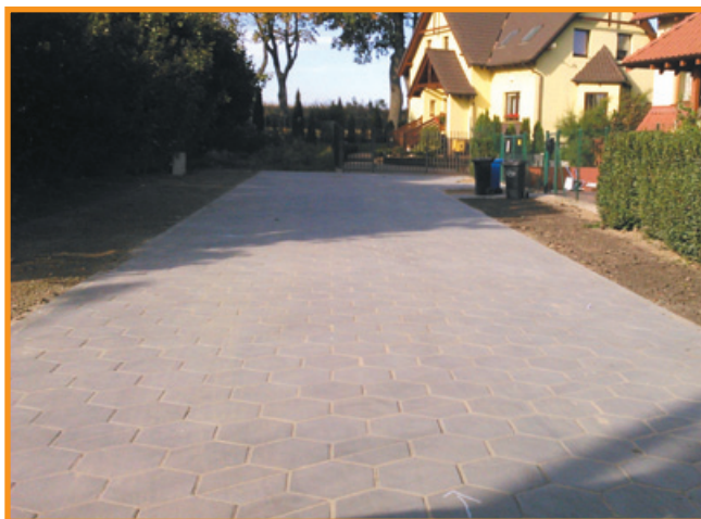
Szpegawa ul. Sosnowa

Infrastruktura wodociągowa i sanitacyjna wsi to kolejny znaczący obszar zadań, które pochłaniają pokaźną kwotę w corocznym budżecie gminy. W roku obecnym wybudowane zostały kolejne odcinki sieci wodociągowej i kanalizacyjnej. Na bieżąco modernizowane są obiekty oraz urządzenia zapewniające