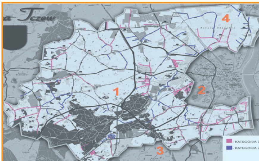
Mapa gminy, na której zaznaczone są drogi gminne wraz z kolejnością ich odśnieżania.

W ramach zadania Gminę Tczew podzielono na cztery rejony. W każdym z nich określono kolejność odśnieżania dróg gminnych. Klasyfikacja ta dokonana została ze względu na stopień trudności zimowego utrzymania, zwartość zabudowy, trasy komunikacji publicznej oraz wzmożonej komunikacji lokalnej.