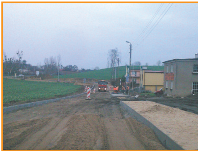
Czarlin ul. Spacerowa

gawie, a w ostatnim kwartale rozpoczęto jeszcze przebudowę ulicy Spacerowej w Czarlinie i ul. Topolowej w Miłobądku. Stan dróg w gminie zdecydowanie